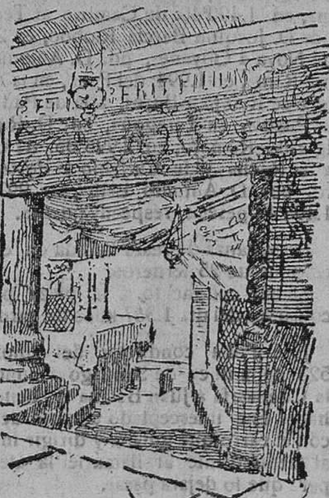
Nicho del pesebre

Tuvo esta sus puertas, dignas, sin duda, del santuario, como lo prueban, algu-