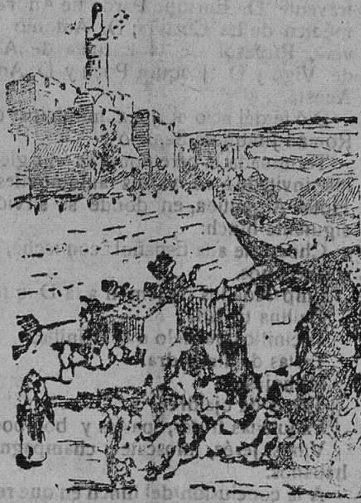
Camino de Bellehem

Penetra en la ciudad por la parte de Jerusalén, nos encontramos en una calle estrecha y tortuosa, que corta a Betlehem en casi toda su longitud. A su final