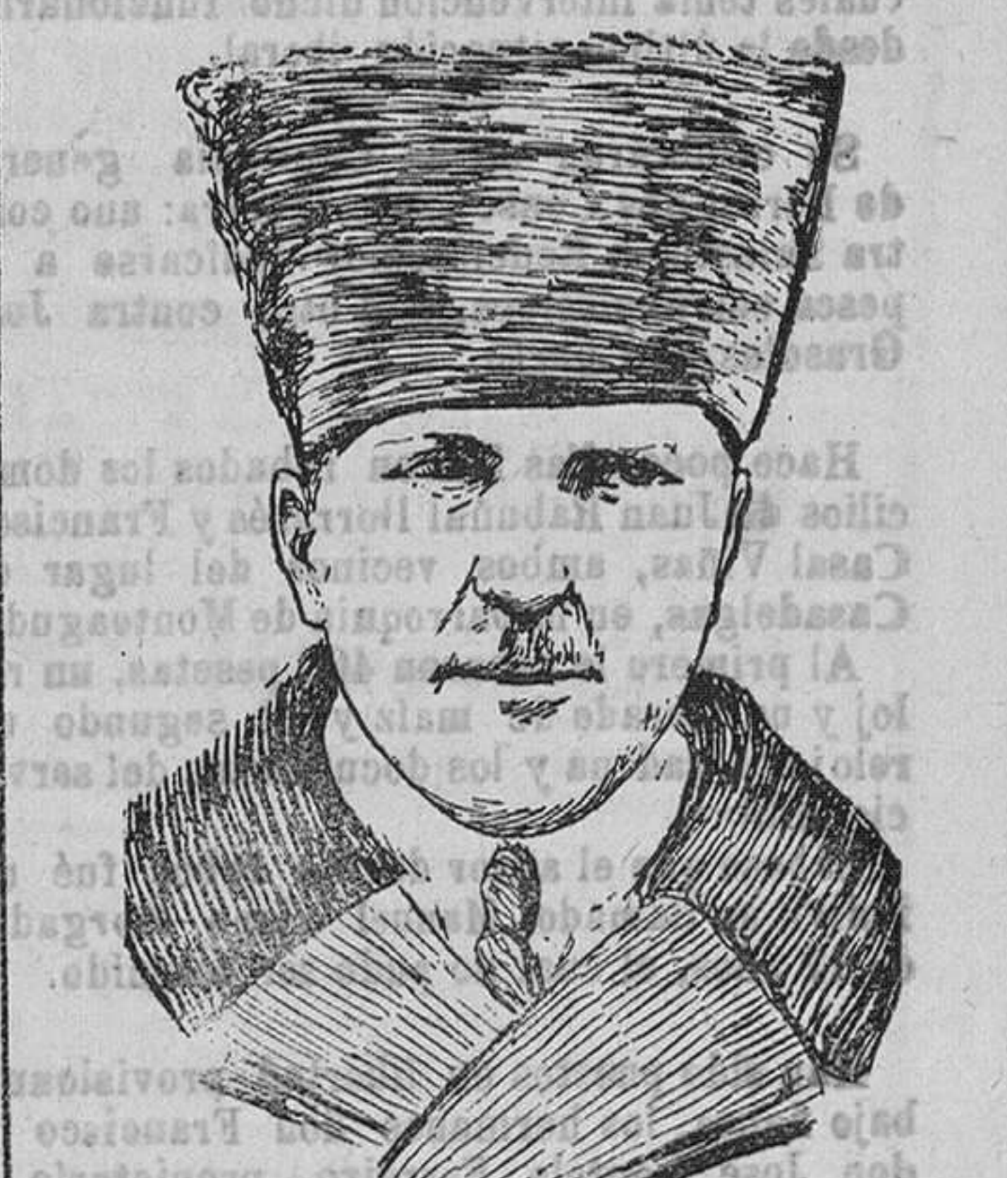
El mariscal Mustafá Kemal, presidente de la República de Angora, que se halla enfermo de cuidado.