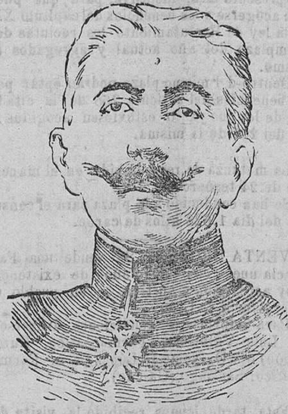
El mariscal Lyautey, en cuyo honor se ha celebrado estos últimos días el quincuagésimo aniversario de su ingreso en la Escuela militar de Saint Cyr.