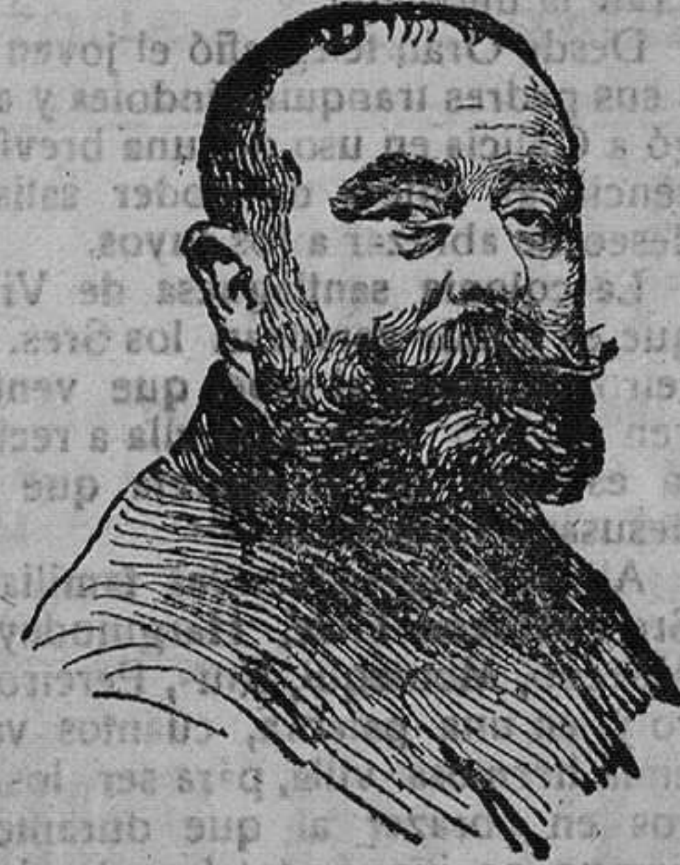
D. Juan de la Cierva, Ministro de la Guerra en el nuevo Gobierno.