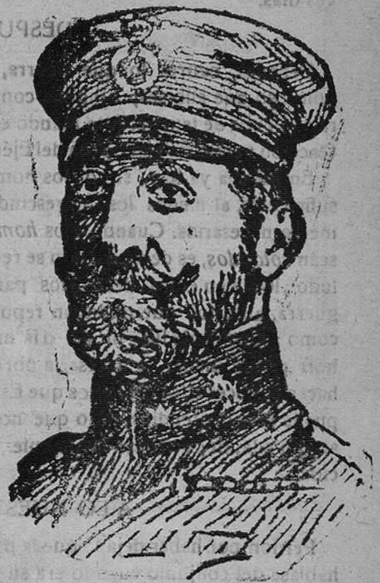
El general Navarro que tan heroicamente resistió en Monte Arruit