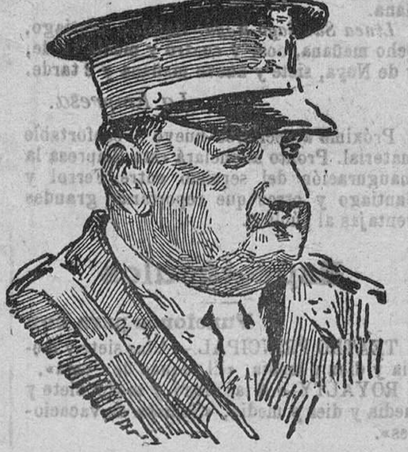
El general D. Federico Berenguer