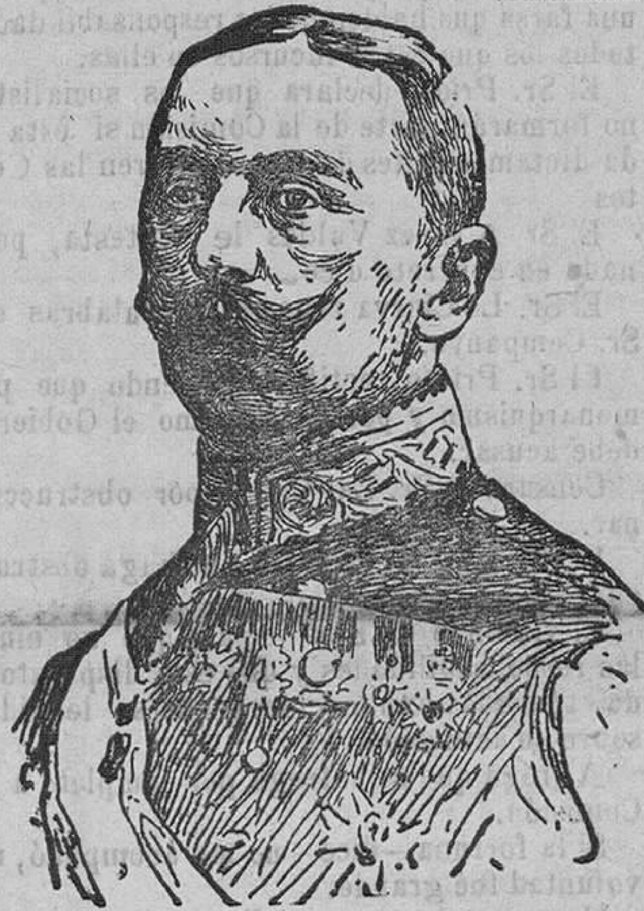
S. A. R. el Príncipe D. Jaime de Borbón de quien se dice que contraerá matrimonio en París el próximo día 25 festividad del Apóstol Santiago, día de su onomástico