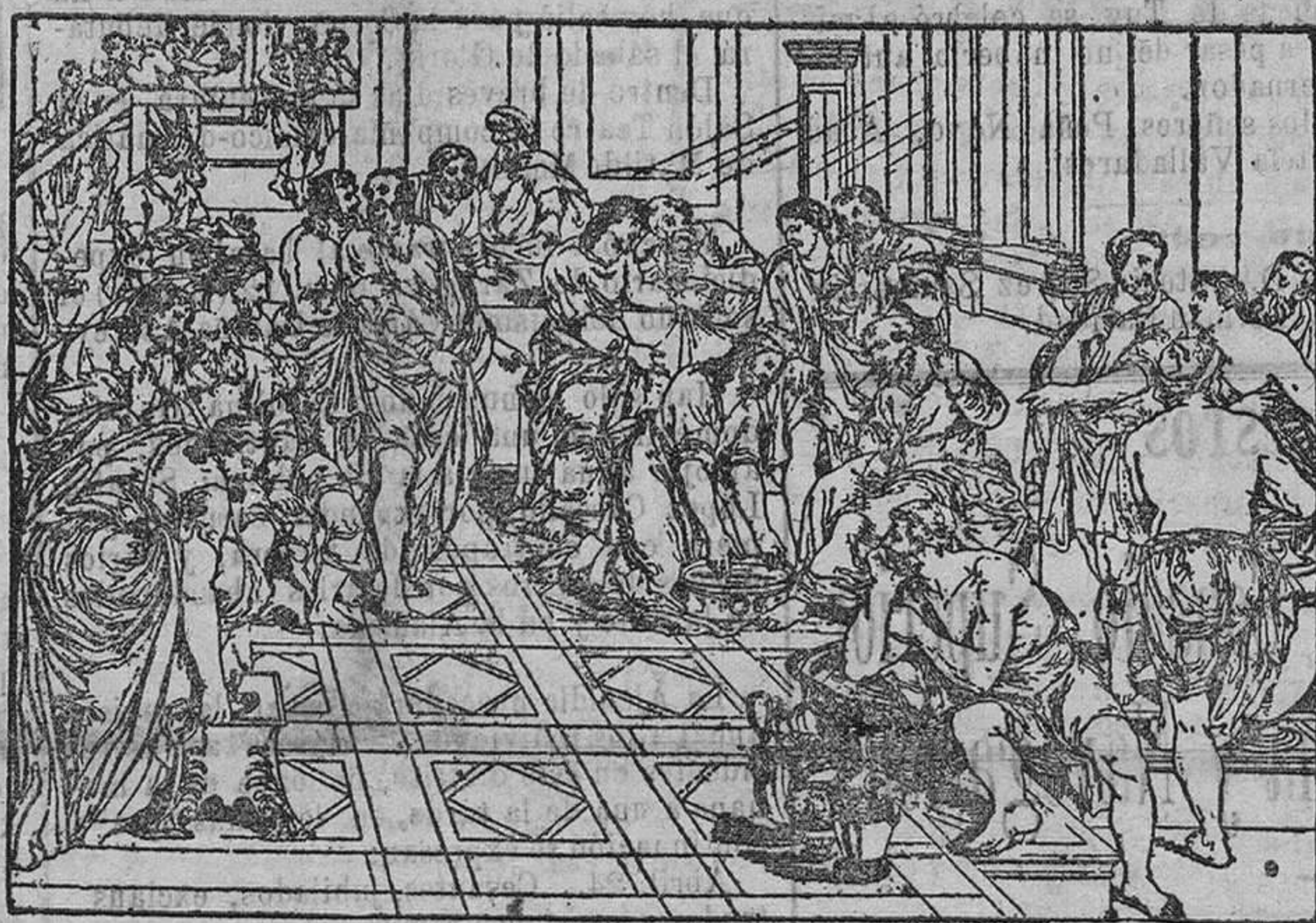
Cuadro de Tiziano, joya artística de gran valor que se conserva en la Catedral de Reims.