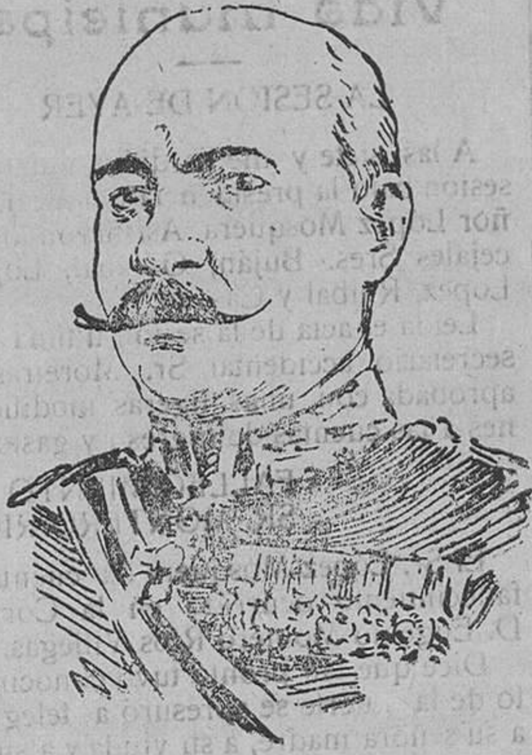
General Rauller, comandante del primer ejército rumano que opera en la Valaquia.