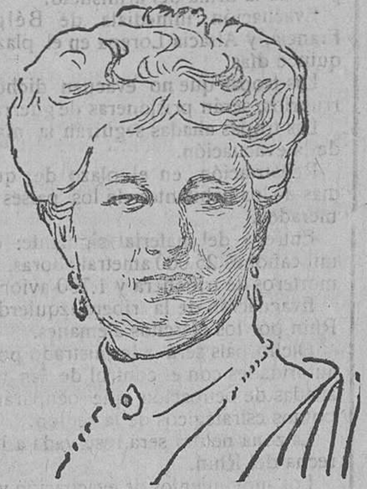
La emperatriz Augusta Victoria, esposa del Kaiser.

crucero «Panther», y estuvo a punto de plantearse una guerra franco-alemana. E conflicto se solucionó mediante la cesión