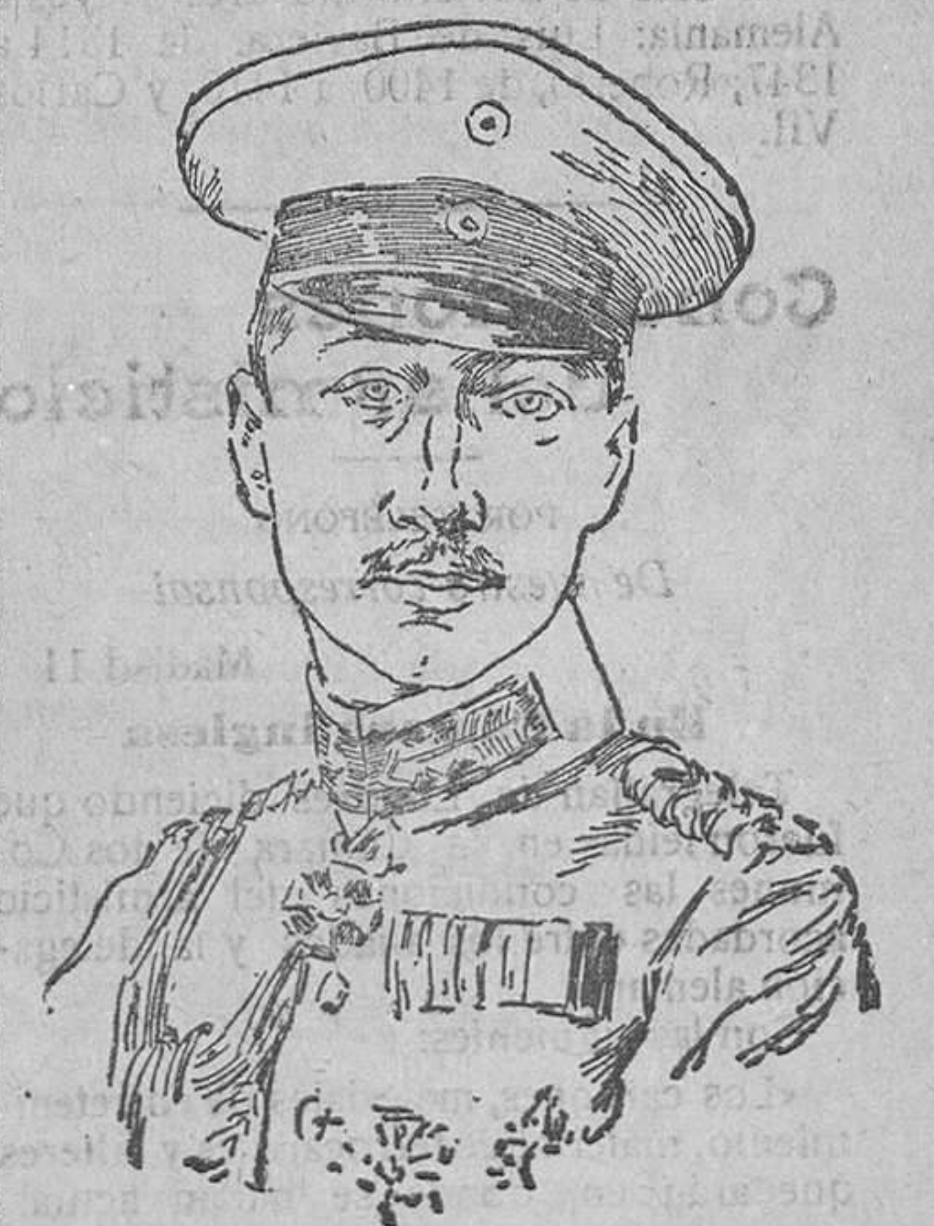
El Kromprinz Federico Guillermo, hijo primogénito del Kaiser que también renunció los derechos a la corona.

Al rechazar la Dieta federal el Gobierno del Duque de Cumberland, la Asamblea Nacional del Ducado eligió, en Octubre de 1885, Regente de Brunswick al Príncipe Alberto de Prusia, que fué quien firmó, en 1886, un Convenio mili-