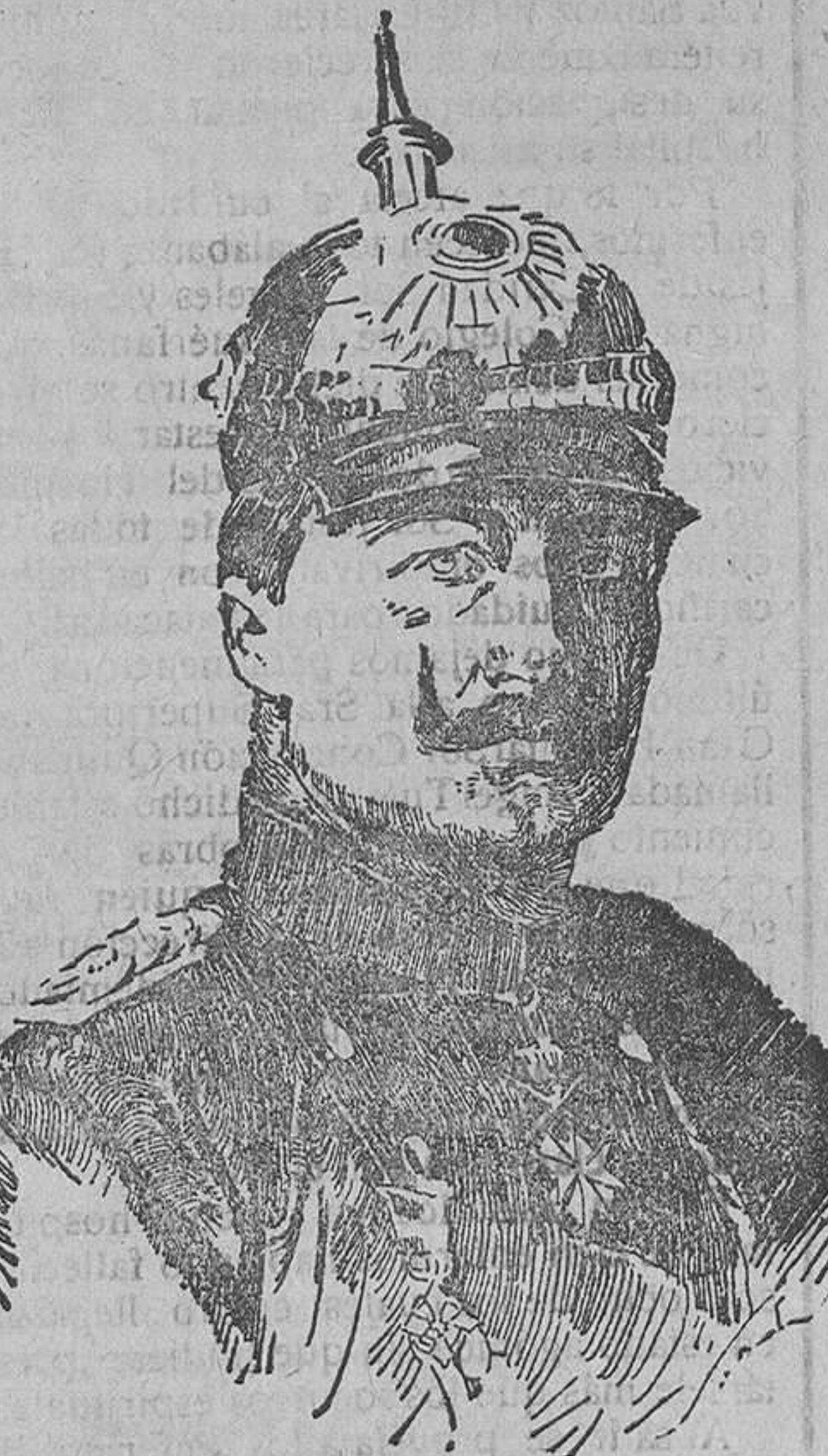
El Emperador Guillermo II, que acaba de abdicar la corona.

Con la revolución en las calles, con la huelga en los ferrocarriles y en los asti-