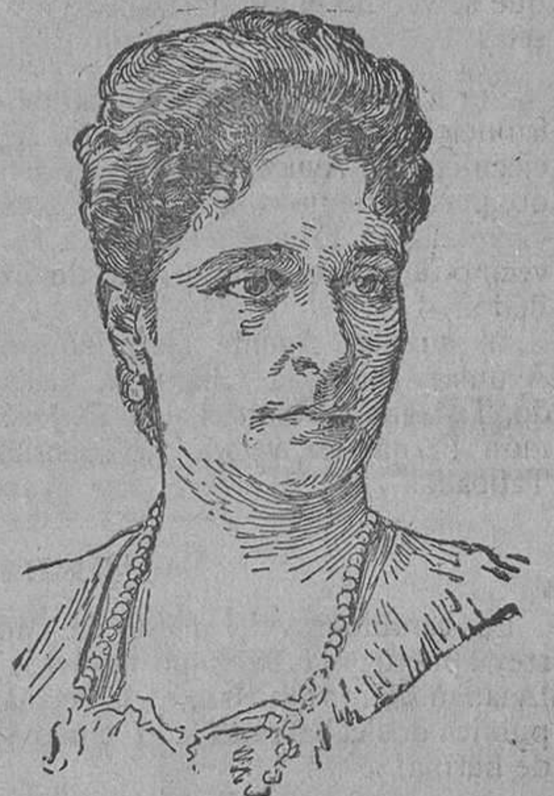
La exzarina Alejandra de Rusia que fué destronada por la revolución con su esposo y de quien ahora se apoderaron los alemanes.

Como se recordará los revolucionar- ios rusos prelestaron para destronar a los Zares que la Zarina estaba entrega- da a Alemania.