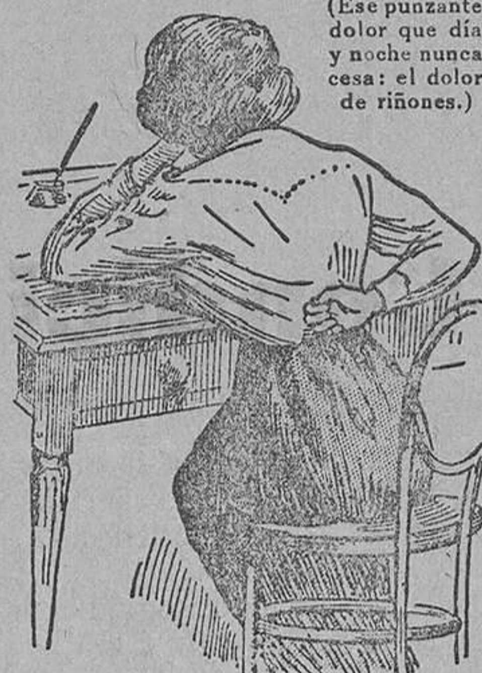
(Ese punzante dolor que día y noche nunca cesa: el dolor de riñones.)

Parece como si una desoladora y destructora ola estuviera precipitándose sobre España. Durante la semana pasada llegaron cartas de distintas regiones como Galicia, al Norte y Andalucía al Sud, al igual que de varias poblaciones de menor importancia. En casi todas las cartas se piden datos. Cada firmante pide cuál es el significado de aquellos males y dolores de las distintas partes del cuerpo de que todo el mundo parece padecer. Otros se quejan de rigidez de las articulaciones, dolores agudos en la espalda, boca amarga por la mañana, orina turbia, estreñimiento, ojos hinchados y sensación general de debilidad y mal humor. En varios casos dichos males han revestido tanta gravedad que se han transformado en enfermedades específicas como: reumatismos, gota, lumbago, ciática, cistitis (inflamación de la vejiga), piedra y cálculos. Cada persona es víctima de una enfermedad que se convierte rápidamente en envenenamiento de la sangre: la enfermedad de los riñones. Ese cruel mal está efectuando su terrible trabajo en toda España, y por él cada semana se mueren centenares de individuos que hubieran vivido en buena salud si sólo hubiesen tomado ordinarias precauciones. Estas indicaciones prueban cuán graves pueden resultar los dolores de riñones si se descuidan.