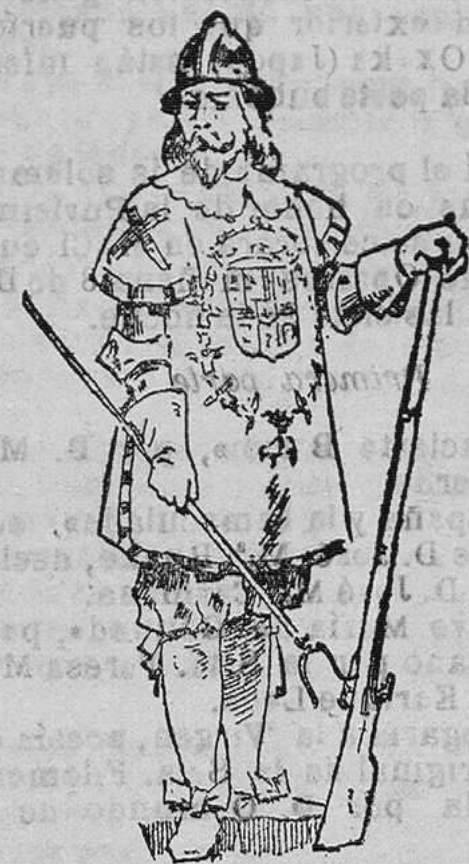
Mosquetero del siglo XVII

Sus trajes lo componían el monico , el brachial , ó bien el colobio ó levitonario , cubriendo sus piernas con los anchos calzones llamados bragas , y los pies, con los sockos llevando en la cabeza una especie de mitra, que denominaban caramiello . Las armas eran el arco y el carcaj, bastón con pomo de hierro y regatón de acerada punta, y el dolón (puñal).