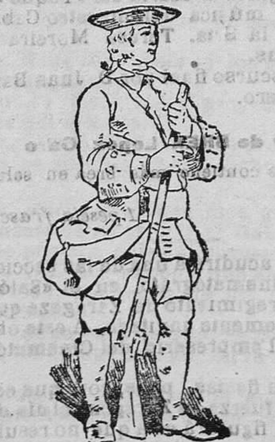
Fusilero de 1750 a 1759

La influencia en el siglo XIII, produjo gran refinamiento en los trajes y armas de nuestro ejército, y tomando de los invasores adoptó la infantería el alfanje, introduciéndose también en aquella época, la espada, la lanza y el puñal, que trajeron los cruzados de Oriente, y el segur de dos filos, la perra de clavos, el martillo, la facha y la piumada, que se debieron a los bretones, provenzales, borgoñeses y sajones que vinieron a España.