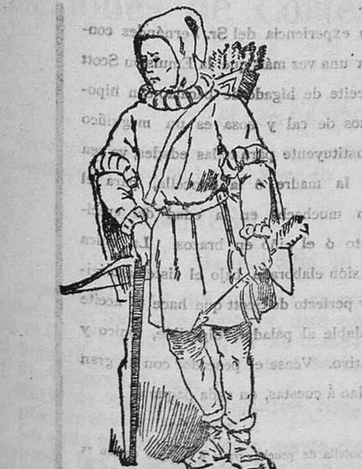
Ballestero del siglo XV

Sus prendas de vestir eran la túnica manicada de lana ó lino blanco, para los meridionales y de vellón negro, cañida con balteo , y bragas para los del N. y O., completando tan sencilla vestimenta las cerreas y abarcas , tejidas de cerda ó crin, con que resguardaban las extremidades inferiores. Sus armas defensivas eran un casco de bronce ó de hierro ó de varias ómezas rematadas en plumas, rayas ó en una especie de capillo de crin, y un escudo de cuero y de defensas, espada larga y ancha de dos filos, de acero ó cobre, bien templado por las aguas del Tago del Salo, el hacha, el puñal llamado rhamba ó saabim , la lanza, el bidente y el tridente, el espuro y los dardos, geses , usando, además, los baleares, sus tumbles hondas, el schide y los dardos sarríenes y sudes .