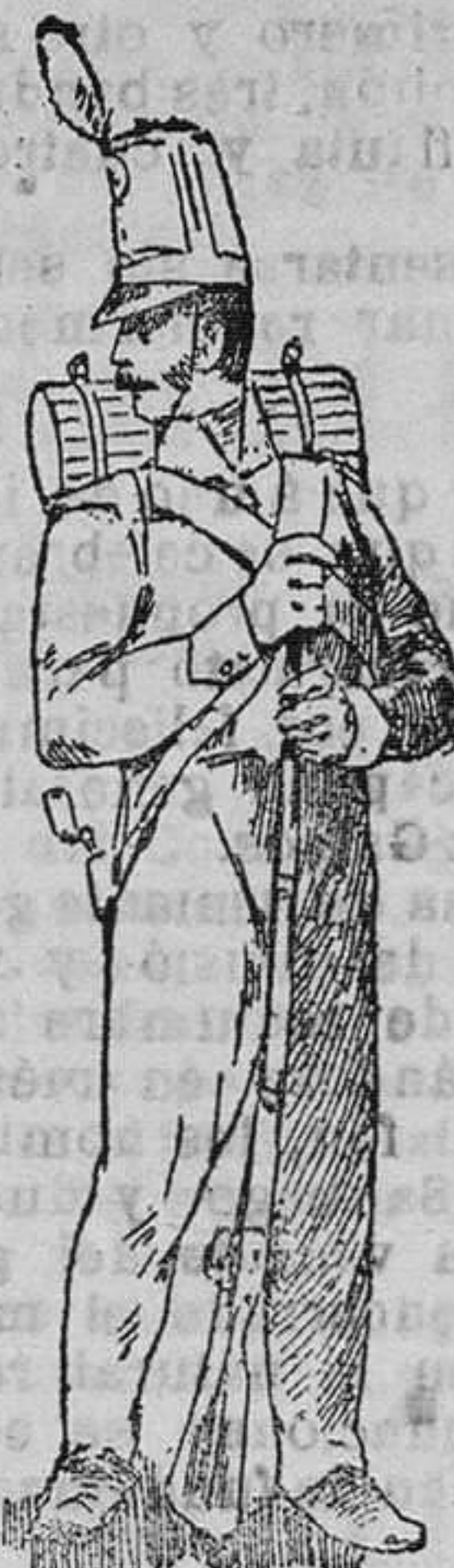
Fusilero de la guerra de la Independencia; 1812.

Carlos I, introdujo también importantes reformas, en nuestros ejércitos y él fué quien creó los tercios y divisiones terrestres, y su hijo Felipe II quien introdujo el mosquete ó mecha como arma de infantería.