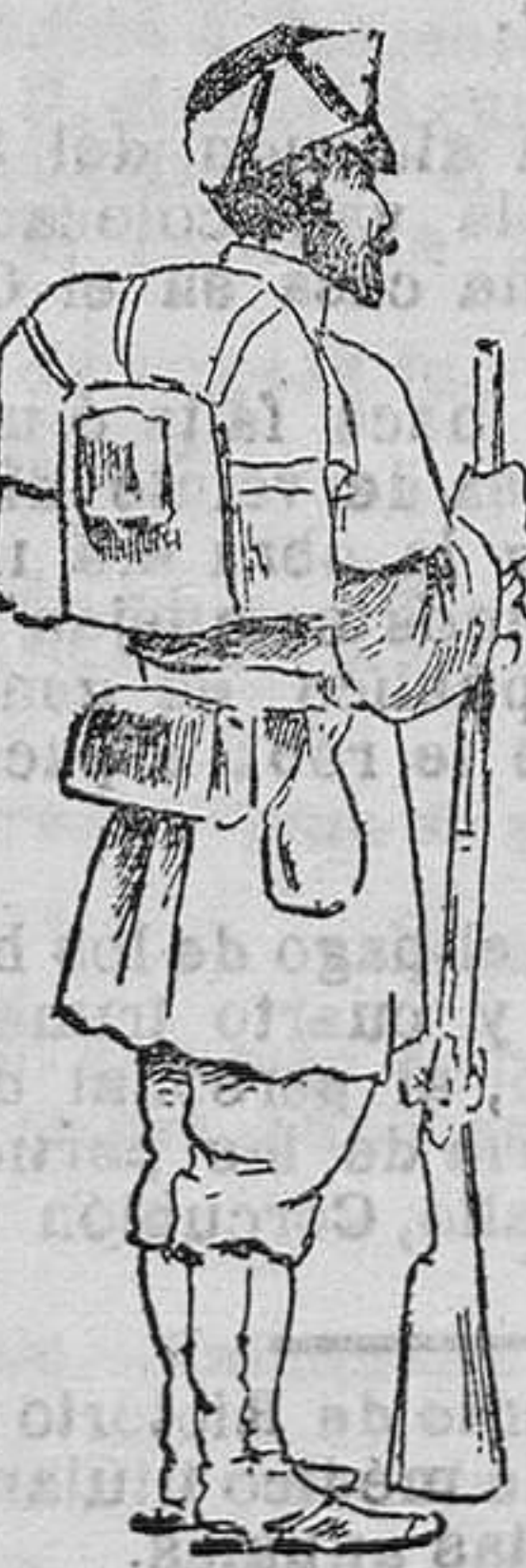
Cazador de la guerra de Africa

En 1703 se sustituyó el arcaucero, por el fusil, y desde 1701 a fines del siglo XVIII se mejoró notablemente el vestuario, correa y armamento, creándose las bandas de gastadores y tamboreros, y Carlos IV fué quien prohibió que los soldados se ensañaran el palo y que le cubrieran con polvos blancos.