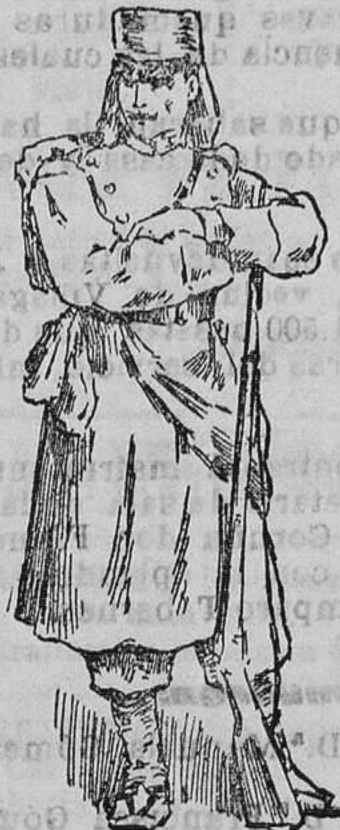
Soldado de la Infantería actual

consecuencia de que todo hombre útil y enemigo de Napoleón era soldado.