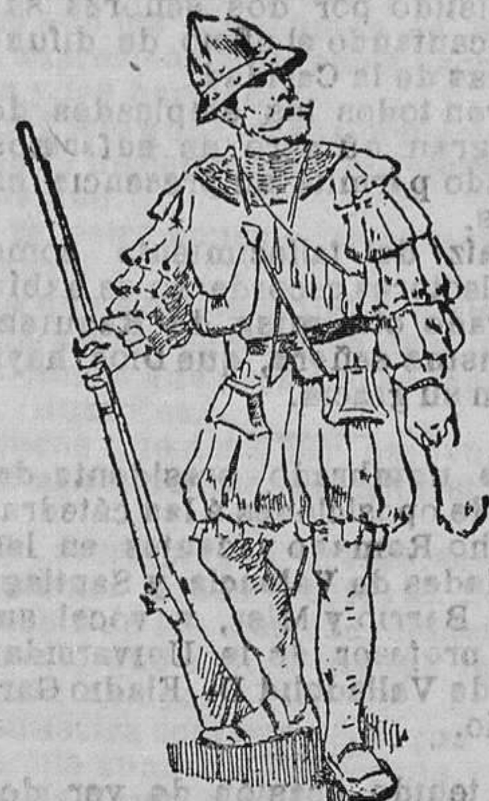
Arcaucero del siglo XVII

que montaba a la grupa de la caballería, se dividía en escuadras de 6.000 hombres, y su formación en línea de batalla era la de cuñas.