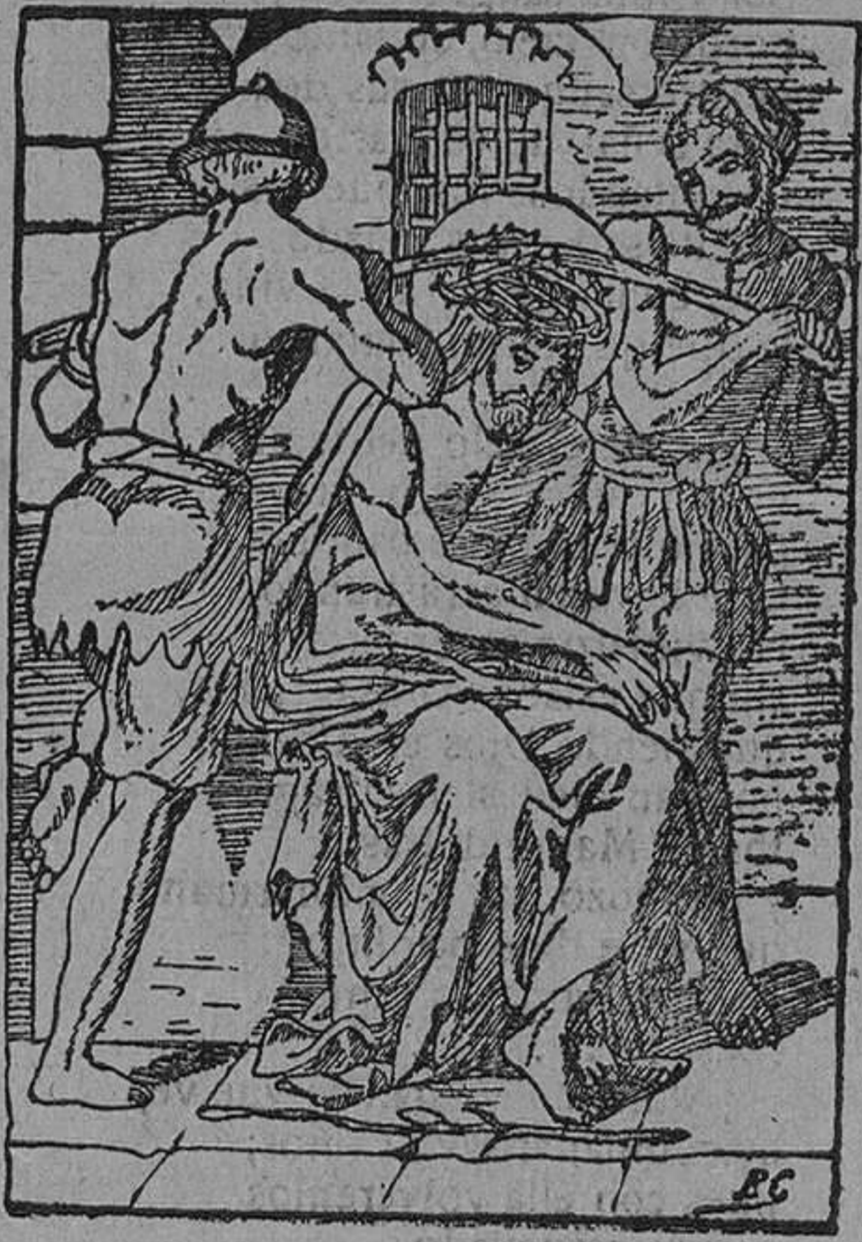
De un grabado de Alberto Durero