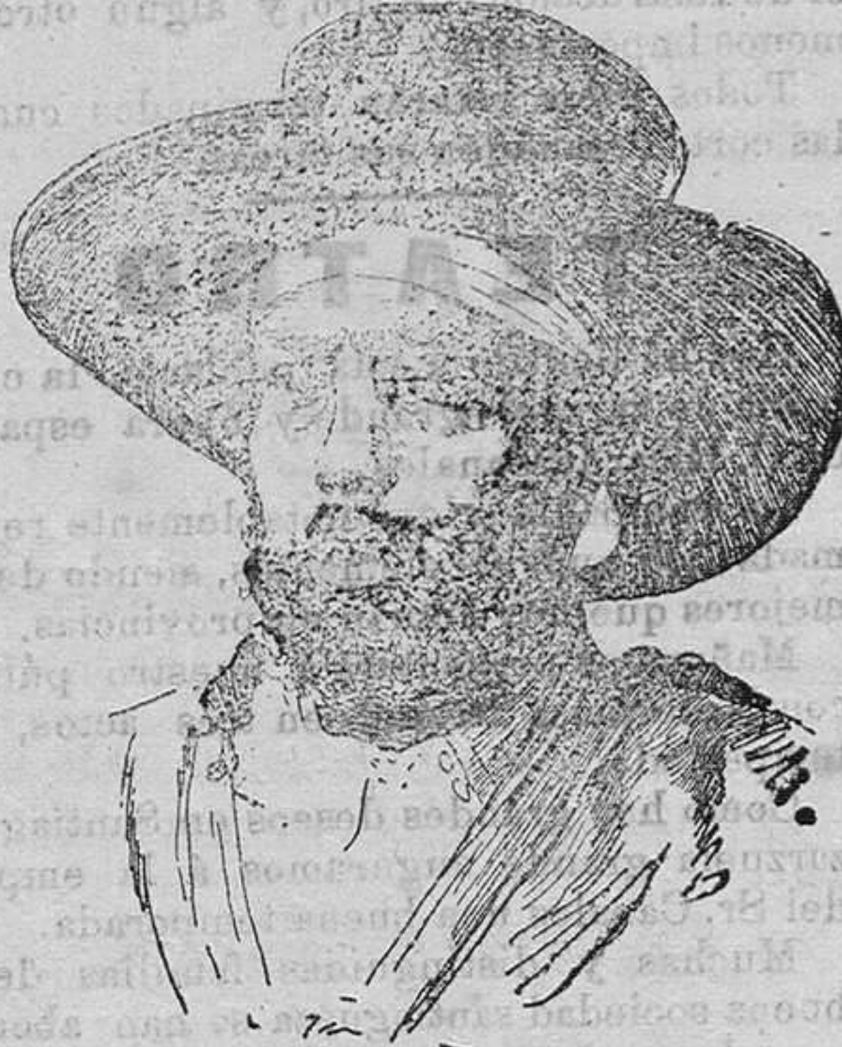
Menelik.—Negus, Emperador de Abisinia

Tan inesperado hecho ha producido honda emoción en los círculos políticos de toda Italia, por existir la duda de si la invasión