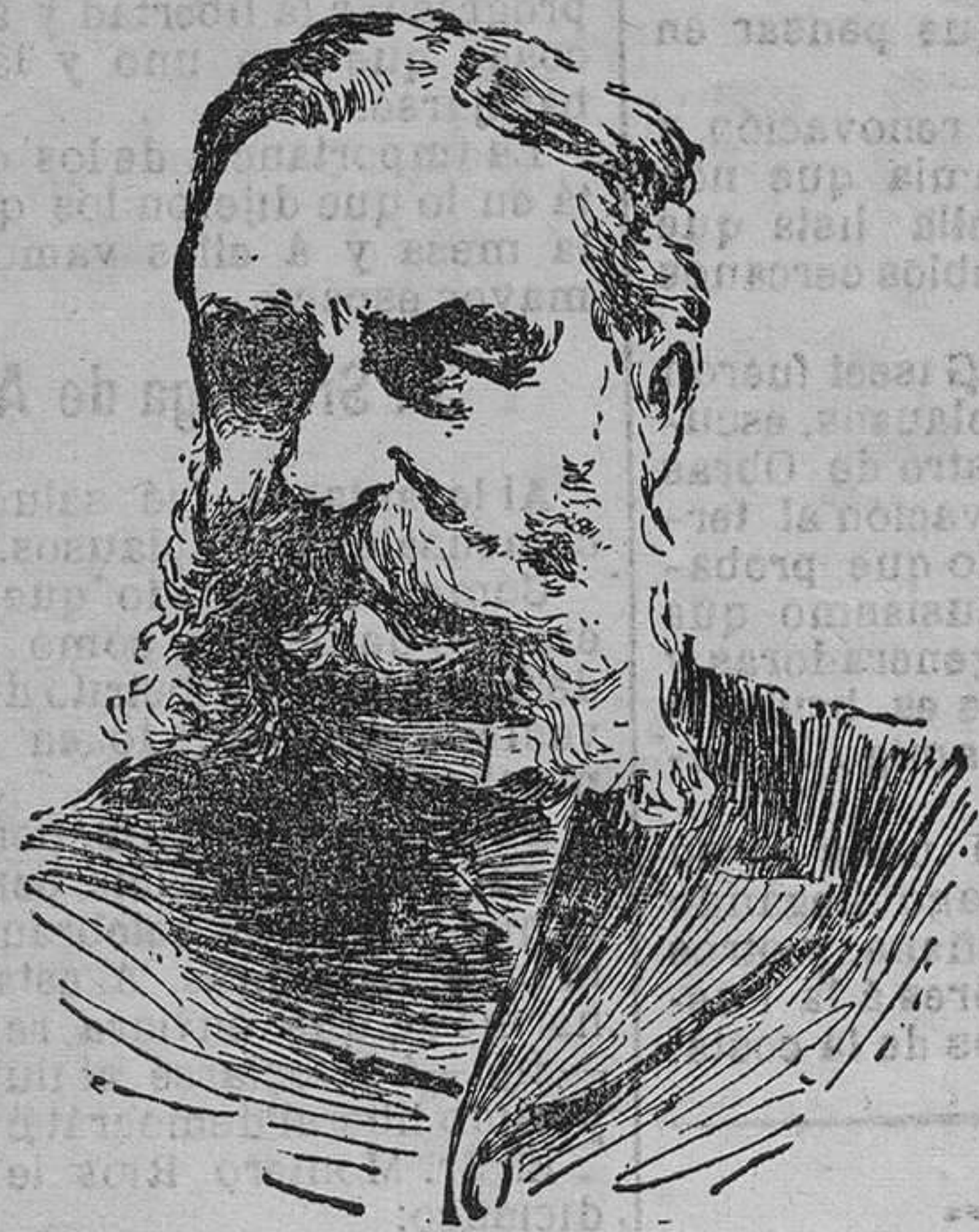
EL MARQUÉS DE LA VEGA DE ARMIJO