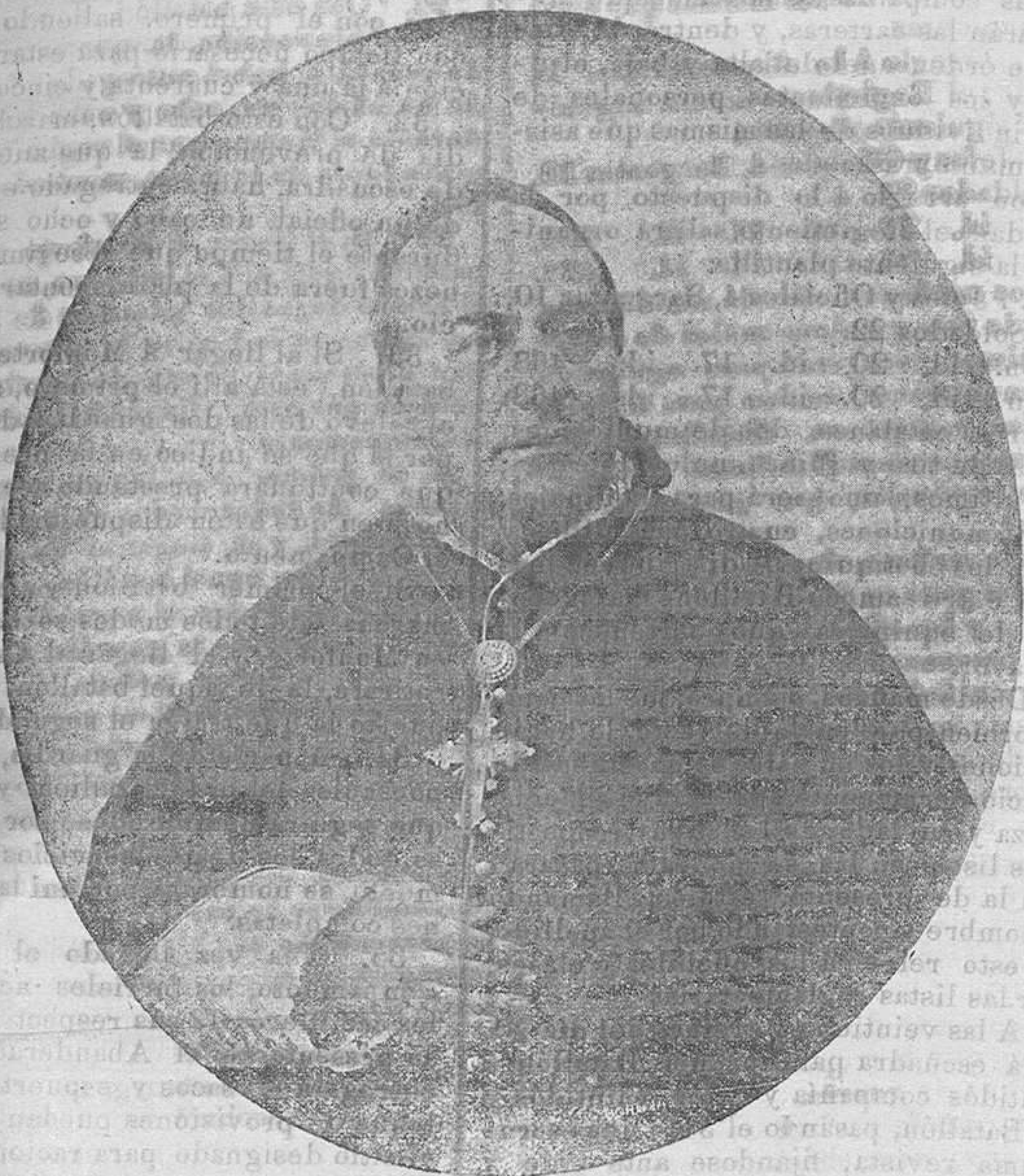
EMMO. Y REVMO. SR. CARDENAL ARZOBISPO CONSAGRANTE

Una desgracia de familia impidió que el Sr. Cardenal Arzobispo acudiese al