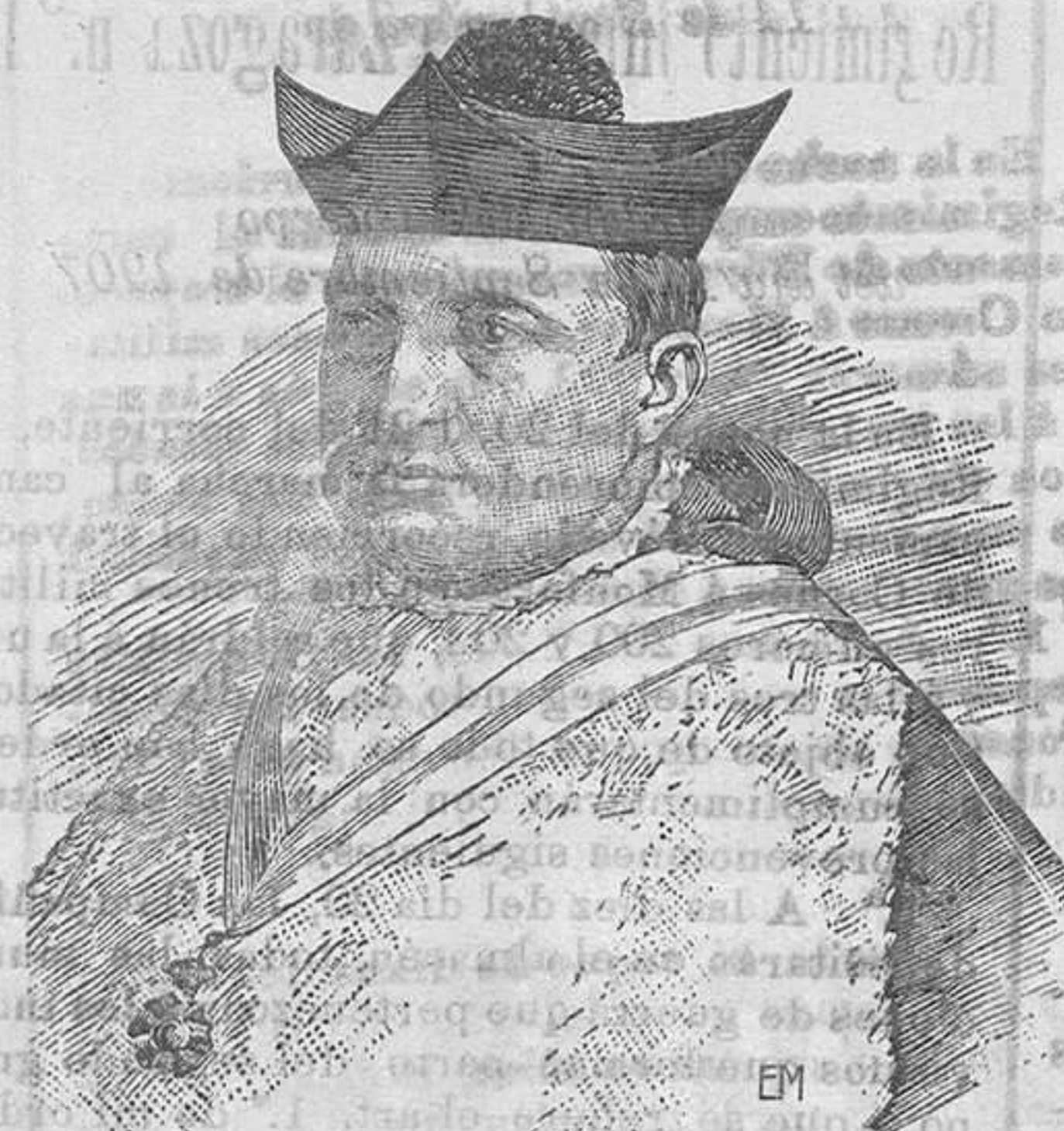
ILMO. SR. OBISPO DE PALENCIA CONSAGRADO