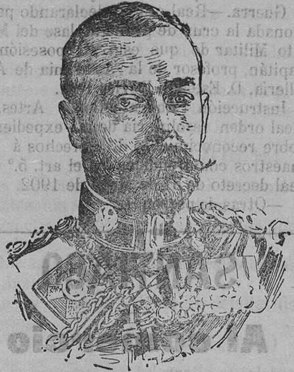
Príncipe de Gales