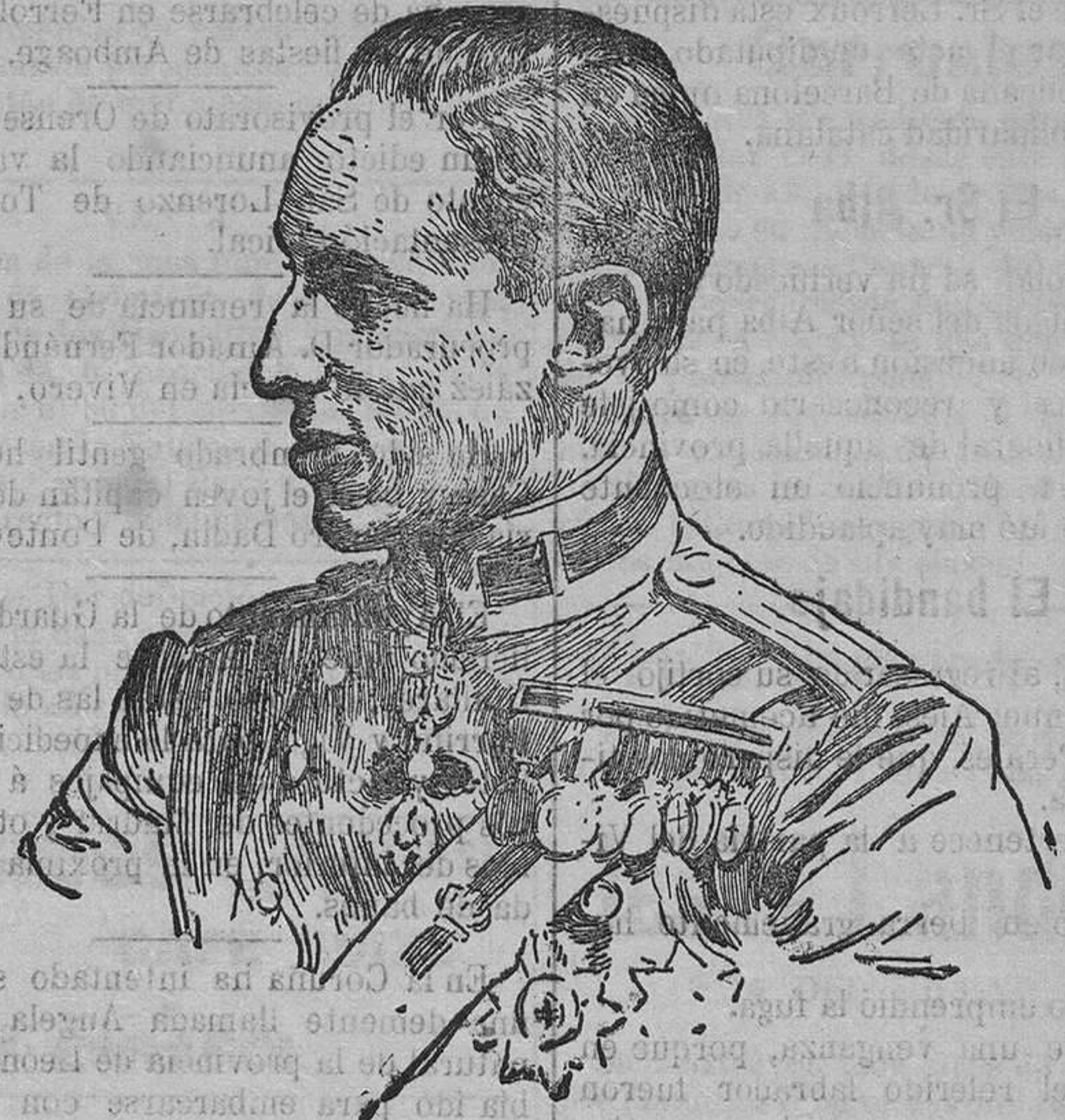
Alfonso XIII, Rey de España

Se pensó poco después en que sirviera de Catedral de Madrid, erigida ya en diócesis por el concordato de 1851; fué este un pensamiento del Rey consorte D. Francisco de Asís.