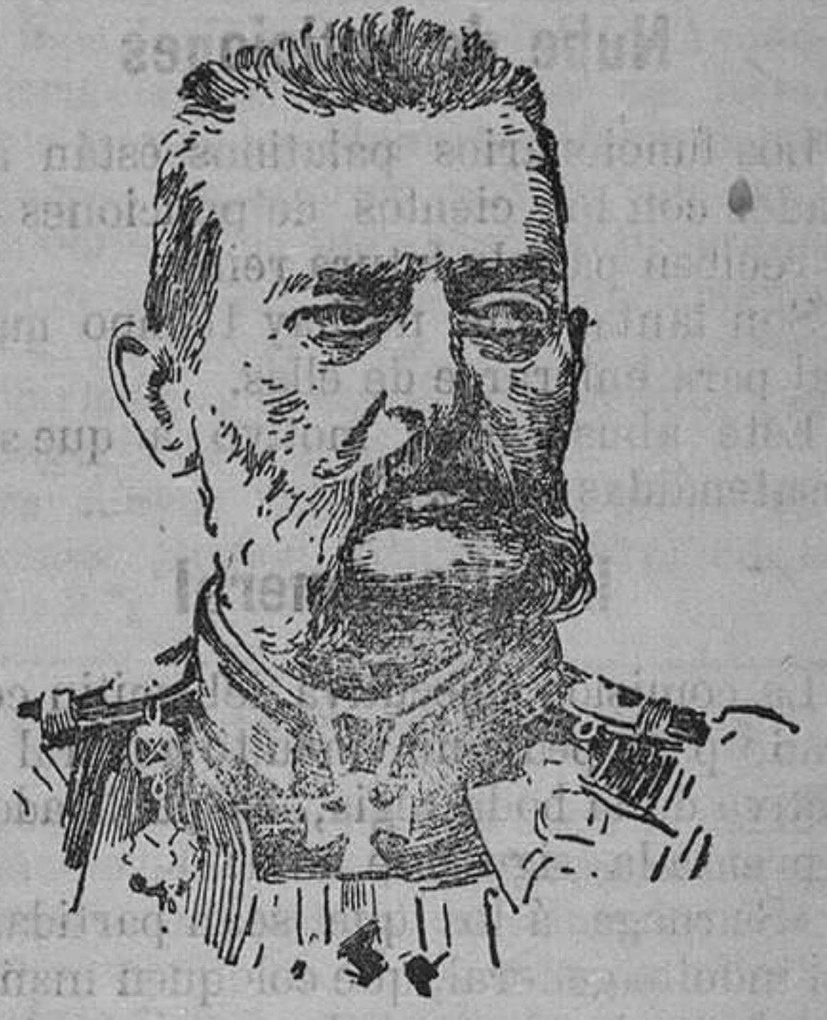
Gran Duque Wladimiro