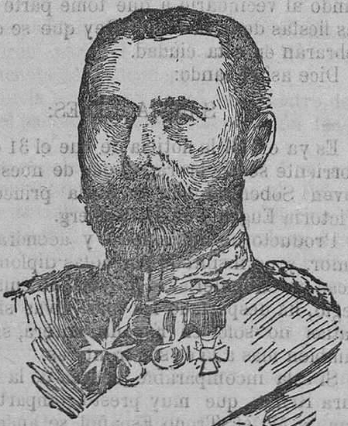
PRÍNCIPE ENRIQUE DE BATTENBERG

A través de sus cristales se divisa el bien ordenado comedor. Todas las mesitas, admirablemente preparadas, lucen fragantes flores.