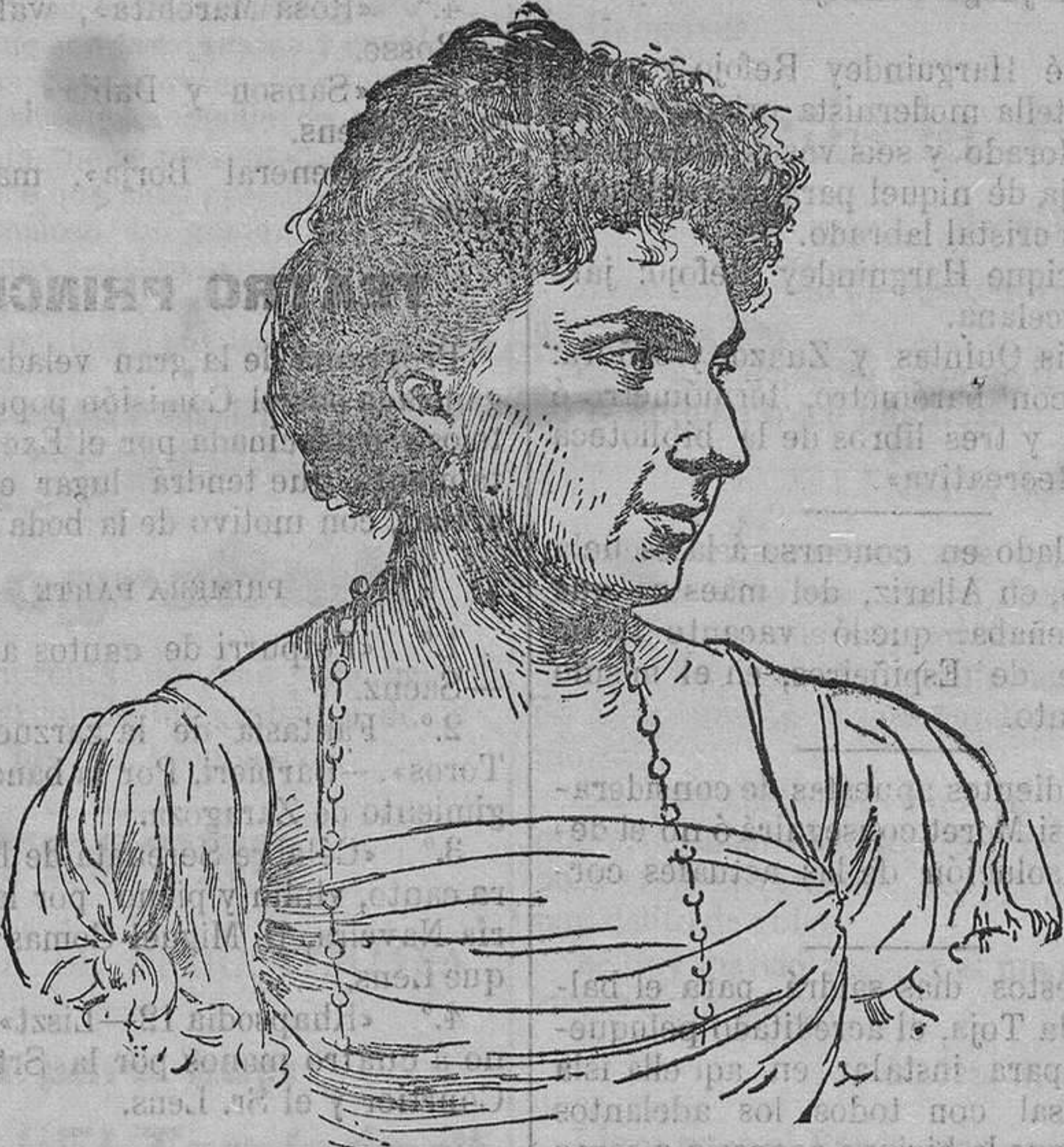
Princesa Victoria de Battenberg

No lejos se ve a los Príncipes de Gales. Les acompañan su numeroso séquito y distinguidas personalidades de la embajada y de la colonia inglesa.