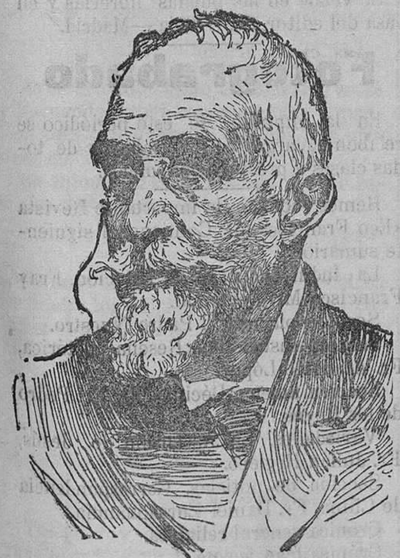
D. Gumersindo de Azcárate

Llega el Sr. Osma á la Academia en los momentos en que la opinión pública discute con calor las reformas arancelarias. El tema de su disertación parece oportuno, y no dejará de contribuir á que pueda hallarse una fórmula de concordia entre las opuestas teorías que se relacionan con la renta de Aduanas. Todas las trazas notadas en el «Análisis del concepto de la protección arancelaria» revelan, á juicio del Sr. Azcárate, que el discurso del recipiendario ha sido pensado y escrito para defender el régimen proteccionista, no sólo de los ataques del libre cambio, sino también de los sofismas, de las alegrías y de las facilidades comprometedoras que manifiestan y ofrecen los apasionados del proteccionismo.