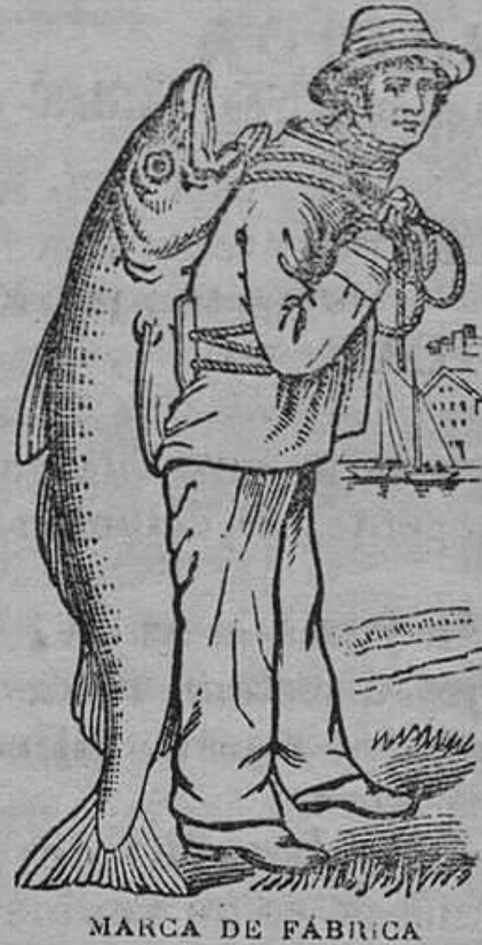
MARCA DE FABRICA