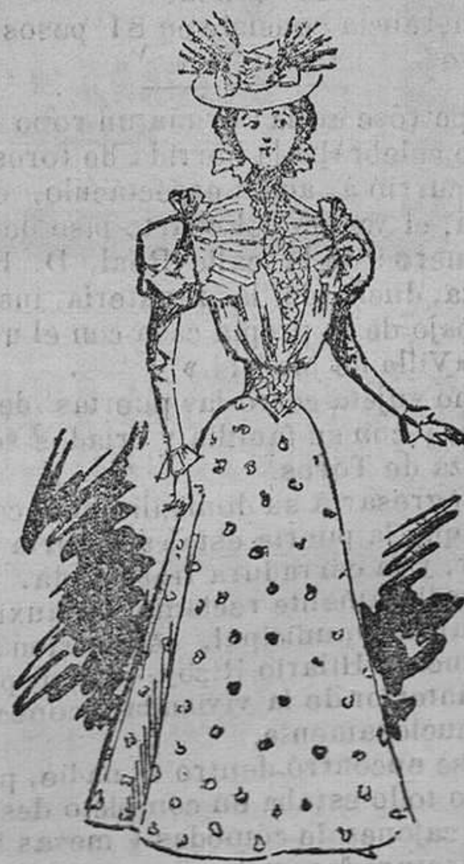
Traje para campo

Modelos exclusivos para nuestras lectoras de los Grandes Almacenes de EL SIGLO, Barcelona