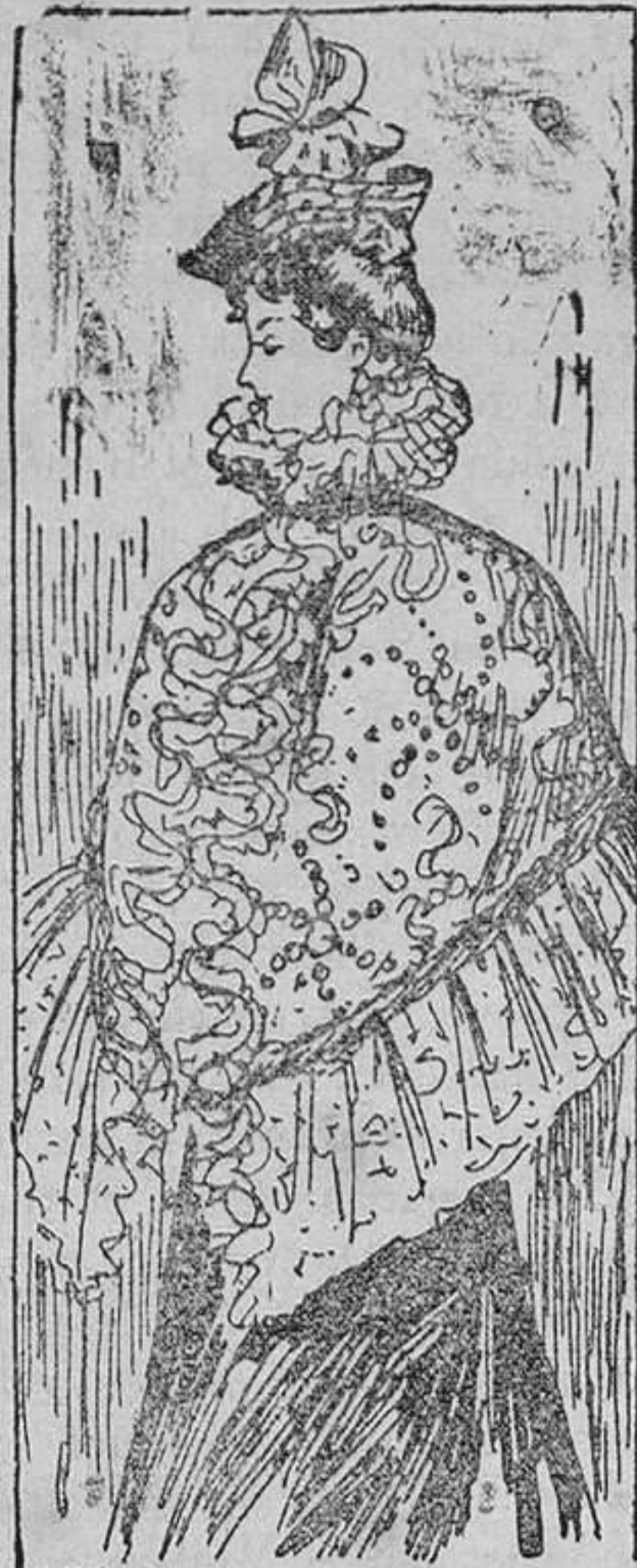
Esclavina para señorita

La elegante esclavina que nuestro dibujo representa se confecciona con pañete. Su principal mérito consiste en el precioso bordado que cubre la tela y en el ancho volante que rodea el borde. Lleva, además, en el delantero una bonita chorrera de encaje que parte de un cuello cerrado cubierto por una golilla de encaje.