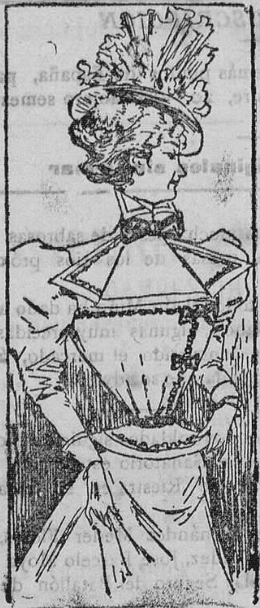
Traje para paseo.

Modelos exclusivos para nuestras lectoras de los grandes almacenes de EL SIGLO Barcelona.