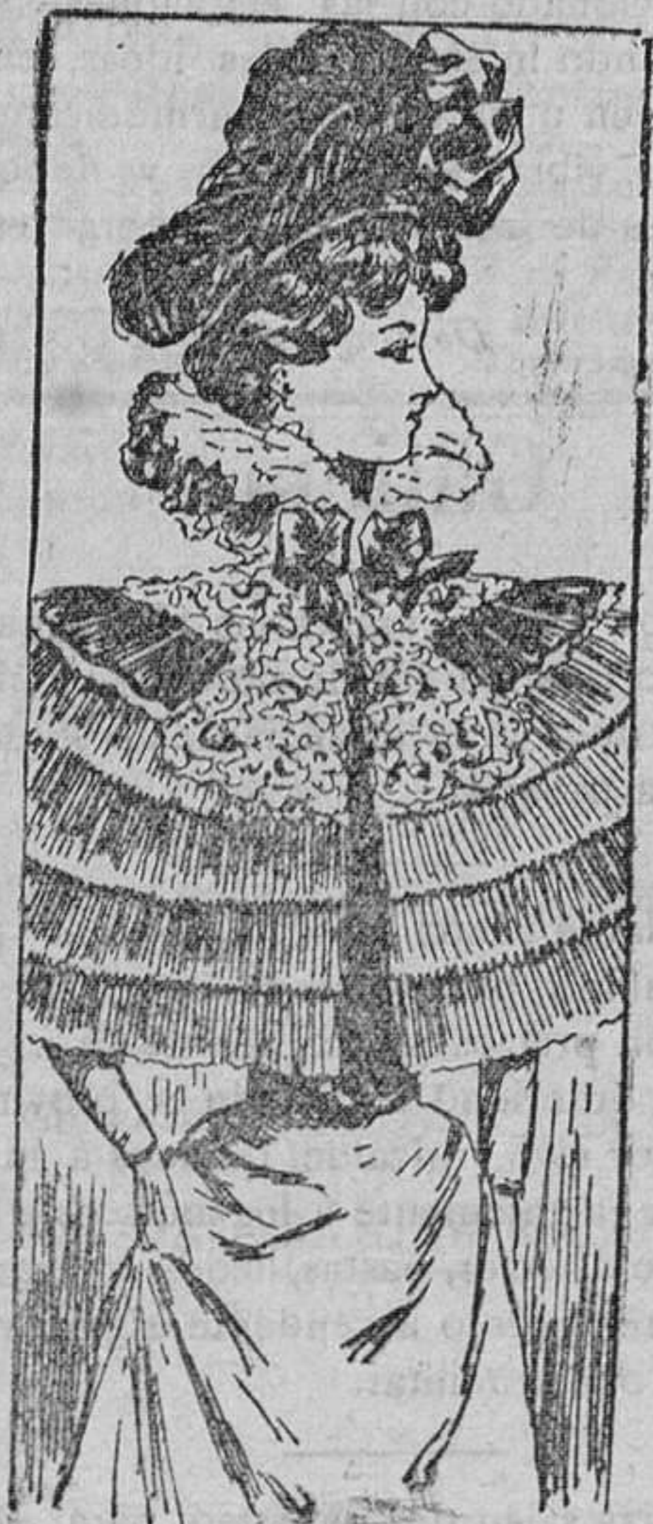
Manteleta para entretiempos

Modelos exclusivos para nuestras lectoras de los grandes almacenes de EL SIGLO Barcelona.