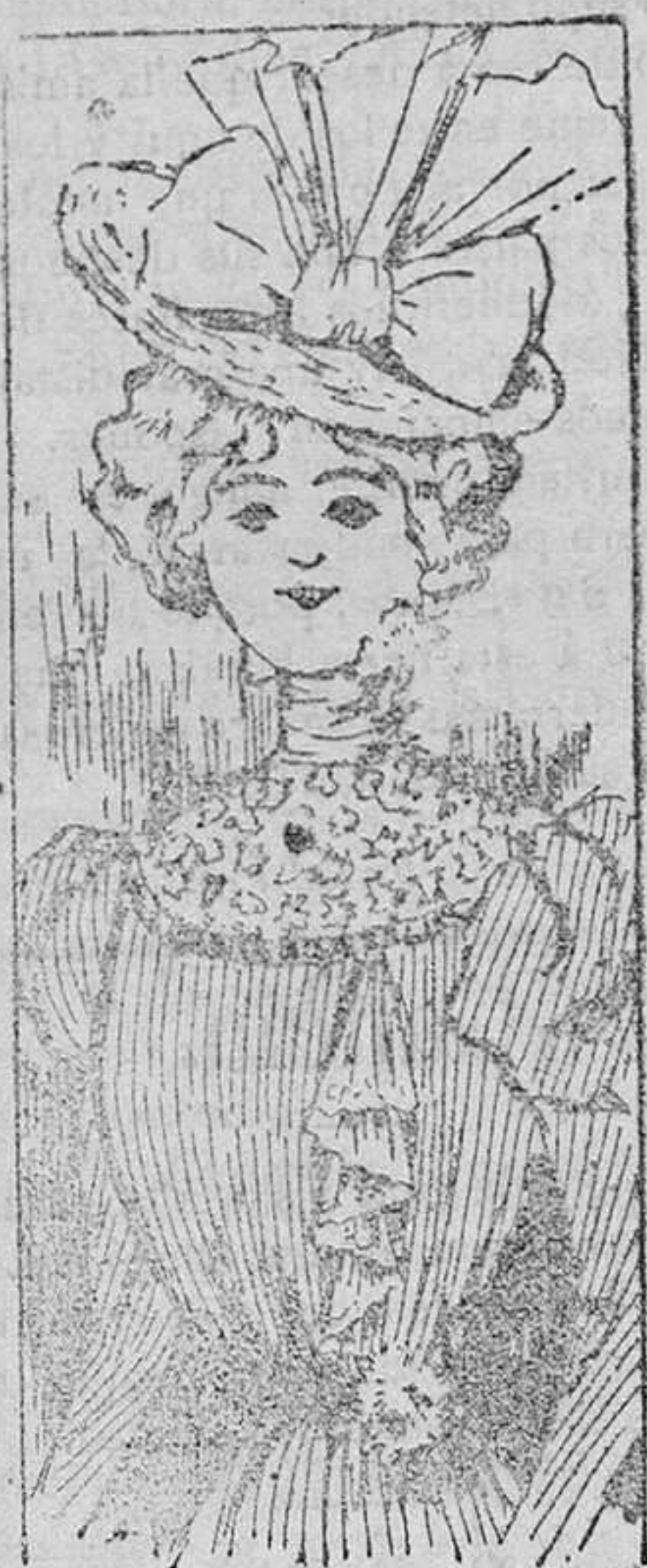
Blusa para paseo.

Modelos exclusivos para nuestras lectoras de los grandes almacenes de EL SIGLO Barcelona.