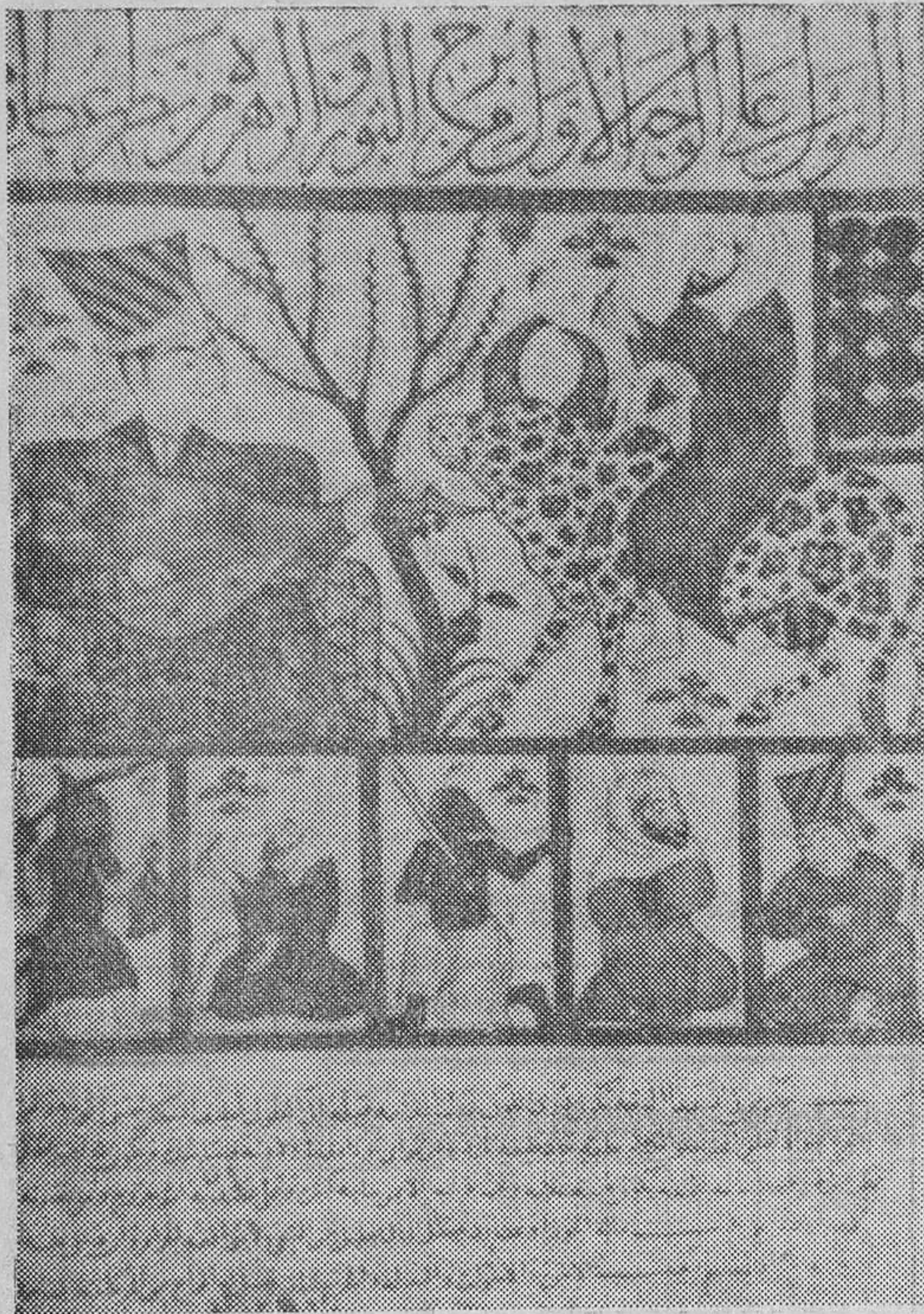
Miniatura árabe «Motivos musicales iluminados»