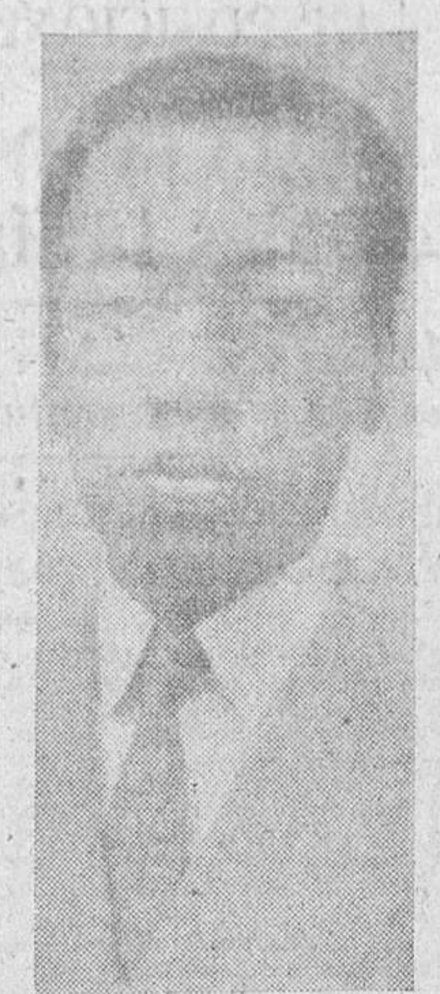
El famoso torero negro RAFAEL SANTA CRUZ

La «Maravilla negra», como llaman en América al diestro Santa Cruz, hará su presentación en España, en esta corrida