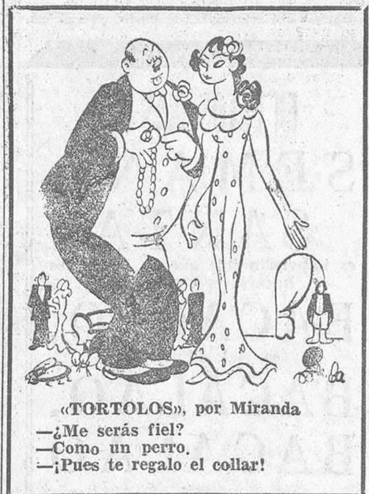
«TORTOLOS», por Miranda —¿Me serás fiel? —Como un perro. —¡Pues te regalo el collar!

Mostró su disgusto por la lesión de Riera que le impedirá jugar en Lisboa.—(Alfí)