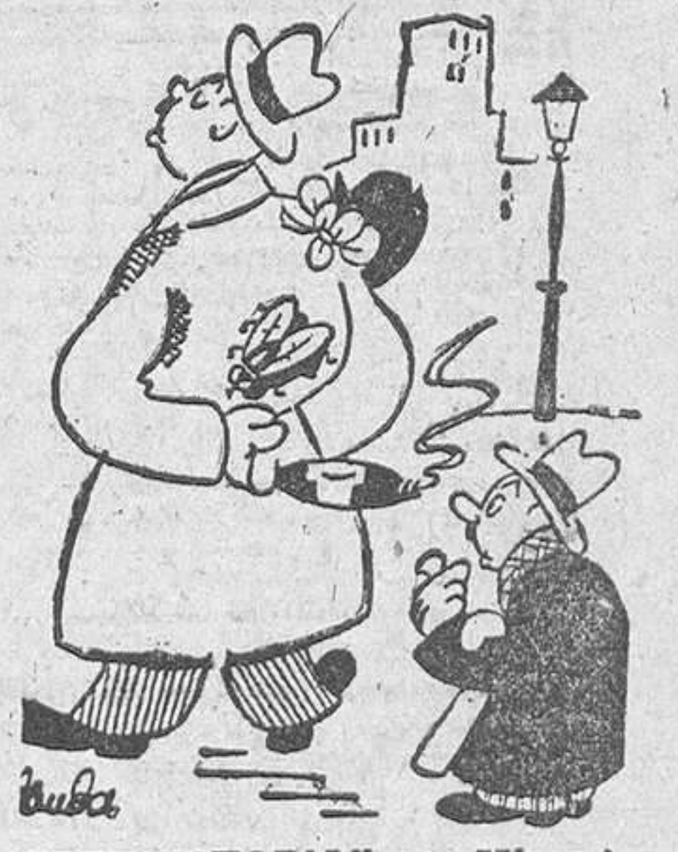
"PREHISTORIA" por Miranda —¿Un puro habano...? ¡Este tío es un arqueólogo!

Este número de LA PRENSA ha sido confeccionado en nuestro querido colega "Patria", a quien agradecemos sus facilidades, así como a todo su personal de talleres.