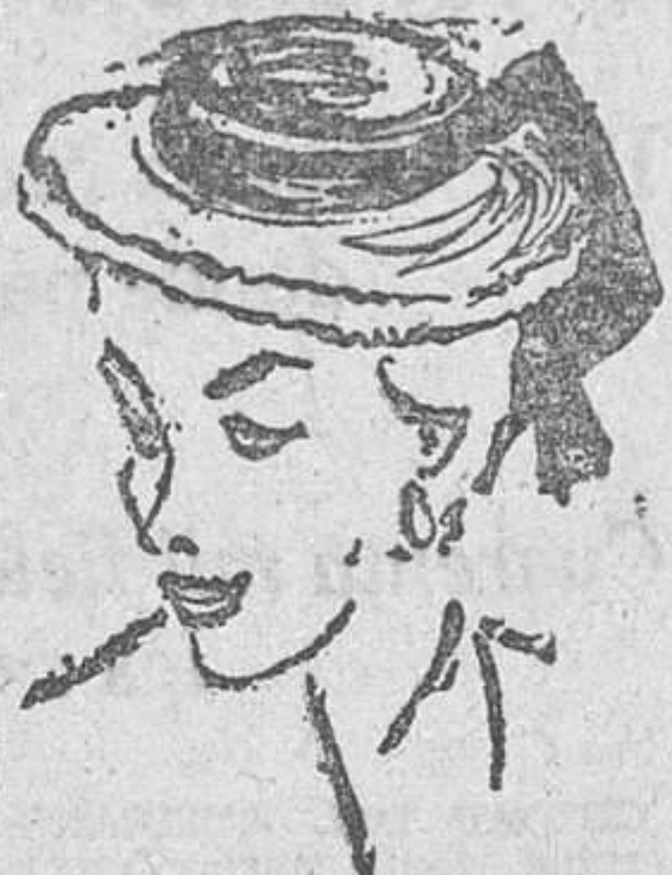
Canotier en paja de Italia natural con larga cinta de piqué blanco.