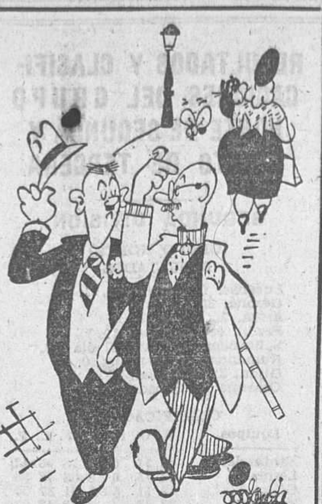
AGLARATORIA, por Miranda —El hombre que no se quita el sombrero para las damas no tiene delicadeza. —¡O no tiene sombrero!

BOMBAY, 19.—Una gran multitud ha presenciado esta mañana el final de la prueba realizada por el «Yogui» Swami Ramdas, de 45 años de edad, que ha permanecido 87 horas sobre un lecho de clavos, encerrado en una caja herméticamente ajustada en sus bordes, sumergida en agua y en completo estado de ayuno desde unas horas antes de ser «enterrado». Al ser extraído de la caja el médico que le asistió dijo que la respiración y el pulso eran muy débiles, pero normales para una persona que ha ayunado durante más de ochenta horas. Este es el sexto «enterramiento» que realiza el «Yogui» Swami.—(EFE).