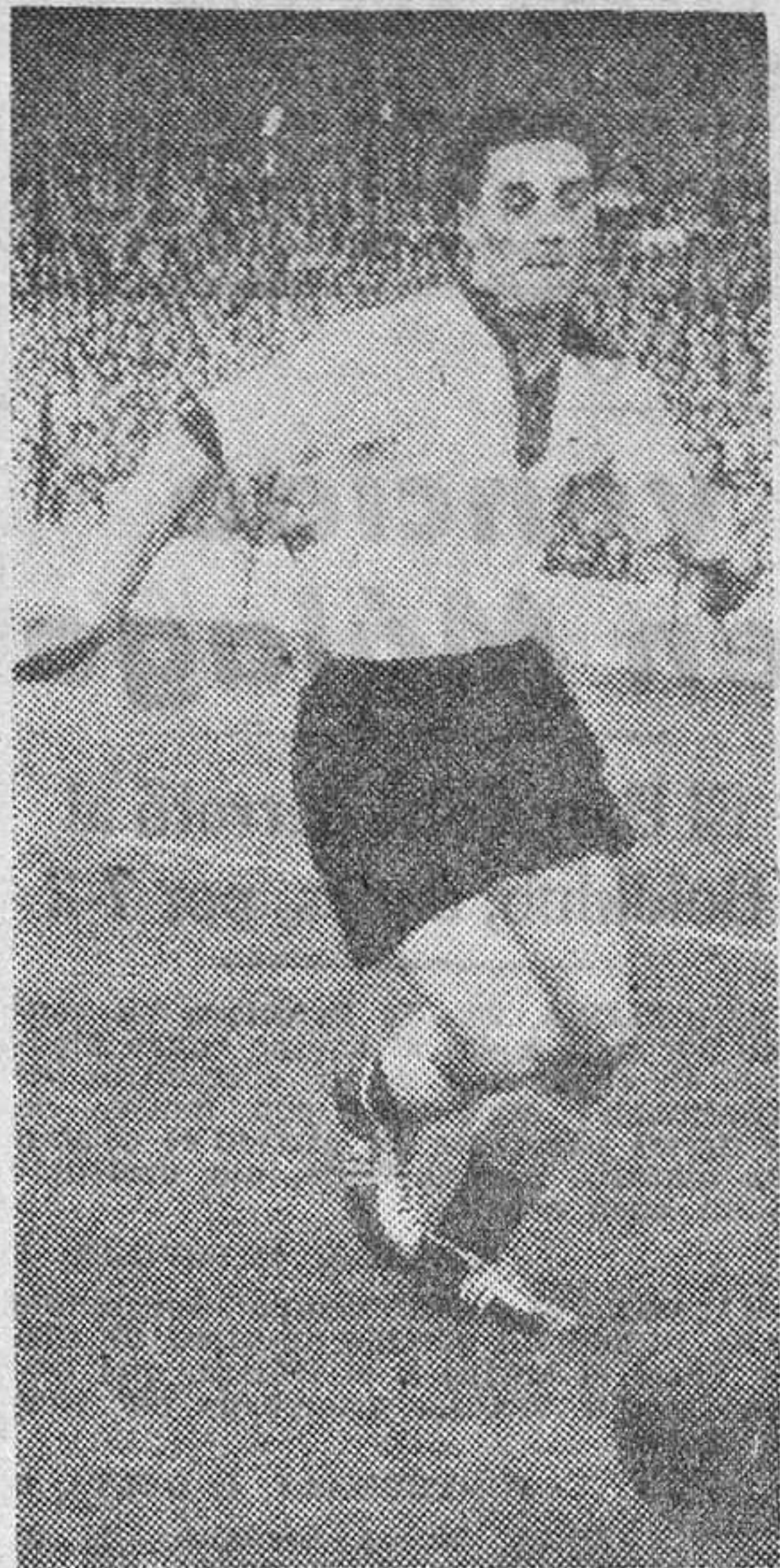
Ottmar Walter delantero centro de la selección alemana de fútbol, que resultó lesionado en el partido de ayer, en un violento choque con el defensa español, Navarro.

Alfombras alpujarreñas. Tapetes. Cortinajes. Cojines. Tela para camas-turcas y mesas de camilla