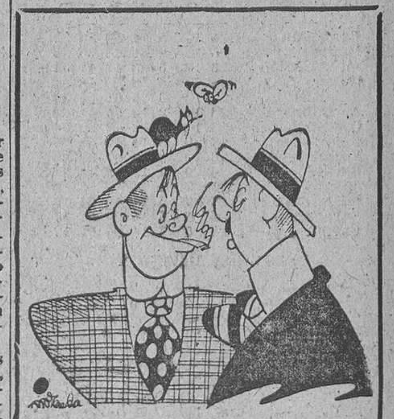
NOTA, por Miranda

«El público desbordó el Teatro Cómico hasta casi la Gran Vía. ¡Que lleno, qué expectación y qué aplausos en cuanto apareció en escena Juanito Valderrama! Las ovaciones se sucedieron retumbantes toda la noche y el telón se alzó multitud de