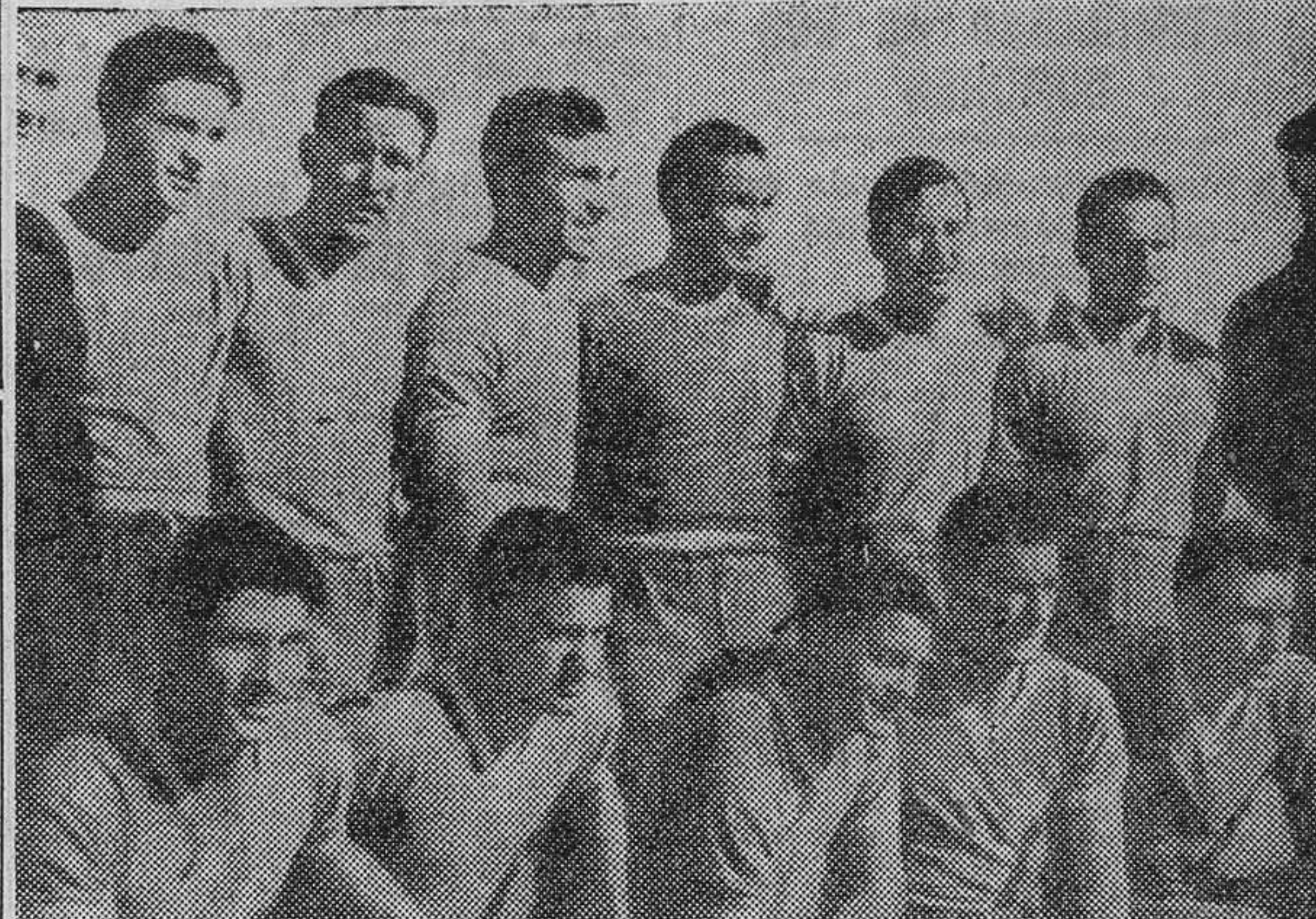
El equipo de la seleccion argentina de fútbol que se ha alineado frente a España, en un memorable encuentro en que la suerte se inclinó por los riollos para darles una difícil victoria por un gol a cero, logrado siete minutos antes del final.

LA COLONIA ESPAÑOLA NO CESO DE ALENTAR A NUESTROS JUGADORES