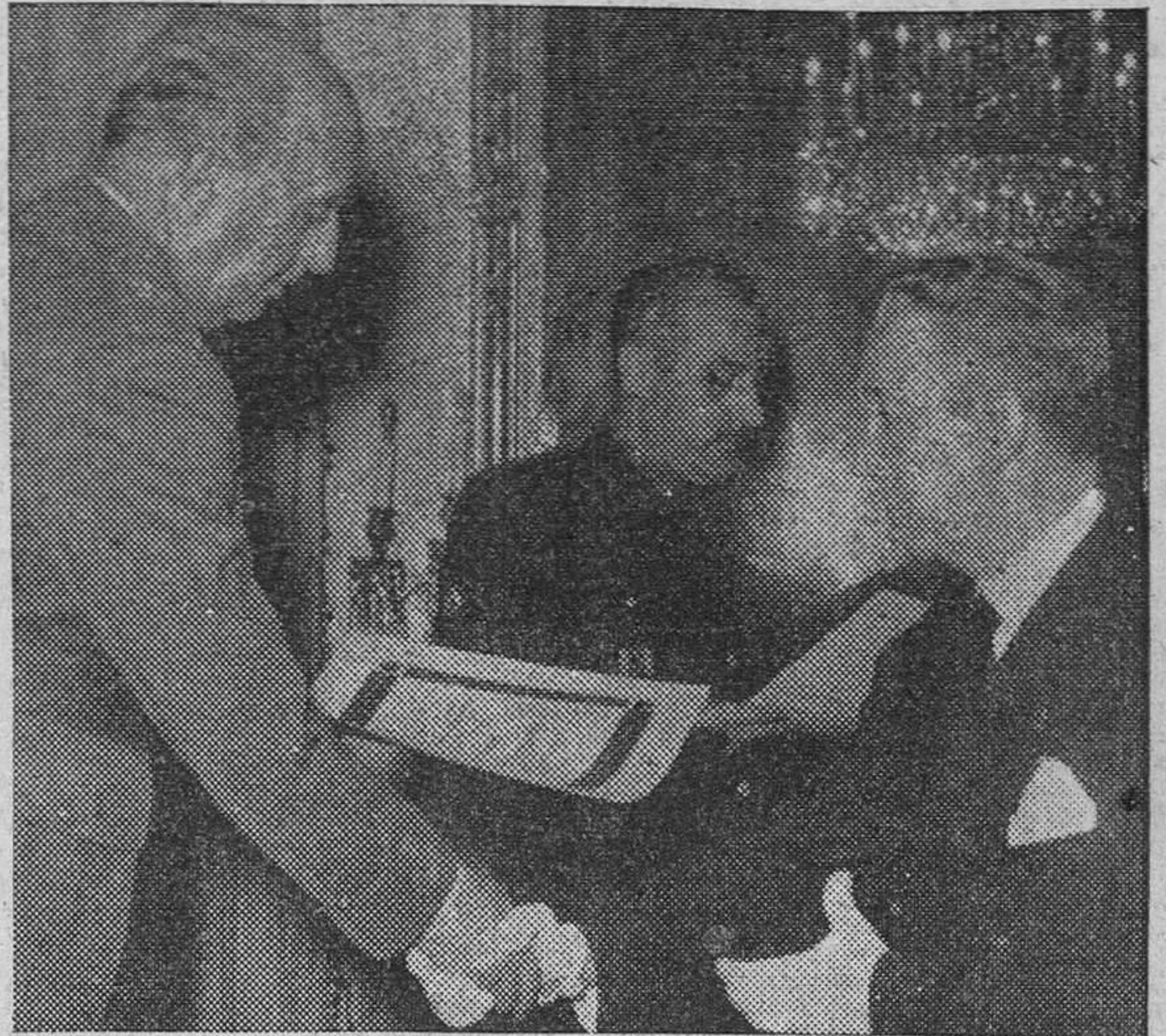
MADRID.—S. E. el Jefe del Estado, durante la entrega de trofeos a los Campeones del X Concurso Nacional de Formación Profesional Obrera, que le fueron presentados por el ministro secretario general del Movimiento. Asistieron a dicho acto los ministros de Trabajo e Industria.