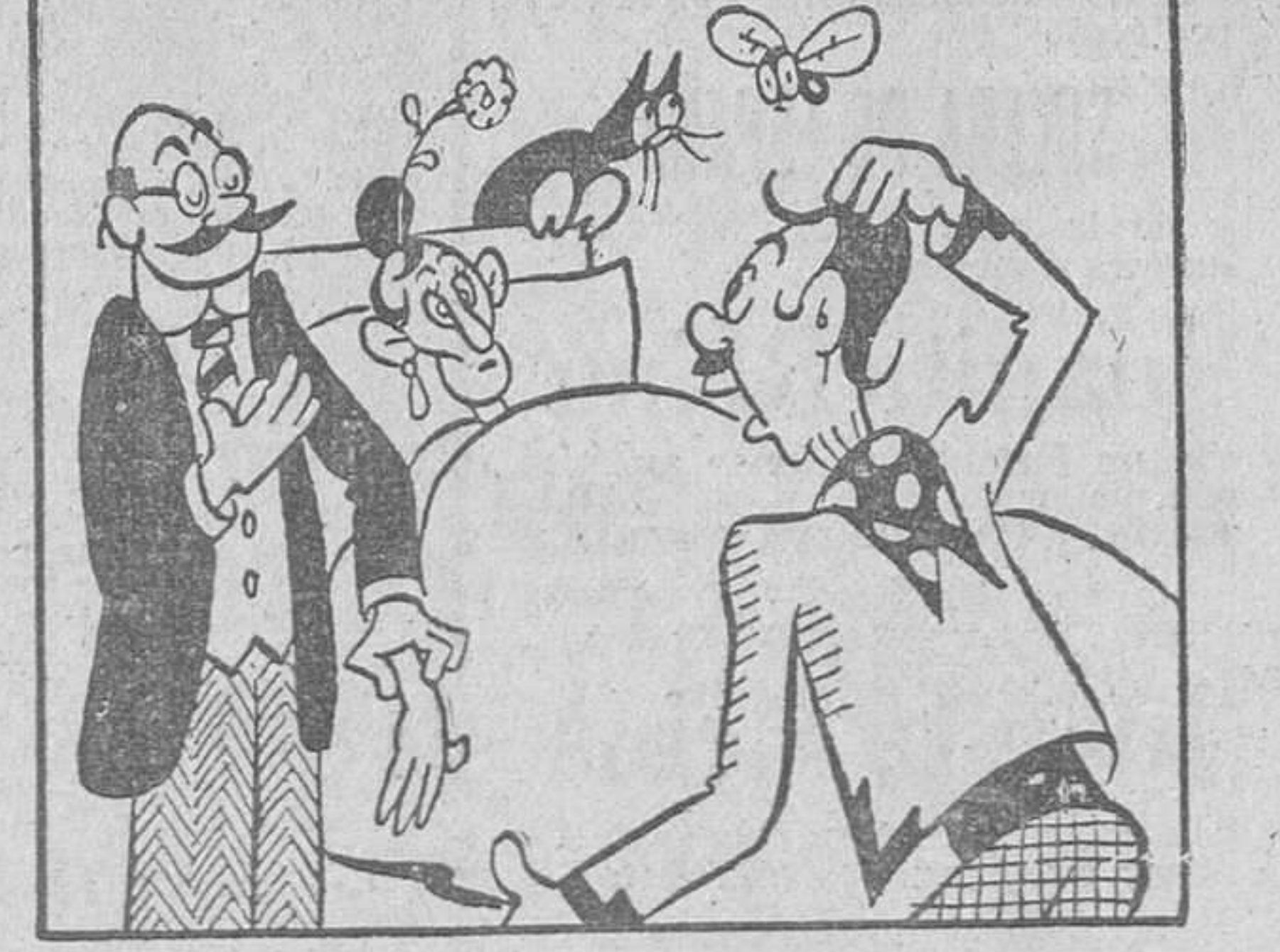
ENFERMITA --¡La encuentro muy débil! ¡Falta de energía! --¡Falta de energía! ¡Ay, mi mare! ¡A que mi B'asa se ha convertido en la Mengemor!