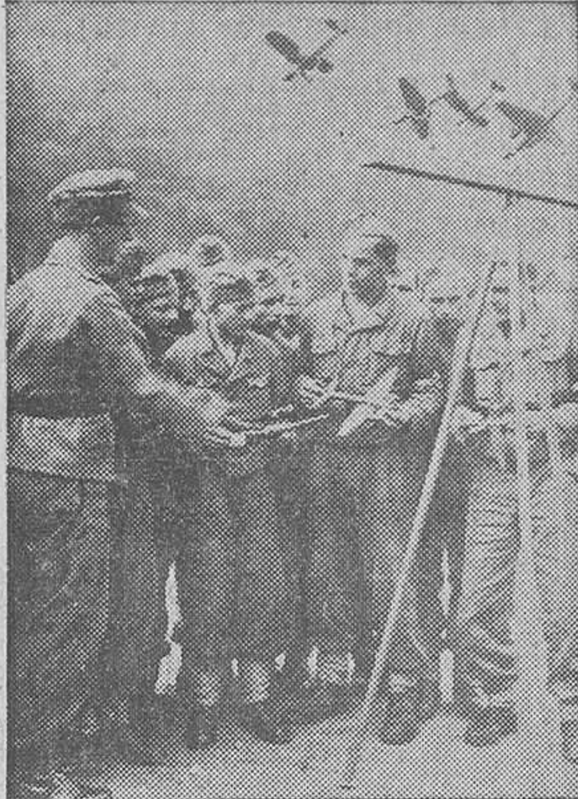
Muchachos de la juventud hitleriana estudiando sobre maquetas los aparatos de servicio en el ejército alemán, que después han de tripular.