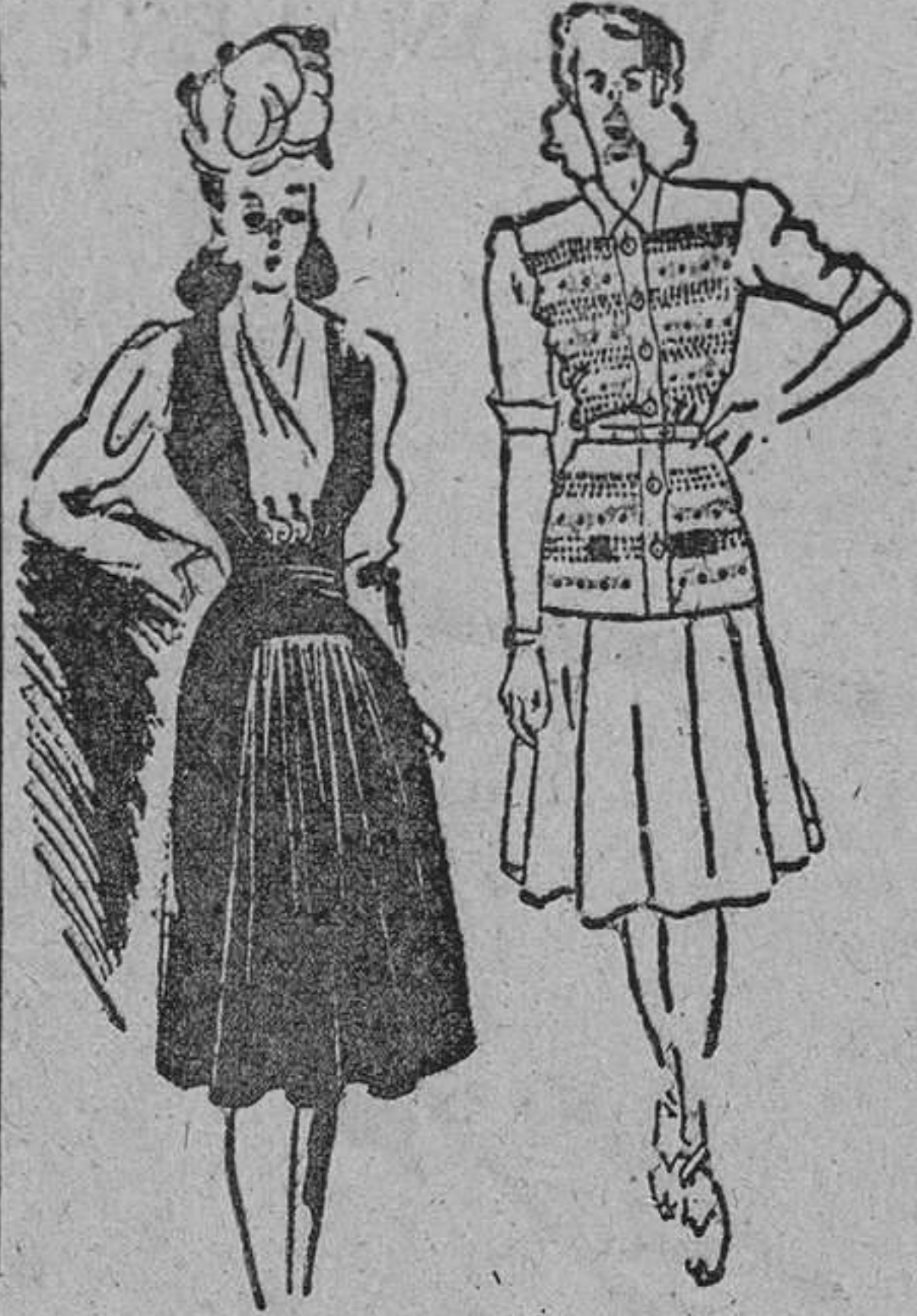
Vestido de tarde, de crepón negro, con cuerpo de crepón blanco, bordado en negro.

se le haya ocurrido nunca recordar a esta excelente muchacha aquel famoso refrán que dice: «Más vale pájaro en mano que cien volando». Los hombres admiran a Esmeralda porque está siempre bien vestida y es una camarada alegre y llena de gracia. Posee también muy buenas y serias cualidades, pero apenas las deja notar en el torbellino de su chispeante charla. Y, pensando bien, no cabe duda de que cualquiera de nosotras, las que brillamos mucho menos, está siguiendo un camino que conduce más directamente a un feliz porvenir.—MARBUCHI.