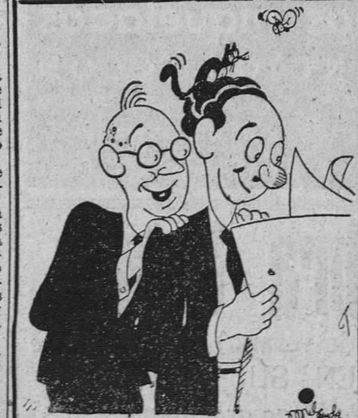
TRABAJO, por Miranda