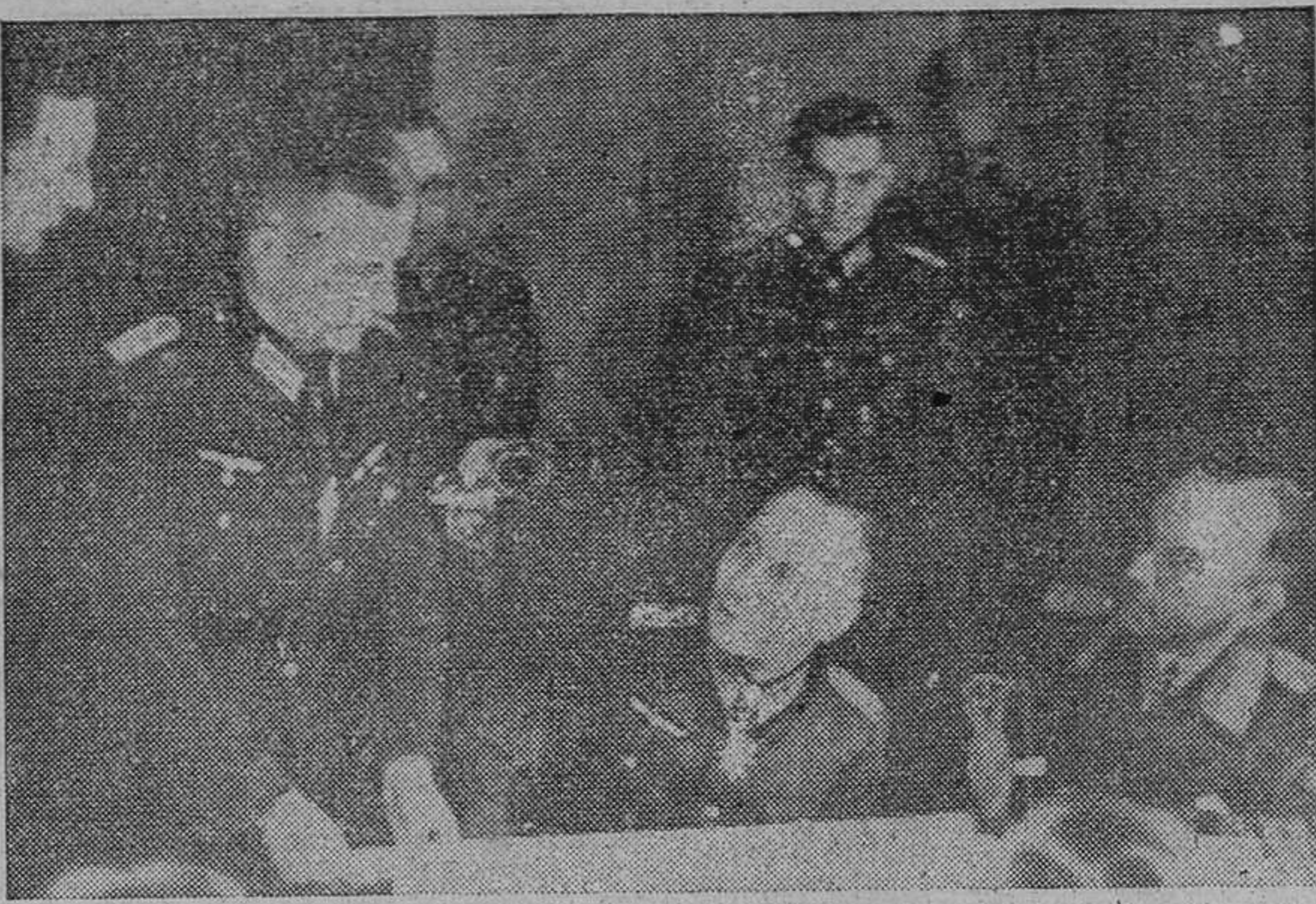
El mariscal Rommel visita las guarniciones de defensa establecidas en la costa francesa del canal de la Mancha.