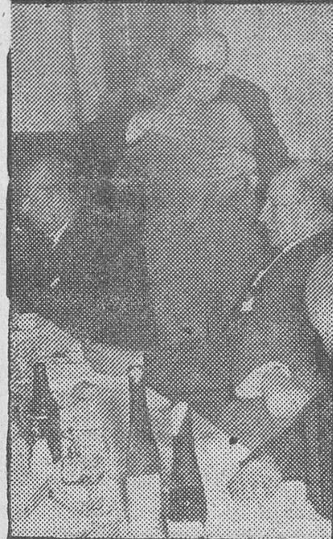
El Sr. De la Fuente abraza al secretario de la Diputación durante el agasajo