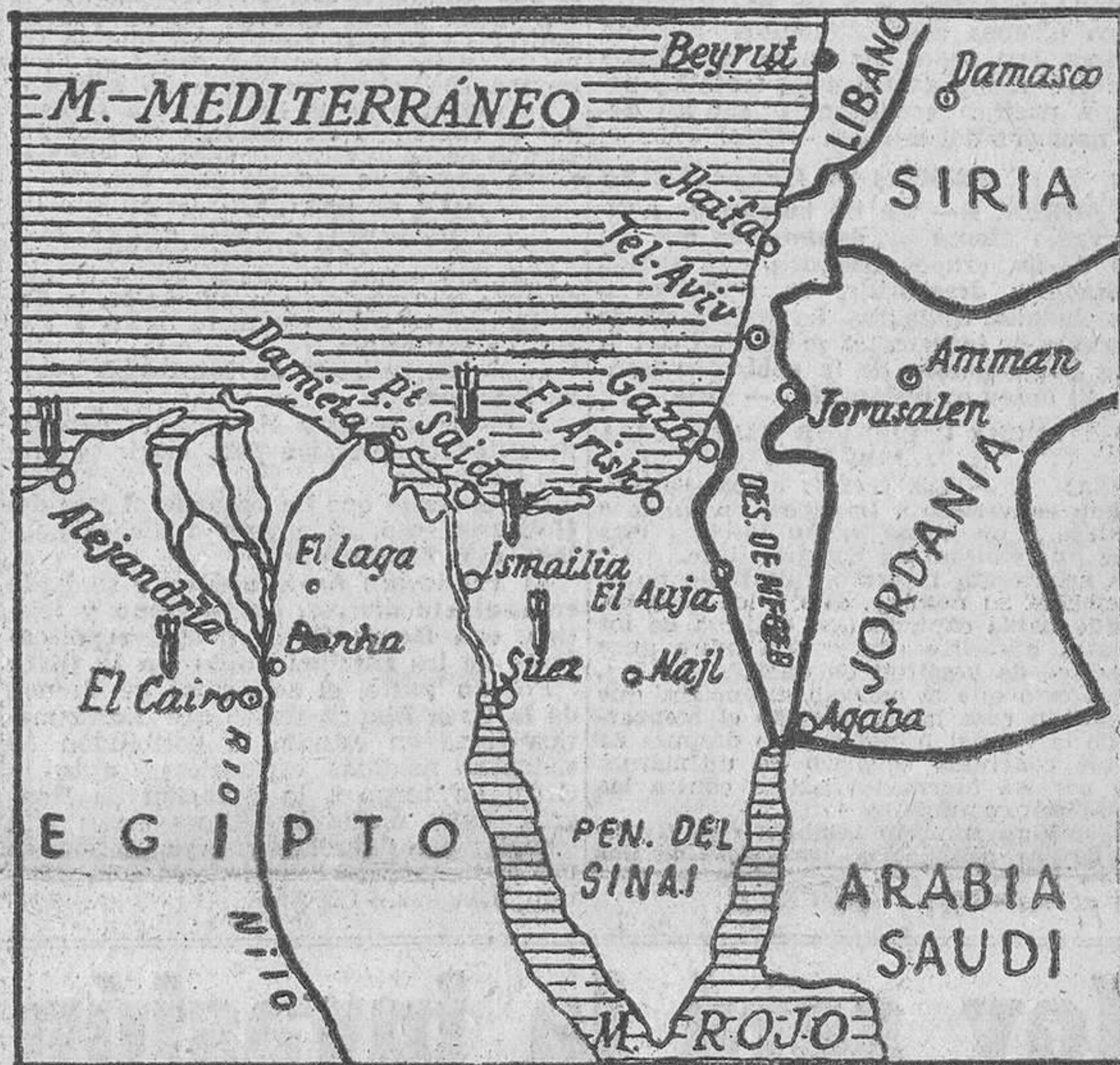
Egipto y la zona del Canal de Suez, en donde se desarrollan las luchas con las fuerzas de Israel y la intervención de las tropas de Inglaterra y Francia.

(Crónicas especiales y amplia información deportiva, en las páginas 5, 6, 7 y 8)