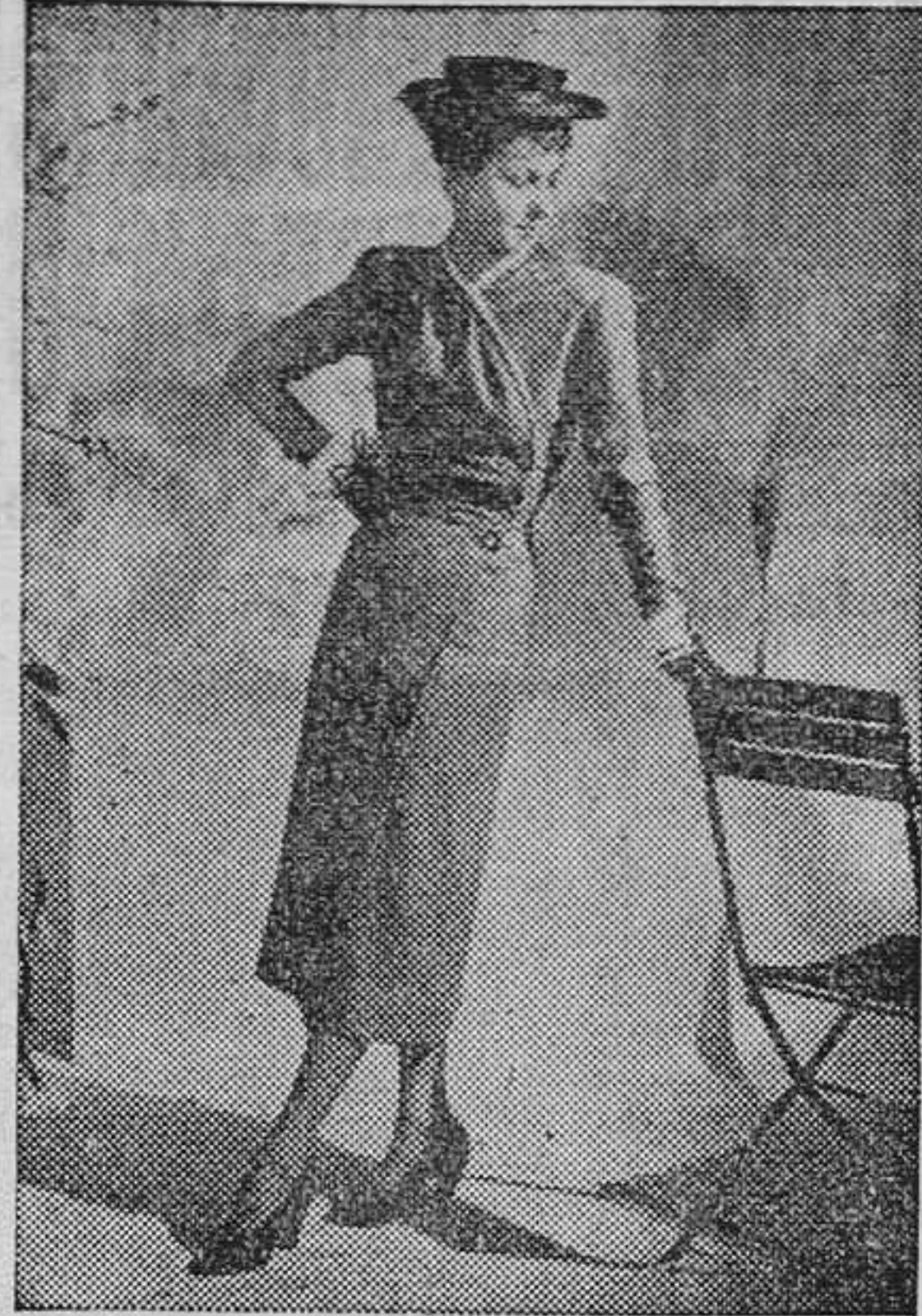
Vestido-abrigo con la largura de falda aceptada por la mujer inglesa como ideal de la línea femenina

EL JERSEY, EN PRIMER PLANO Por los salones del Consejo británico del Color han desfilado varias maniqués londinenses, exhibiendo las últimas creaciones de trajes confeccionados con tela de punto, y uno de los géneros ingleses de exportación más apreciados por los clientes extranjeros.