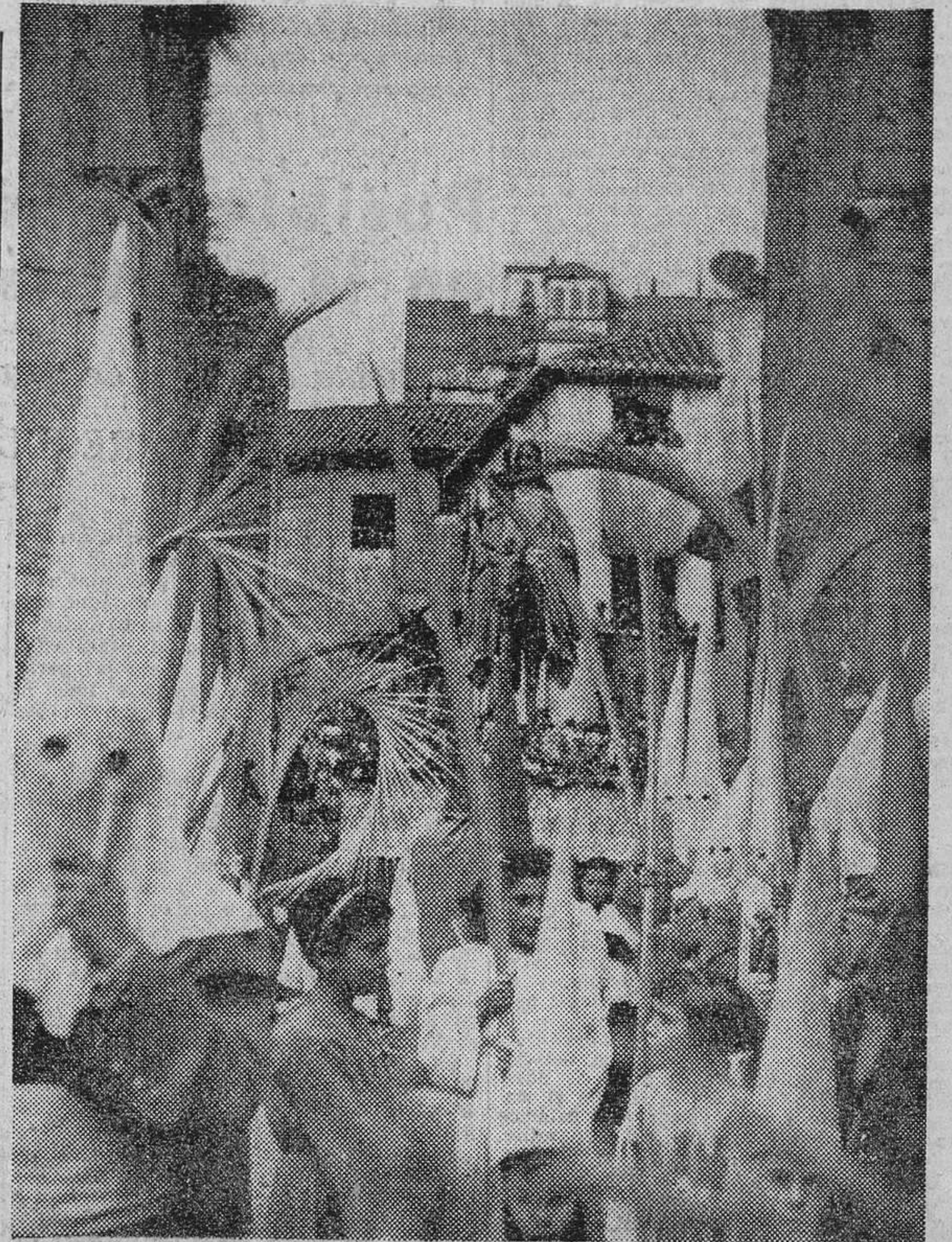
La policroma y brillante procesión de la Entrada de Jesús en Jerusalén pasa por el Arco de Elvira; tuvo que regresar poco después a su templo a causa de la lluvia.

El Alcalde, en representación del jefe del Estado, presidió el magnífico desfile de la Santa Cena y María Santísima de la Victoria