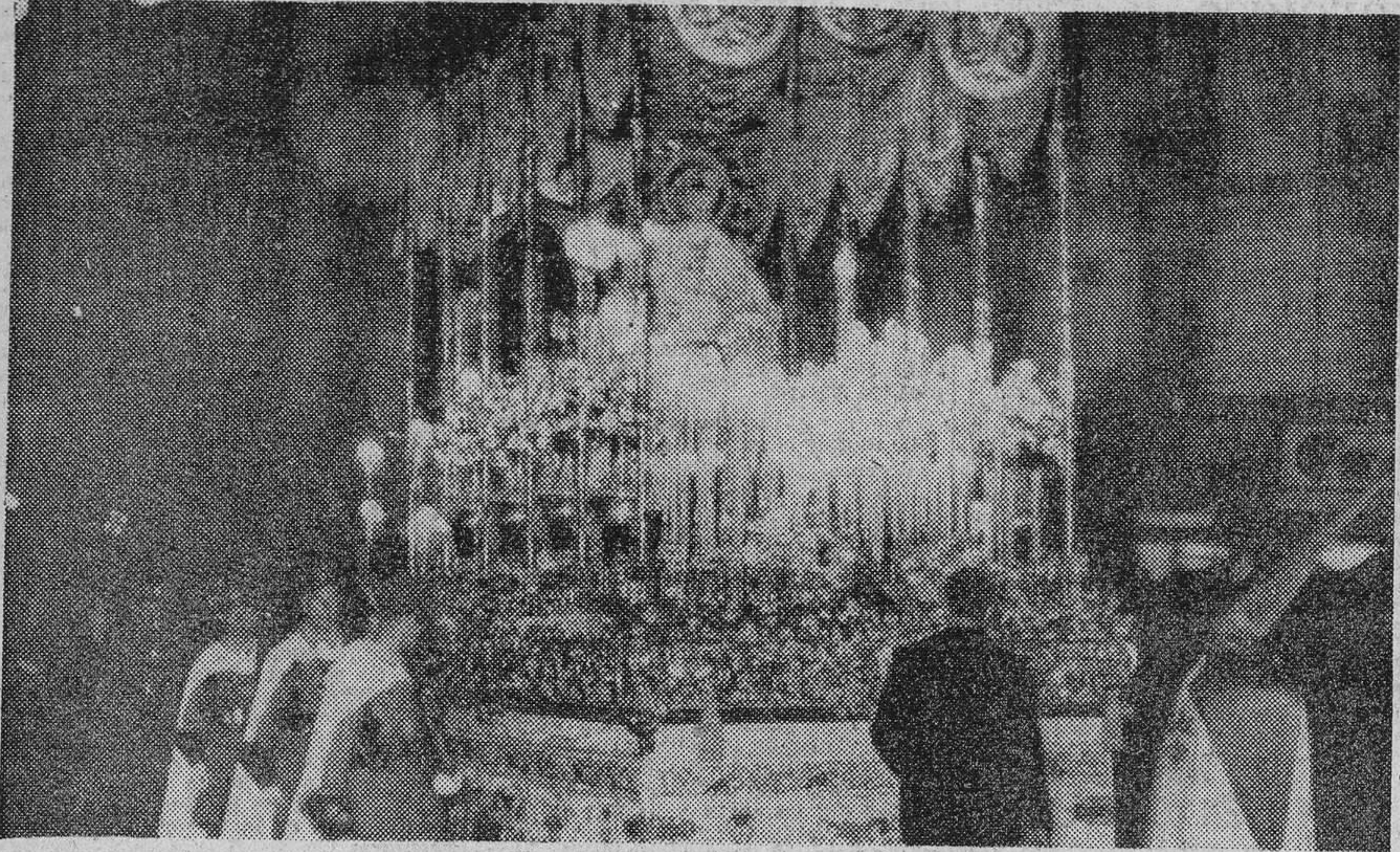
El «paso» de la Santísima Virgen de la Victoria, escoltada por fuerzas de Regulares, durante su desfile procesional.

La Entrada de Jesús en Jerusalén no pudo recorrer todo su itinerario, por la lluvia