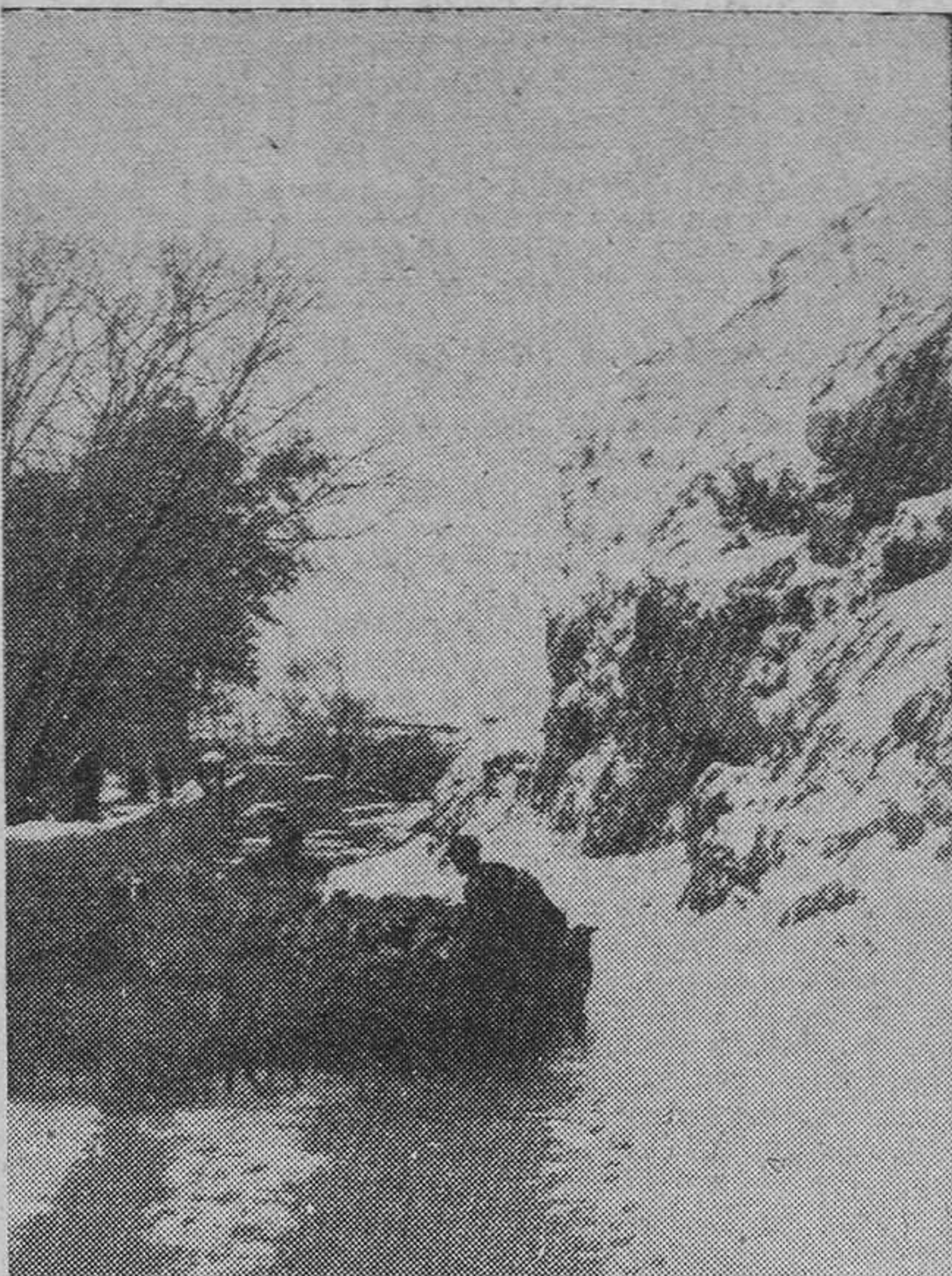
Baza ofrece encantadores panoramas en sus alrededores, como el que reproduce nuestra foto, que recoge el camino que conduce a la Fuente de San Juan.