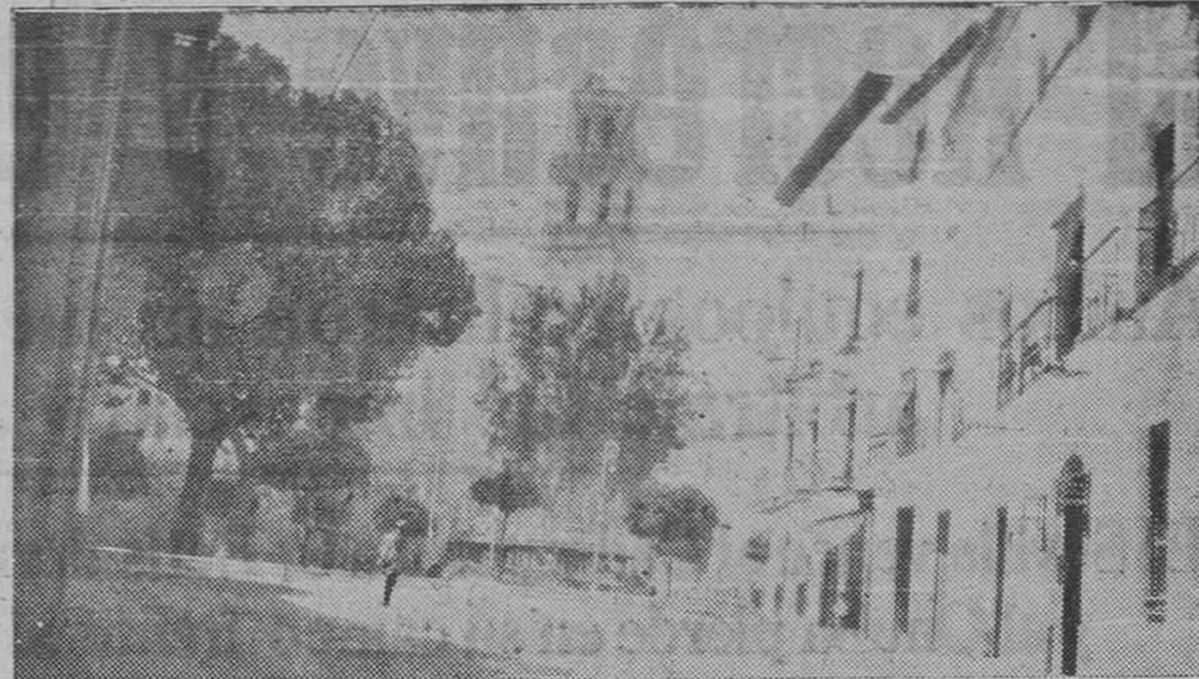
Plaza del Generalísimo (antes Mayor), de Baza, y al fondo lo esbelta torre de la iglesia Colegiata.

En el nuevo presupuesto se mejoran los haberes de todo el personal; como mínimo, el 50 por 100 de lo que cobraban en 1936. En los funcionarios más