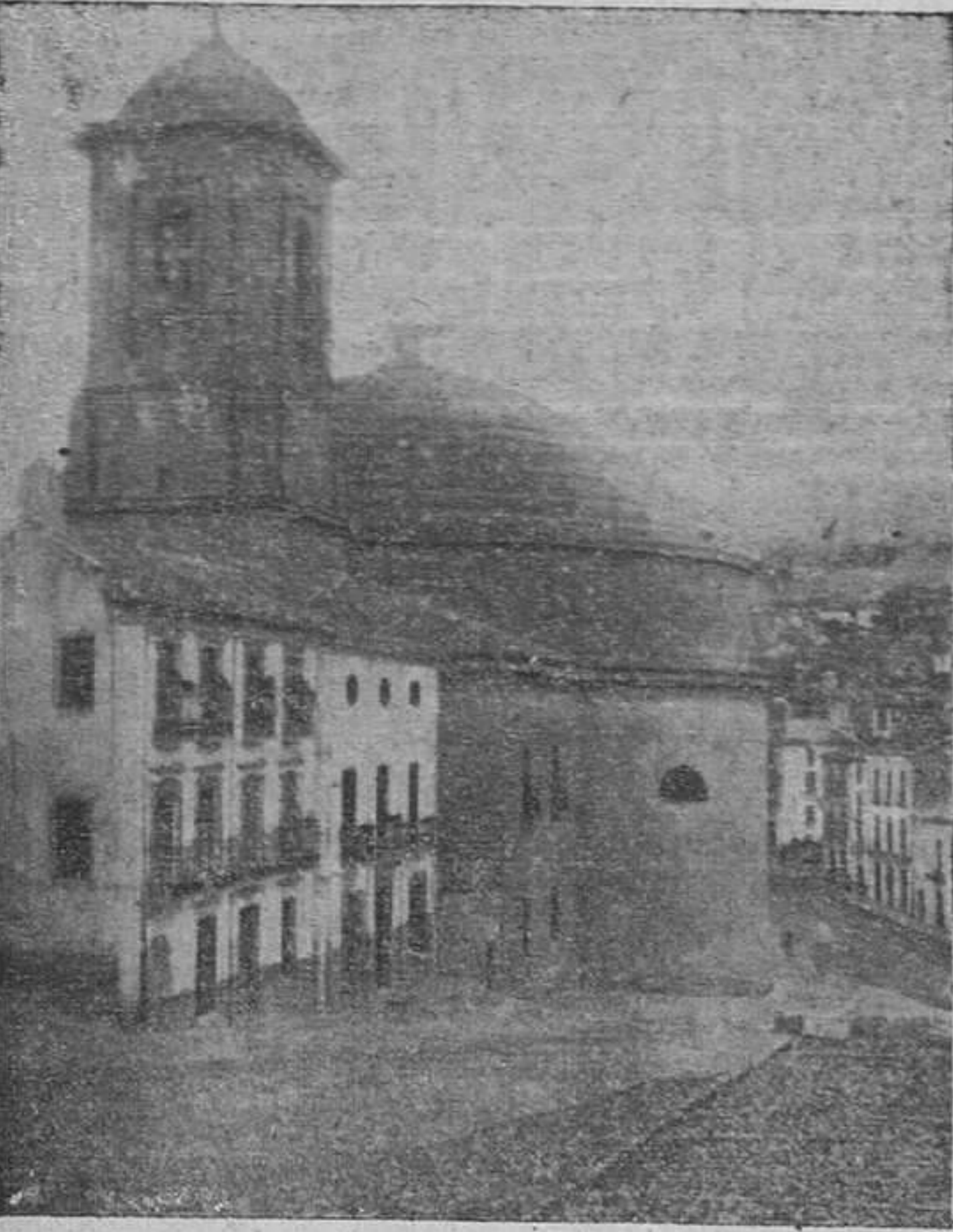
Maravillosa vista de la plaza de España, de Montefrío, y al fondo el templo primitivo de la villa.

En este día en que Montefrío se prepara para rendir fervoroso culto a su Patrona, la Santísima Virgen de los Remedios, hay que