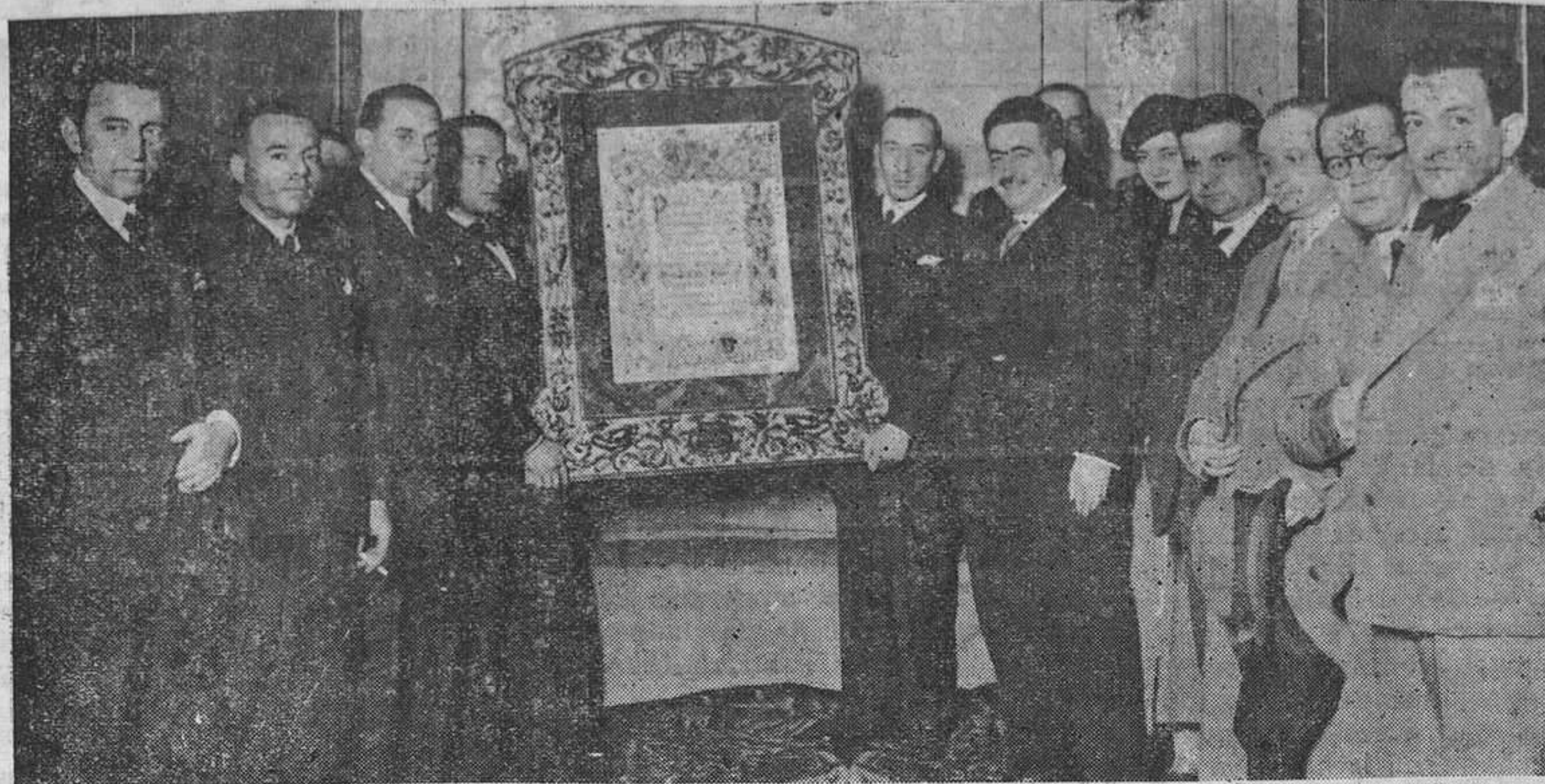
Empleados municipales de la provincia de Jaén en el momento de hacer entrega al alcalde de Madrid, señor Salazar Alonso, de un pergamino, por su meritísima labor en defensa de los funcionarios de administración local.