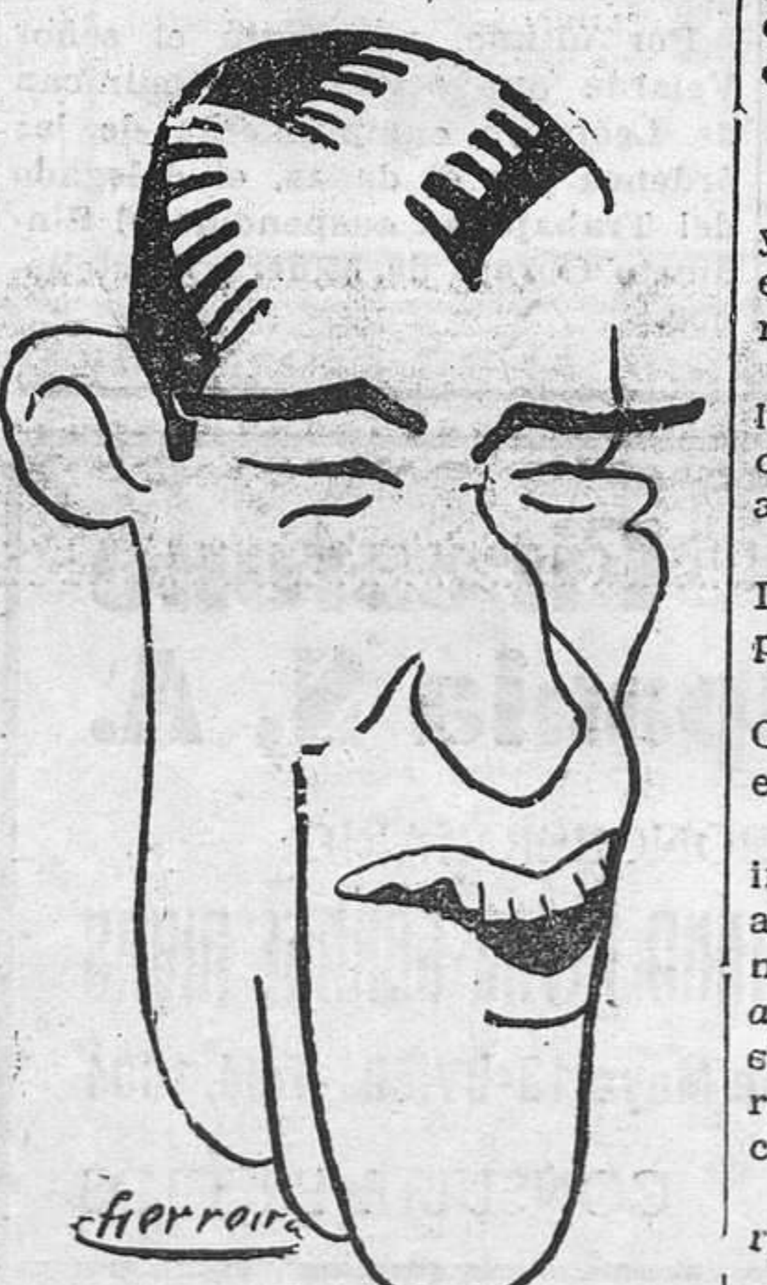
Aquí tienen ustedes a Primo Carnera que, cuando Uzcudun estaba en España, mostraba deseos de enfrentarse por tercera vez con el hombre de Regil, pero en cuanto este saltó el "charco", vuela hacia Nueva York donde se cree a salvo de las garras de nuestro compatriota.