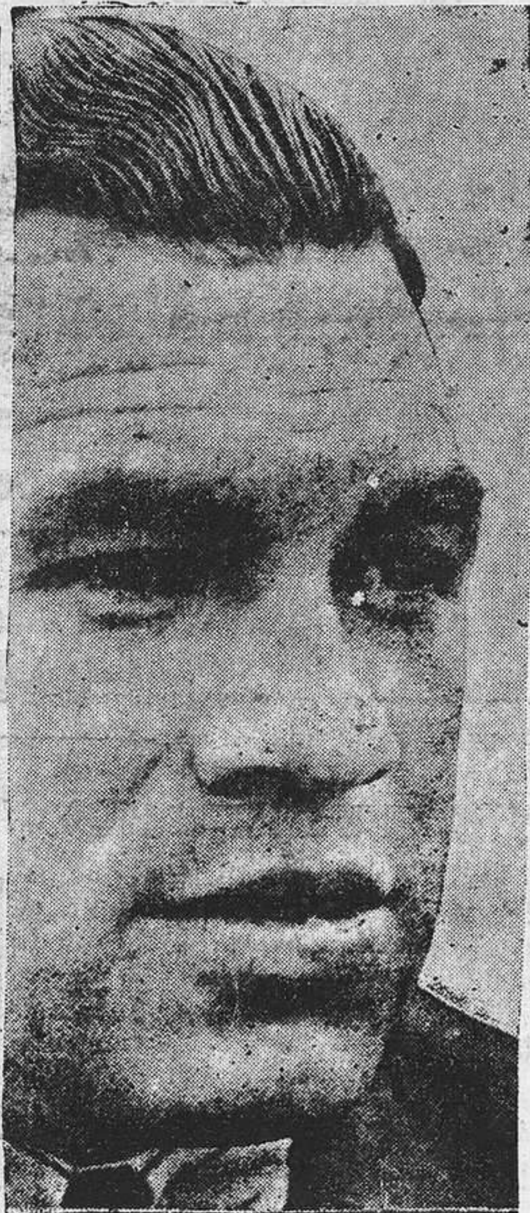
Paulino Uzcudun que fué a Buenos Aires a pelear con Carnera y se encontró con que el italiano prefiere volar hacia Nueva York a "jugar" unos asaltos con el viejo ex leñador.

Para el próximo domingo, día diez, existe gran expectación entre el público local por presenciar el partido que ha de tener lugar en el campo de La Laguna, entre el equipo forastero y nuestro equipo local. Se espera ver jugar a los jugadores forasteros, pues son un conjunto de gran fama y digno de