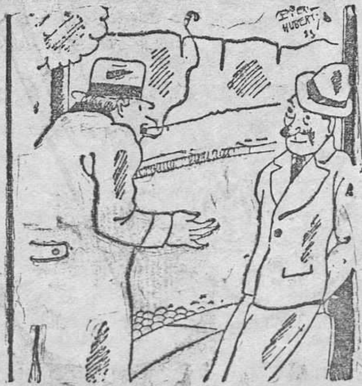
—En América aumentan los asesinatos todos los días. —Oiga usted, ¿y por la noche?