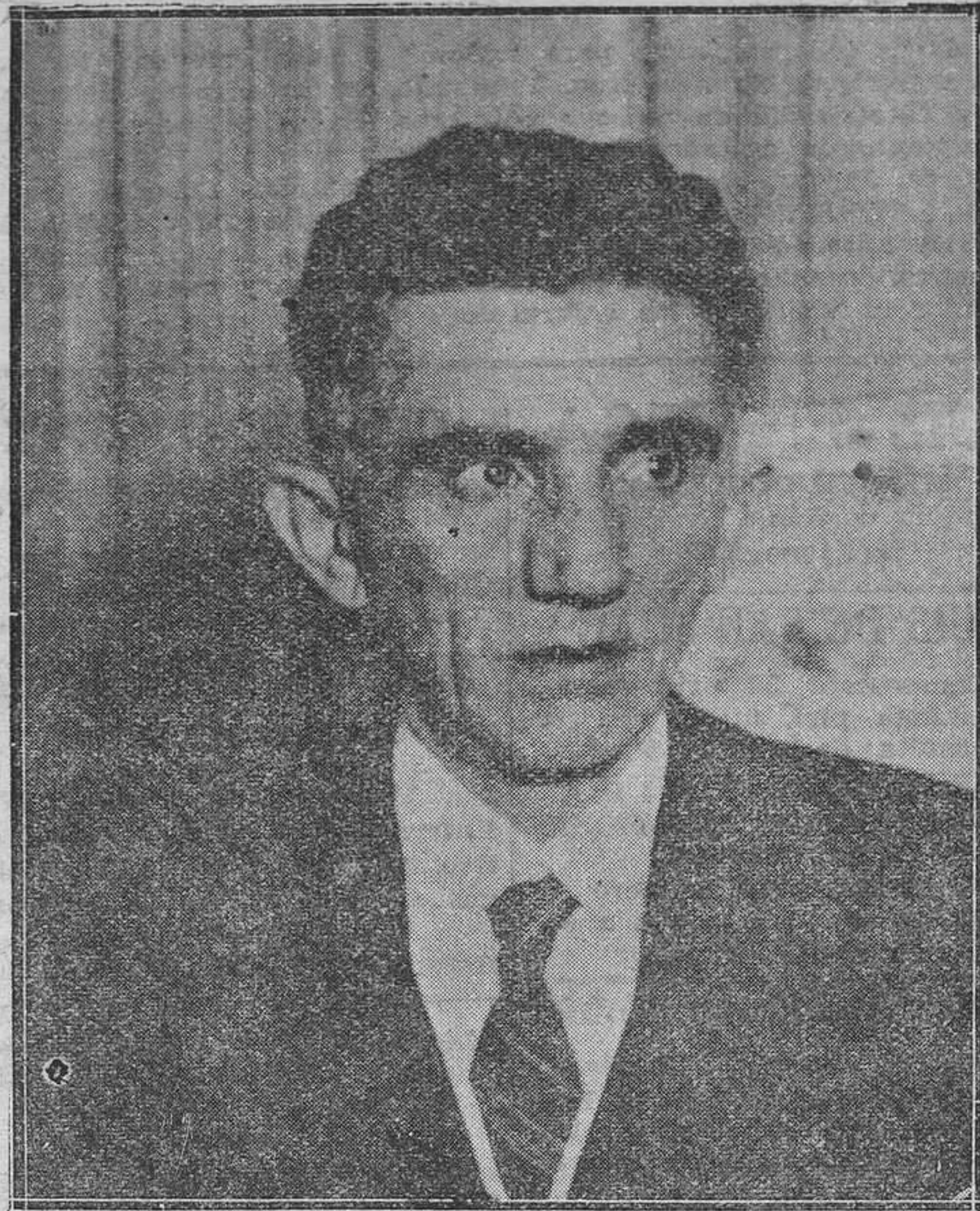
Don Manuel Rico Avello, ministro de la Gobernación que ayer llegó a Oviedo, y donde recibió cordiales felicitaciones por su afortunada gestión en tan importante cargo.

Pascua, Navidad, Año Nuevo, Reyes son los días que las señoras prefieren para usar el insuperable JABON "VETUSTA", por su abundante espuma que deja un olor muy agradable en las ropas