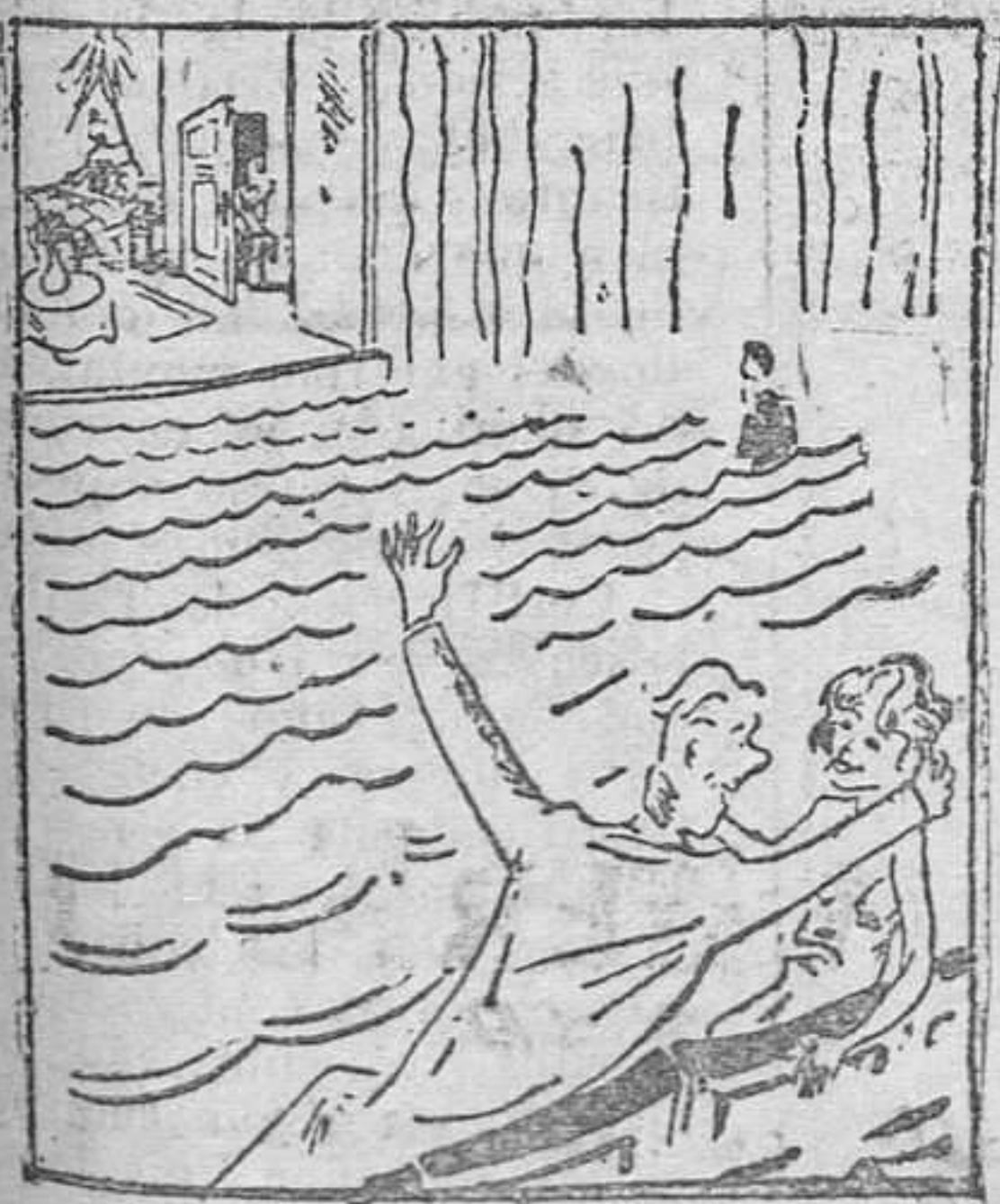
—Perdóneme, señorita. ¿Está libre esta butaca?

El mejor y más variado surtido en juguetes. Artículos de piel y objetos para regalo. Próximamente llegará a este BAZAR una popularísima figura para recoger las cartas de los Reyes Magos.