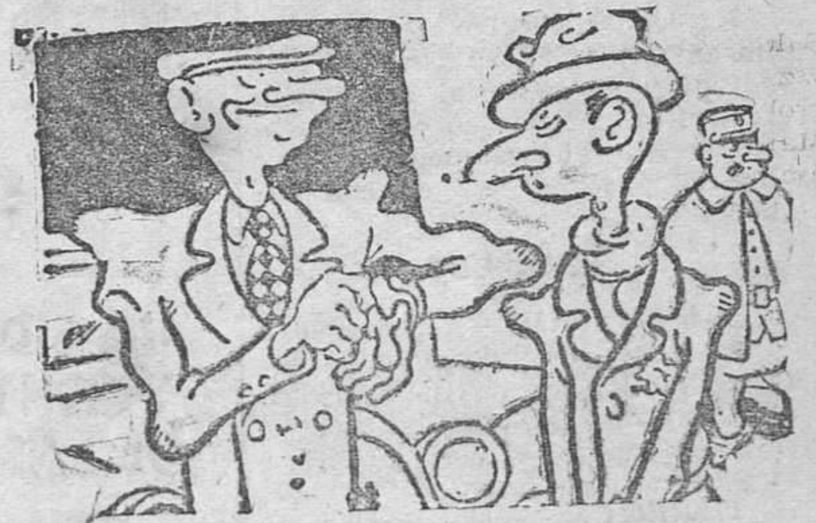
—¿Tienes ahí tres duros? —Hombre, aquí no. —¿Y en tu casa? —Todos buenos, gracias a Dios.