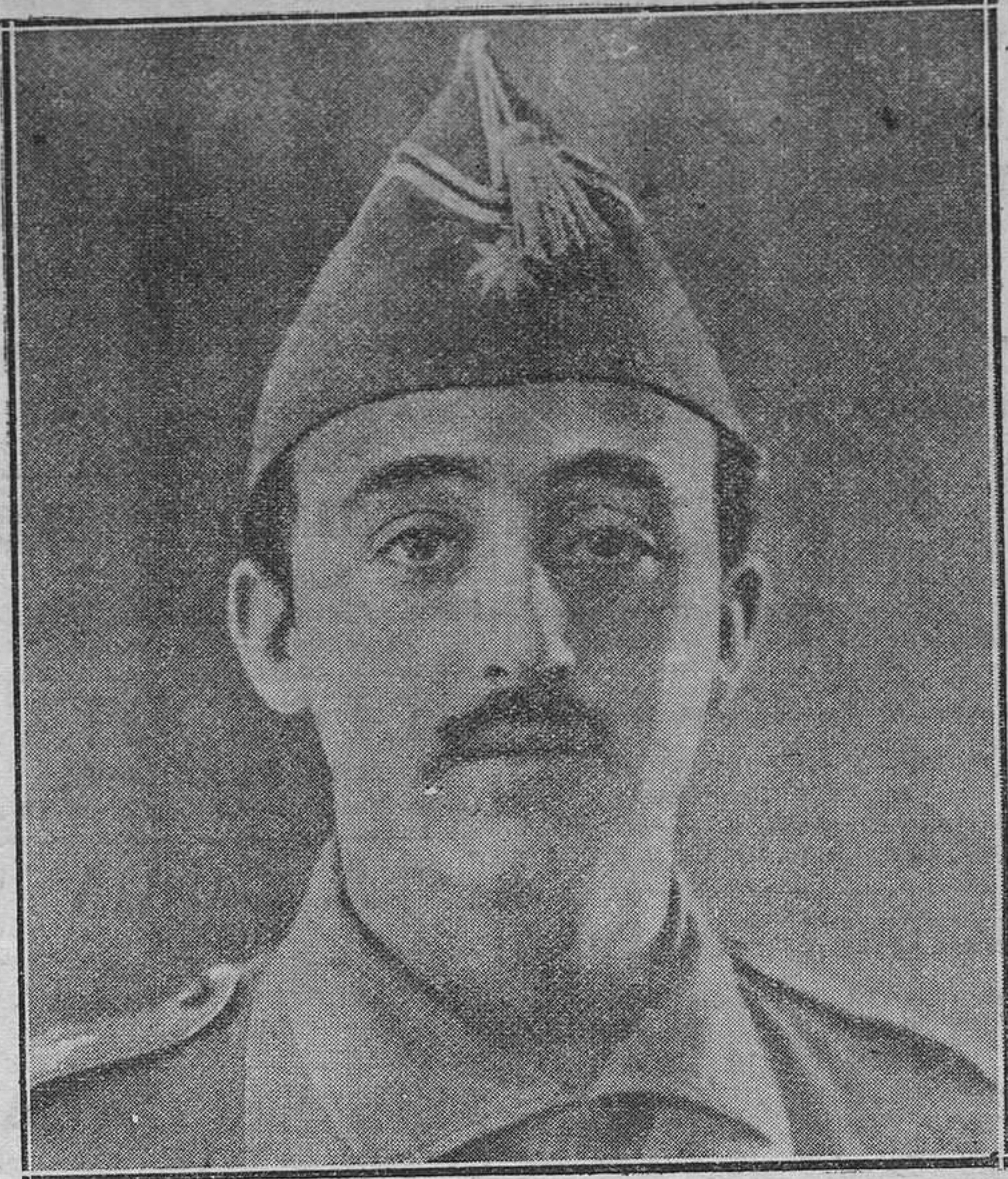
El general don Francisco Franco llamado por el Gobierno a Madrid para encomendarle una delicada misión en el Norte de Africa.