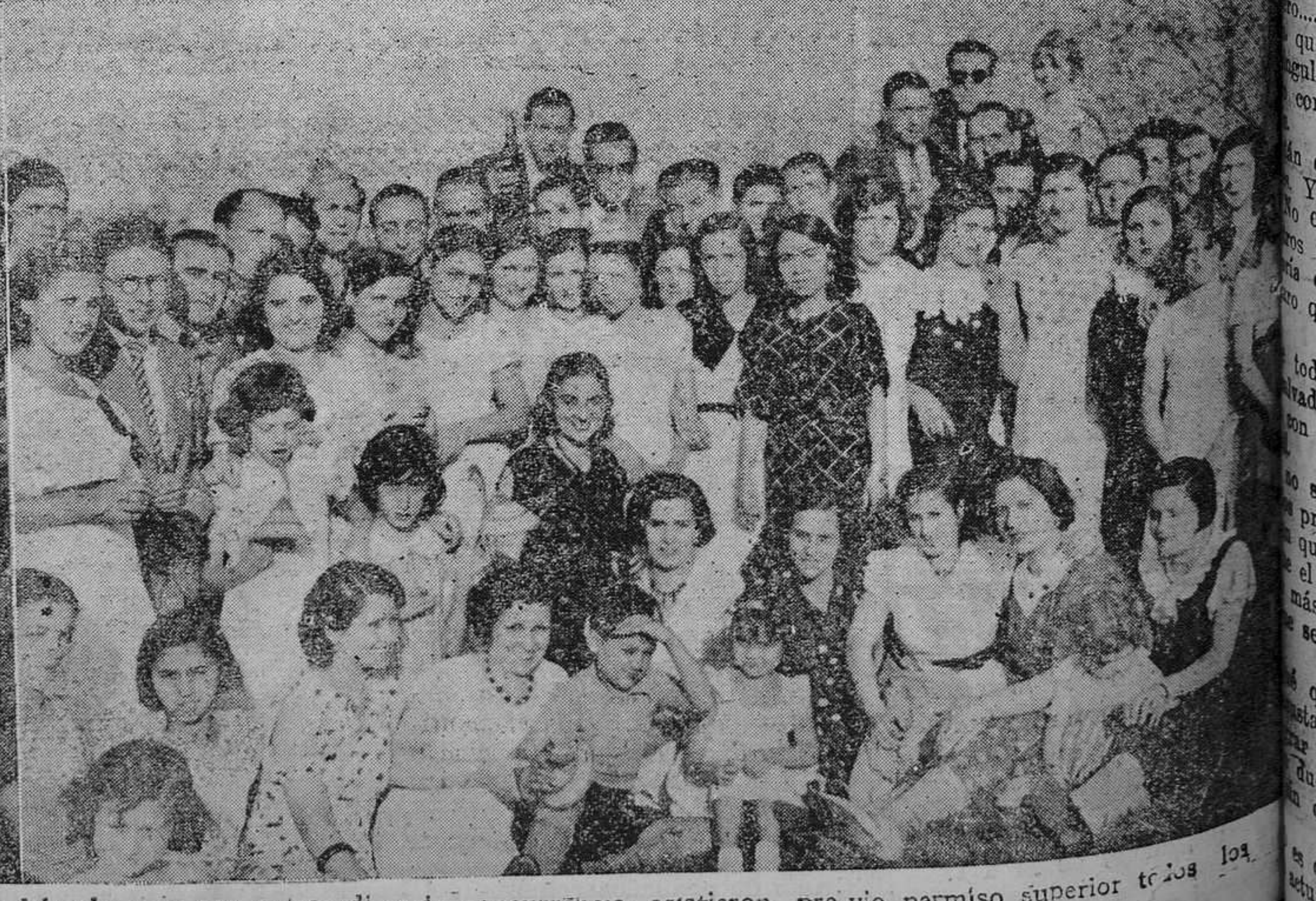
OVIEDO.— Al "Día de Galicia" organizado por el Centro Gallego y celebrado ayer con extraordinaria concurrencia, asistieron, por vicio permiso superior de los señores, soldados gallegos que sirven en el regimiento de Infantería número 3. Al lado un grupo de alegres romeros.