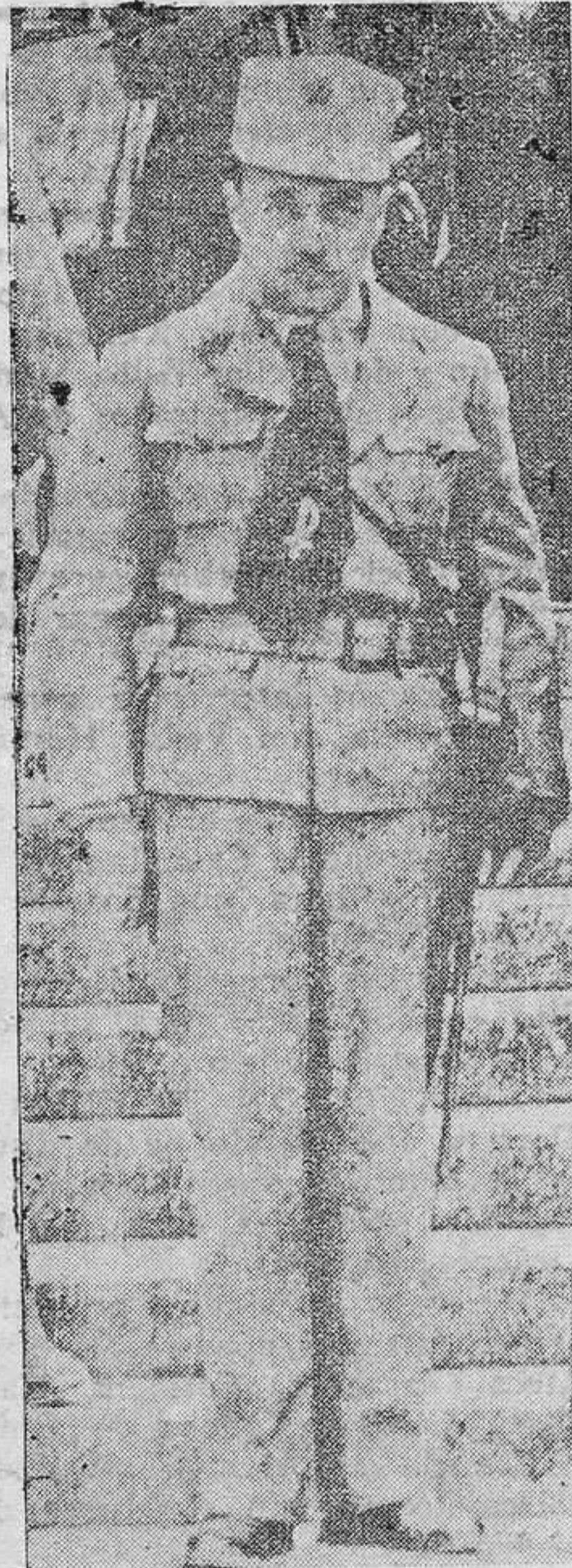
EL CANCELLER DOLLFUS

VIENA.— Los terroristas que se habían apoderado de la estación de radio de Ravag, fueron atacados por tropas de la policía y de Schutz (Cuerpo de Seguridad), siendo aquéllos desalojados alrededor de las tres de la tarde. Se hicieron fuertes en las