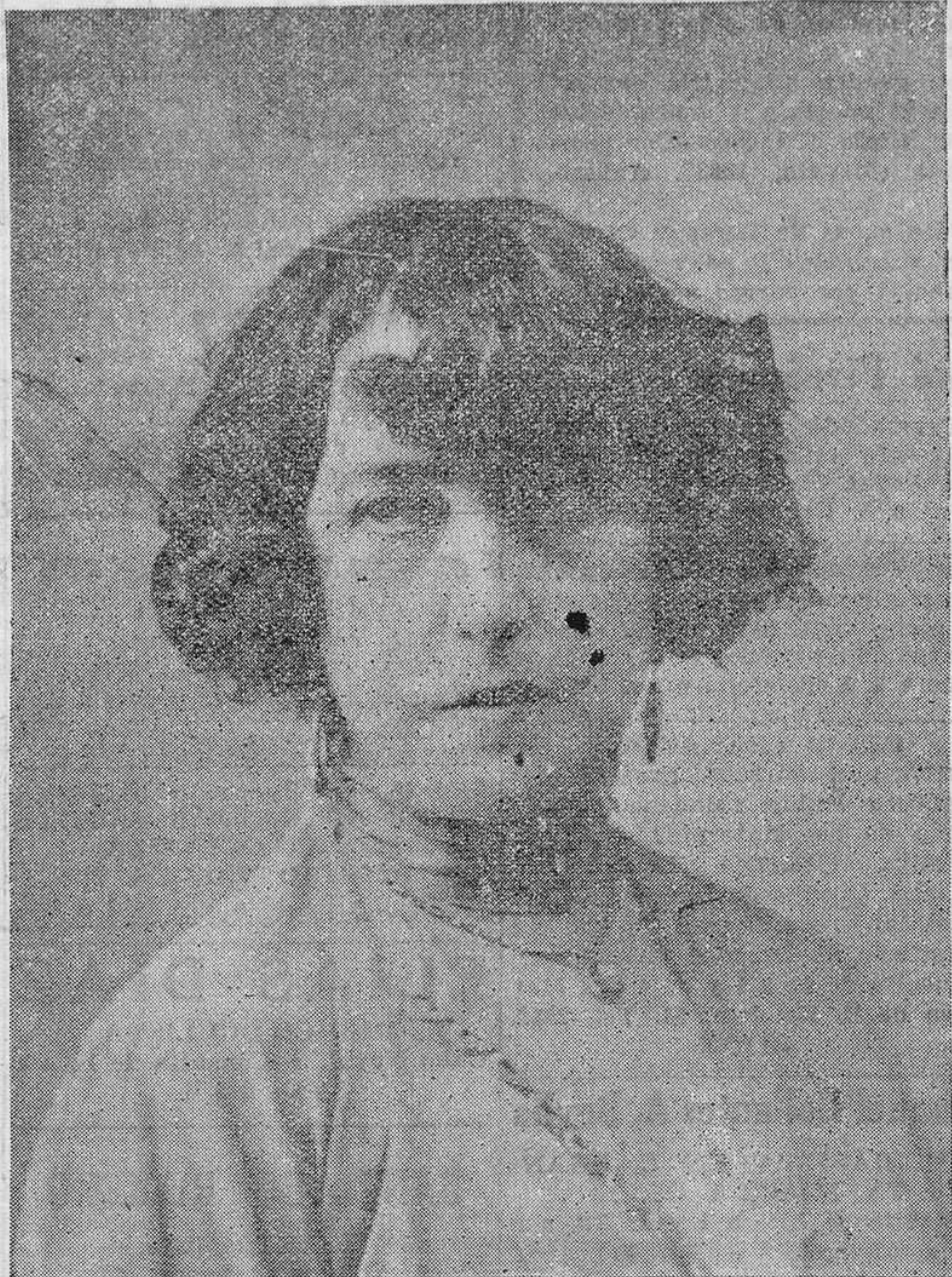
La notable escritora doña Concha Espina, a quien el Gobierno ha designado embajadora extraordinaria de España en los actos que han de celebrarse en el Perú para conmemorar la fundación de la ciudad de Lima.