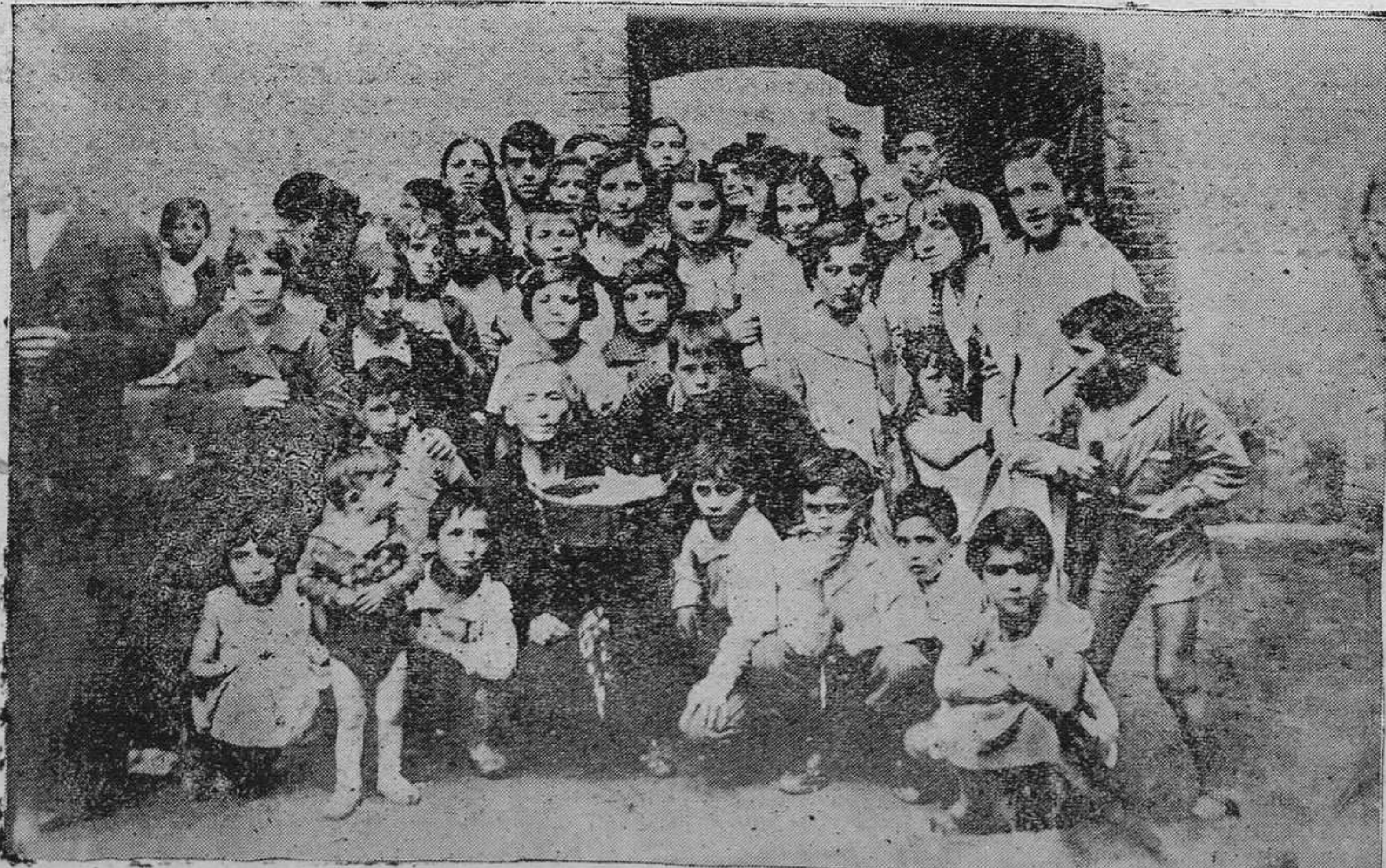
Grupo de pequeños romeros del barrio de Foncalada, que a causa de la lluvia vieron frustrada el domingo la romería.