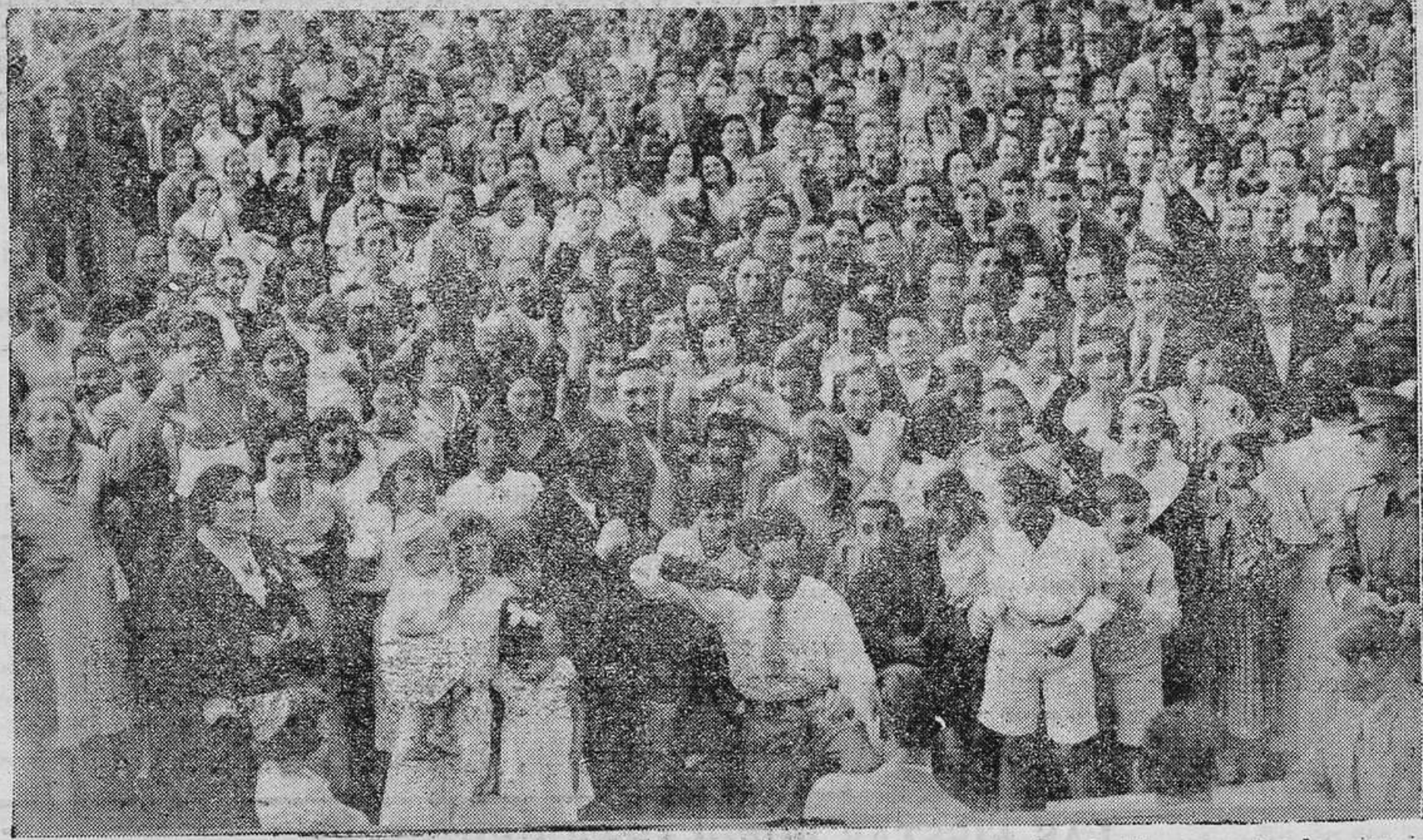
OVIEDO.— Nutrido grupo de soldados gallegos que sirven en el regimiento de Infantería número 3. Al lado un grupo de alegres romeros que asistieron ayer a la fiesta organizada por el Centro Gallego.

El arquitecto municipal denuncia que en la casa número 24 de la calle de la Concepción se están ejecutando obras sin el consentimiento autorizado por Ayuntamiento.