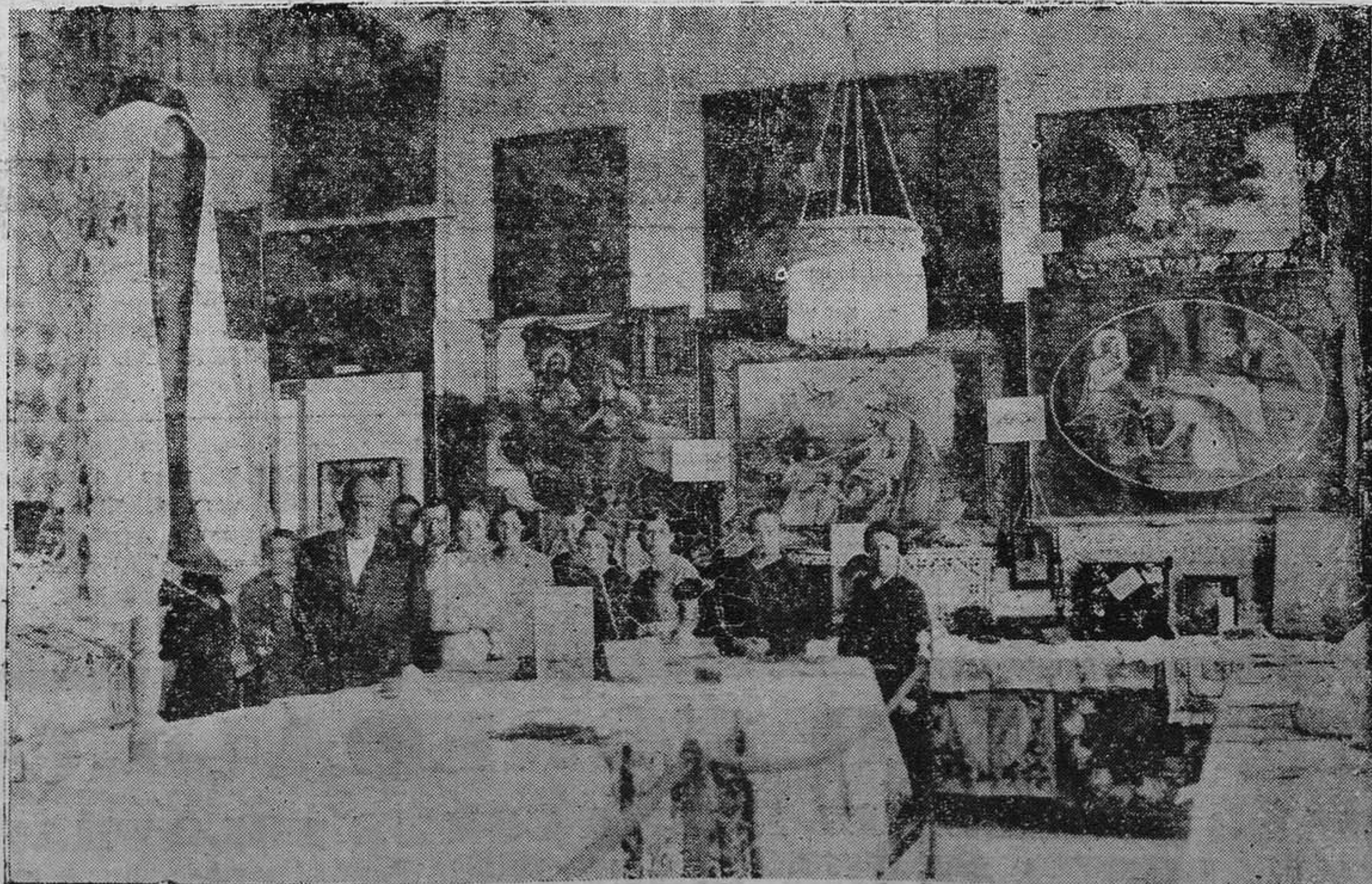
LA FELGUERA.—Detalle par y y) de una de las salas de confeccioner.