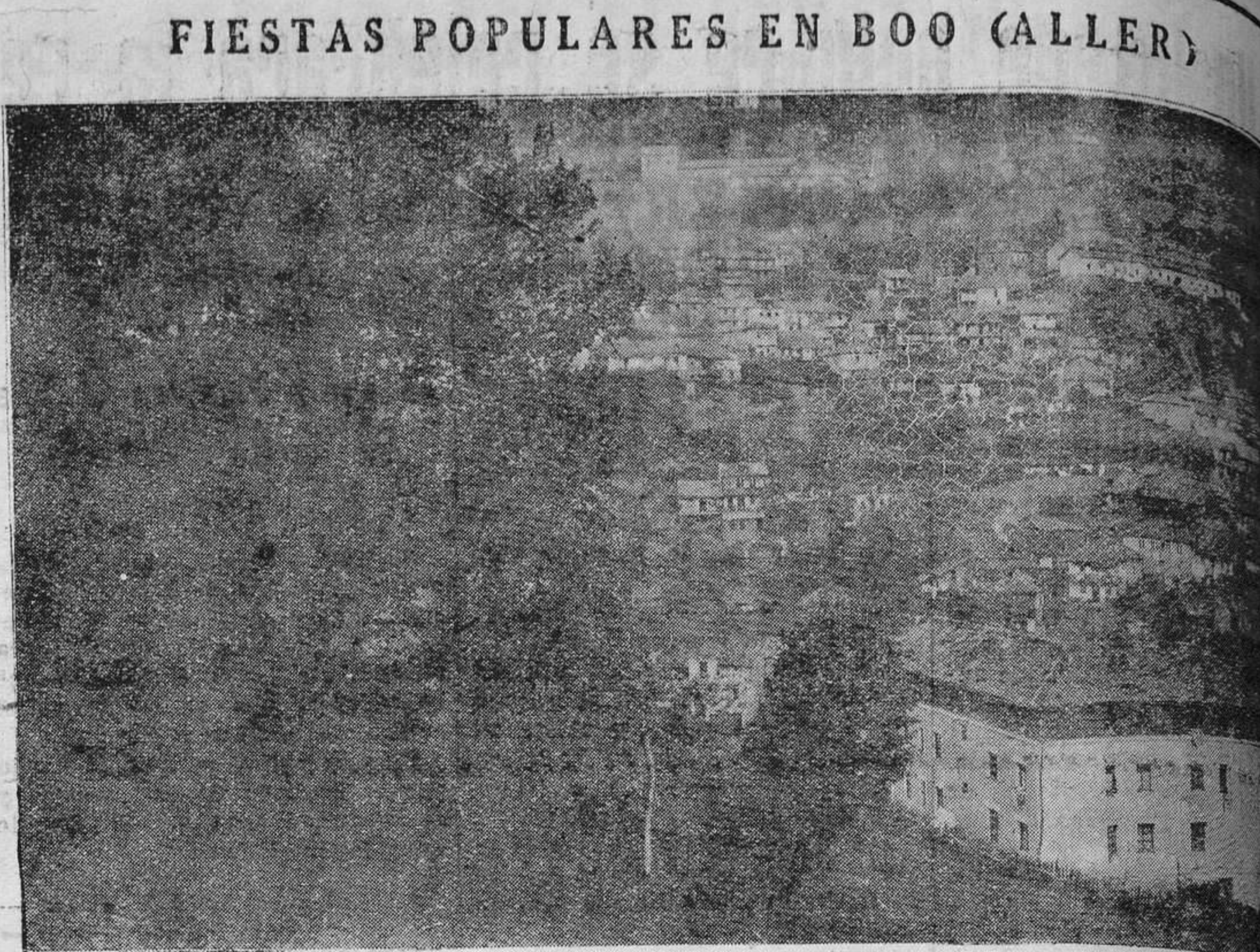
BOO (Aller).— Una vista panorámica del pueblecito de Boo, en donde comienzan hoy fiestas tradicionales en honor de San Pedro.

Don Pío,apurando el último sorbo de café, convoca sus hues-