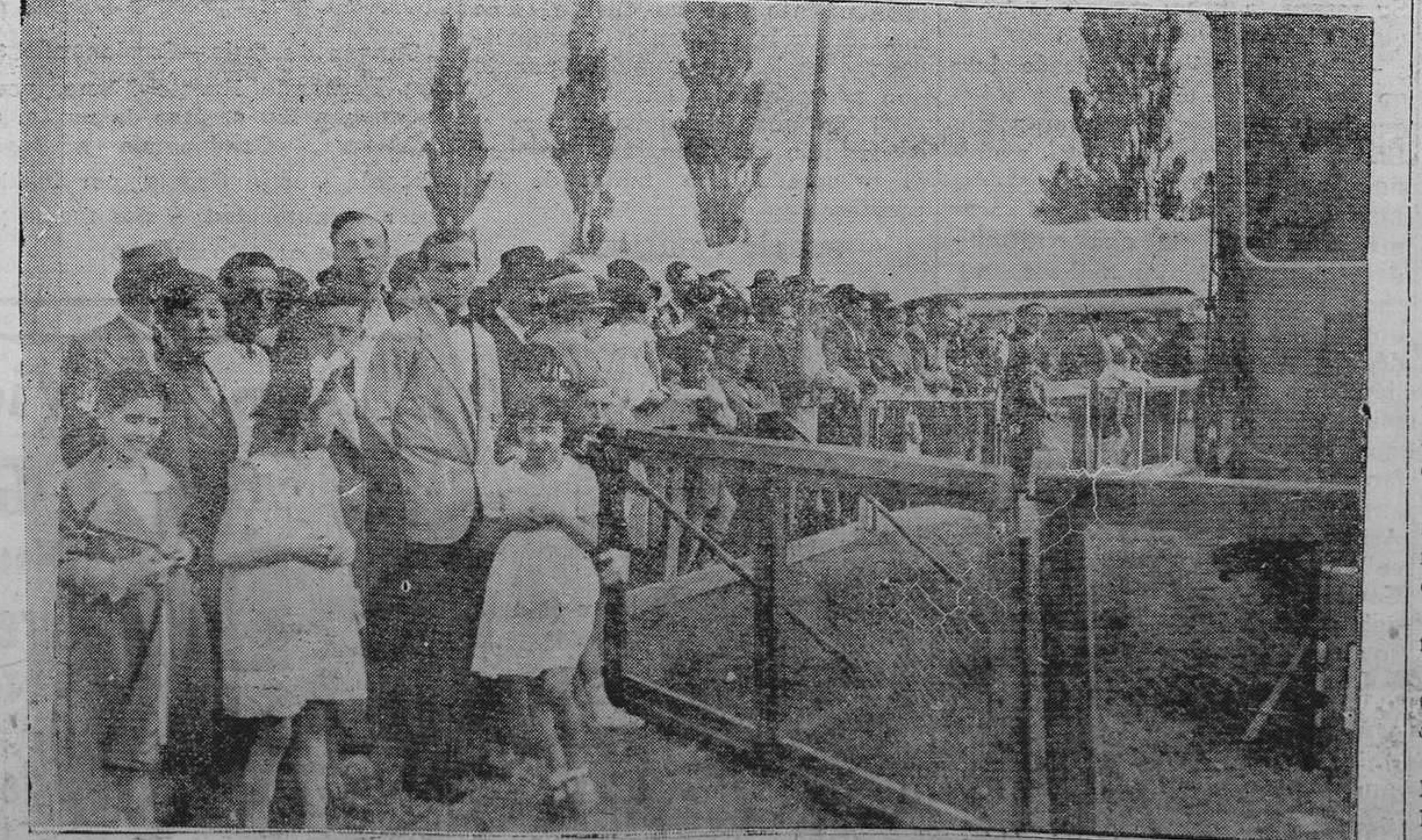
OVIEDO.— Grupo de público contemplando el interesante espectáculo de echar de comer a las fieras del circo Carl Hagenbeck.