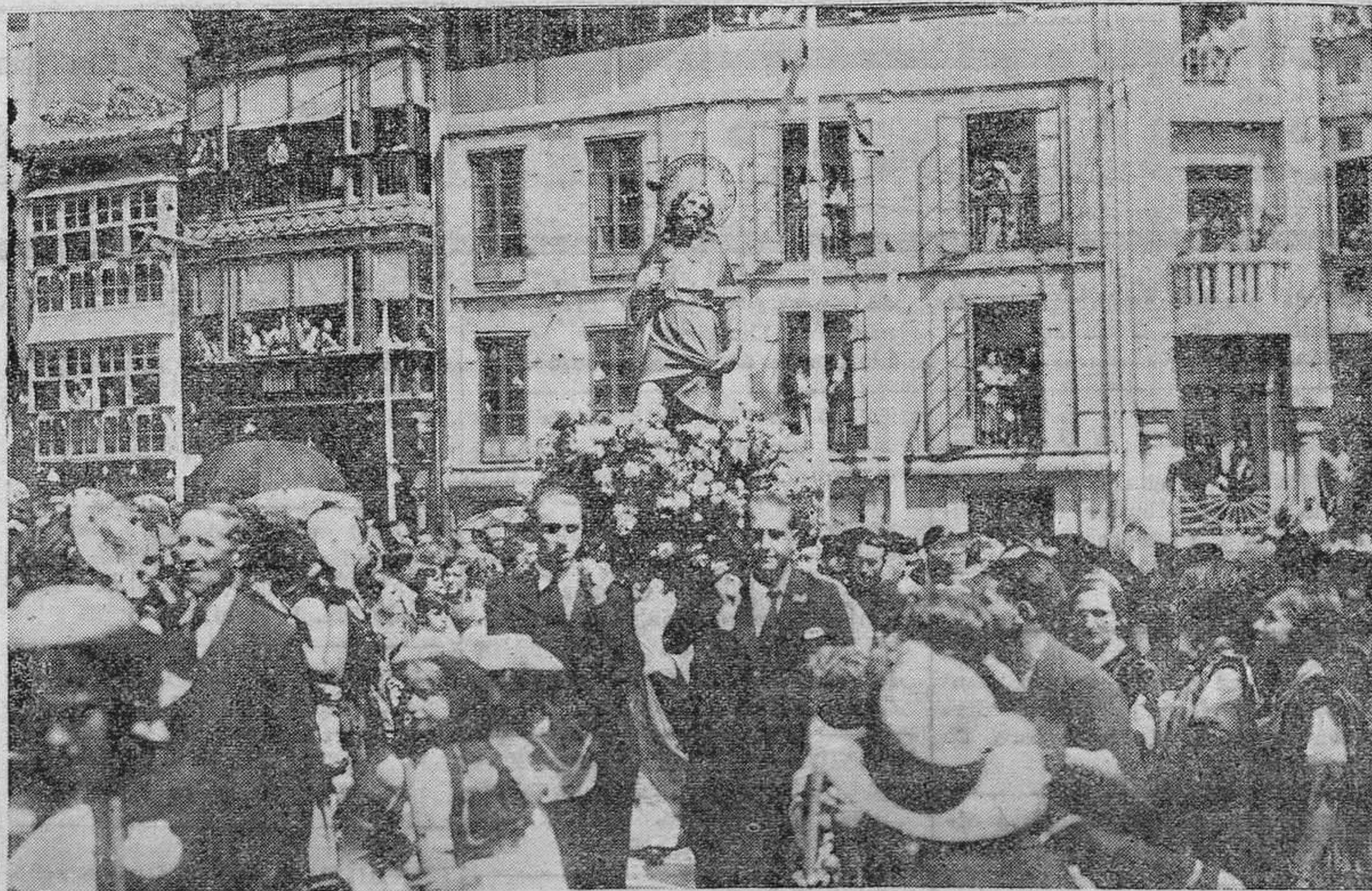
Llanes, la hermosa villa que Asturias tiende por Oriente, hacia la Montaña, como invitando a visitar nuestra tierra, ha vestido en estos días sus mejores galas para festejar a San Roque. Es tradición vieja entre los marinos cántabros la de compartir su devoción a la Patrona, Nuestra Señora del Carmen, con el Santo abogado de la peste. Llanes se distingue por su entusiasmo, por lo clásico y típico de sus fiestas religiosas y profanas, y por otras muchas cosas más, en los honores al peregrino canonizado. He aquí una demostración: el paso de la imagen, entre las aclamaciones de vecinos y forasteros, por una de las principales calles de la población.