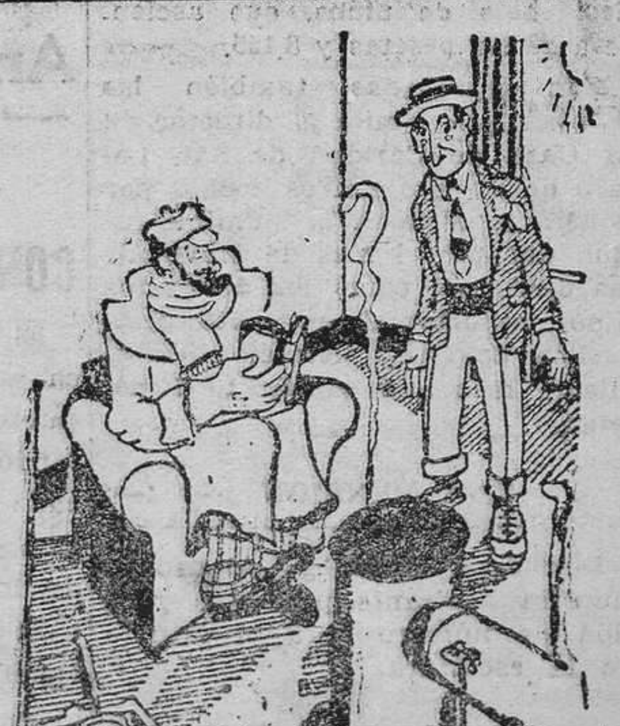
—Eufrasio, esto me recuerda que no hemos comprado aún los polvos insecticidas.