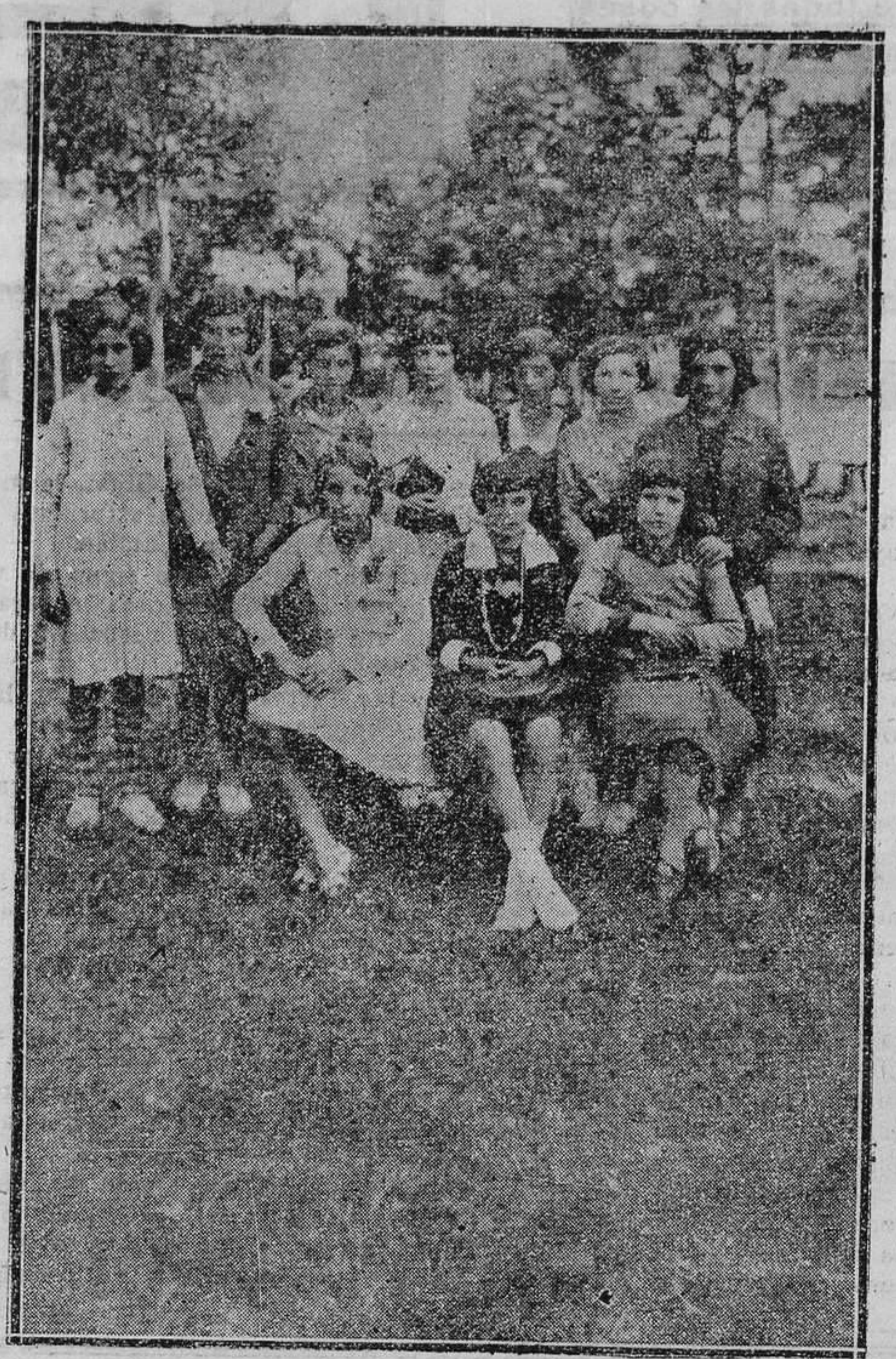
Un grupo de niñas de la escuela de Soto (Aller) posando para REGION en la excursión celebrada a Gijón.