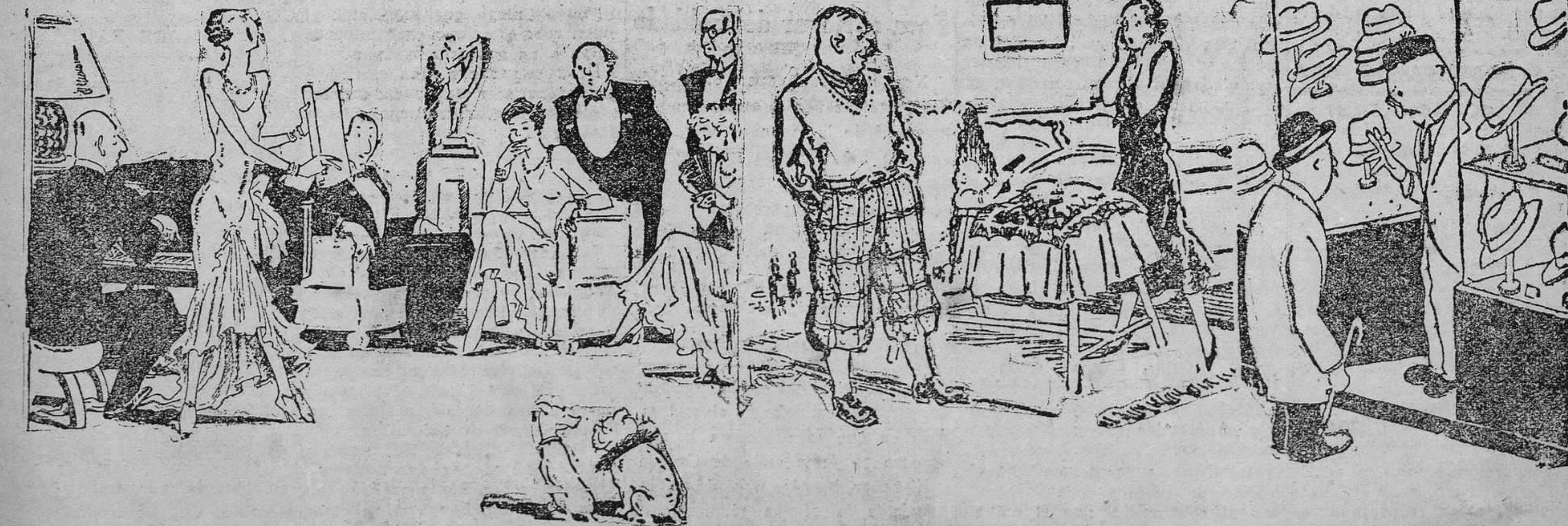
EL BULLDOG.—¿Por qué da esos gritos? EL FOX TERRIER.—¿No ves que le está pisando la cola?

—Este pobre Emilio, cree que Alfonso XII le ha usurpado la corona.