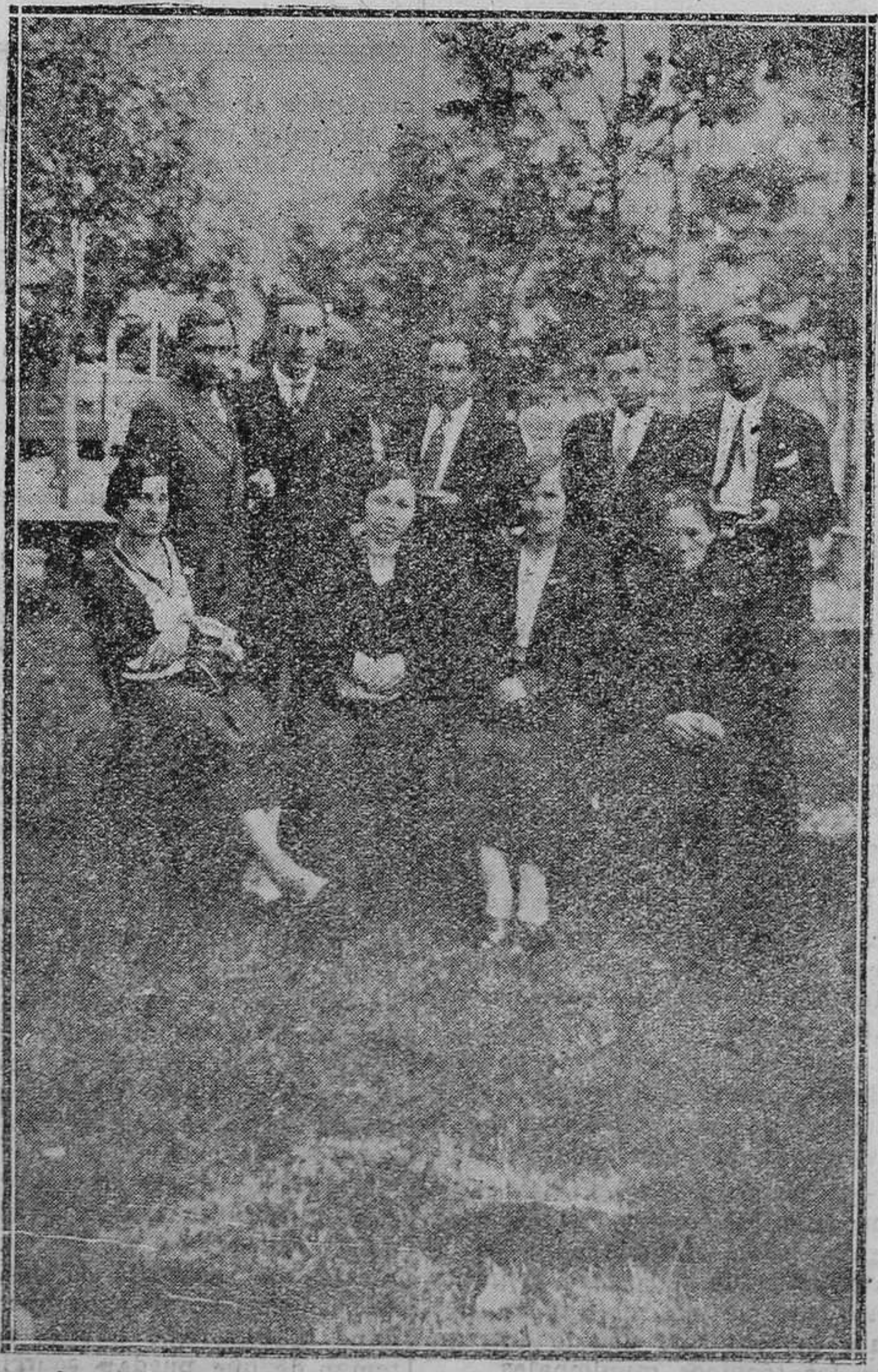
Grupo de profesores de las escuelas de Moreda y Soto en un descanso durante la excursión a Gijón.

MARQUINA (Vizcaya) Aguas termales, nitrogenadas, bicarbonatadas, radiactivas. Especiales para toda clase de afecciones del aparato respiratorio, enfermedades crónicas de la garganta y fosas nasales, angi-Instalación hidrológica completa. De 15 de junio a 30 septiembre. Nas, bronquitis, etc.