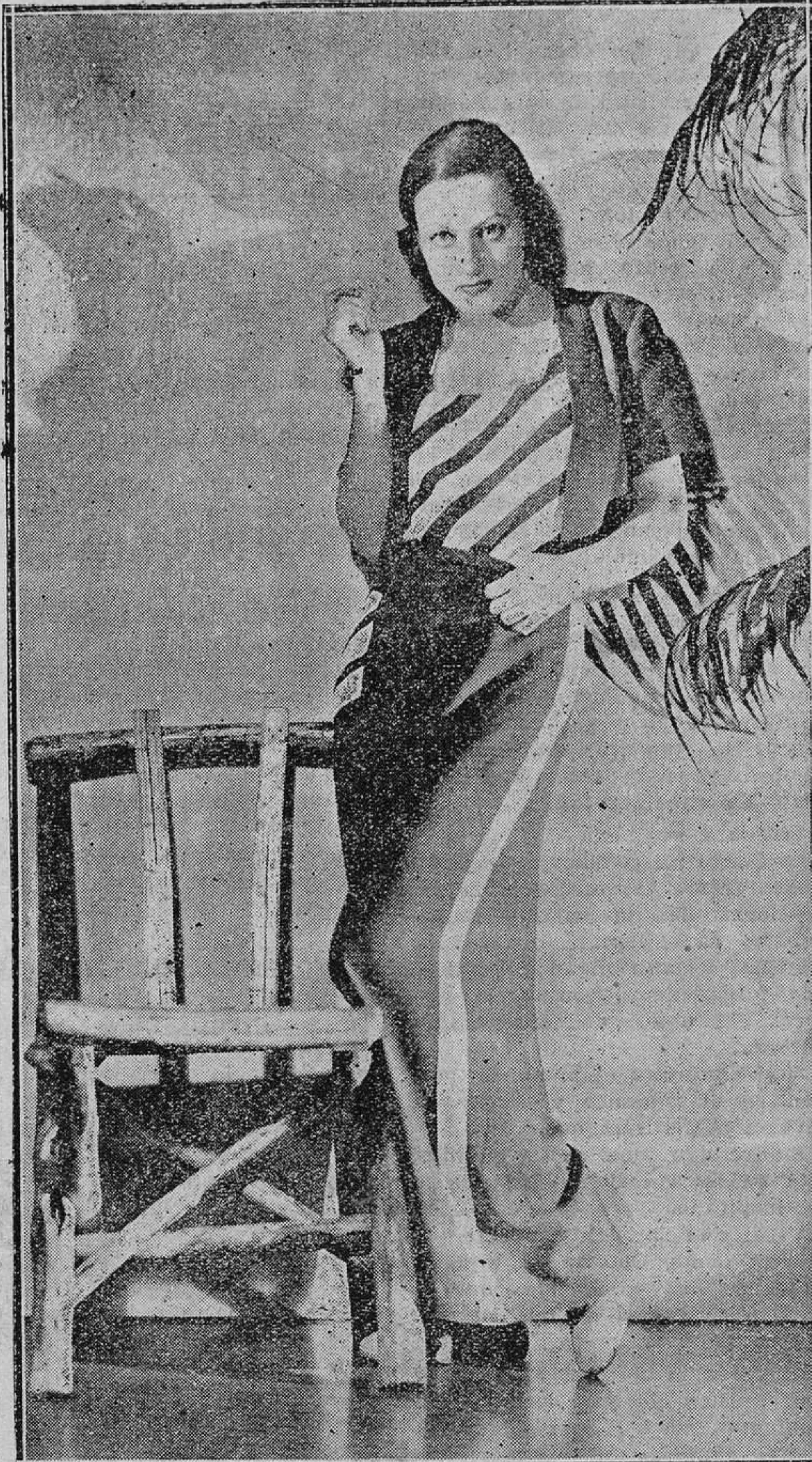
Joan Crawford, "estrella" de la M. G. M., luce un original pijama color rojo oscuro, rayado de blanco.

"Me formé un plan excelente; apenas dejara el colegio, me haría periodista; y unos años después, dueña de la experiencia necesaria, me dedicaría a escribir novelas o dramas... según se presentaran las cosas. ¡Era tan fácil!... ¡Sonaba delicioso!... (Como ven ustedes, no me sobraban sesos). Por cierto que nunca se me ocurrió ser artista, pues no me juzgaba lo bastante bonita. Cierta que me hacía ilusiones