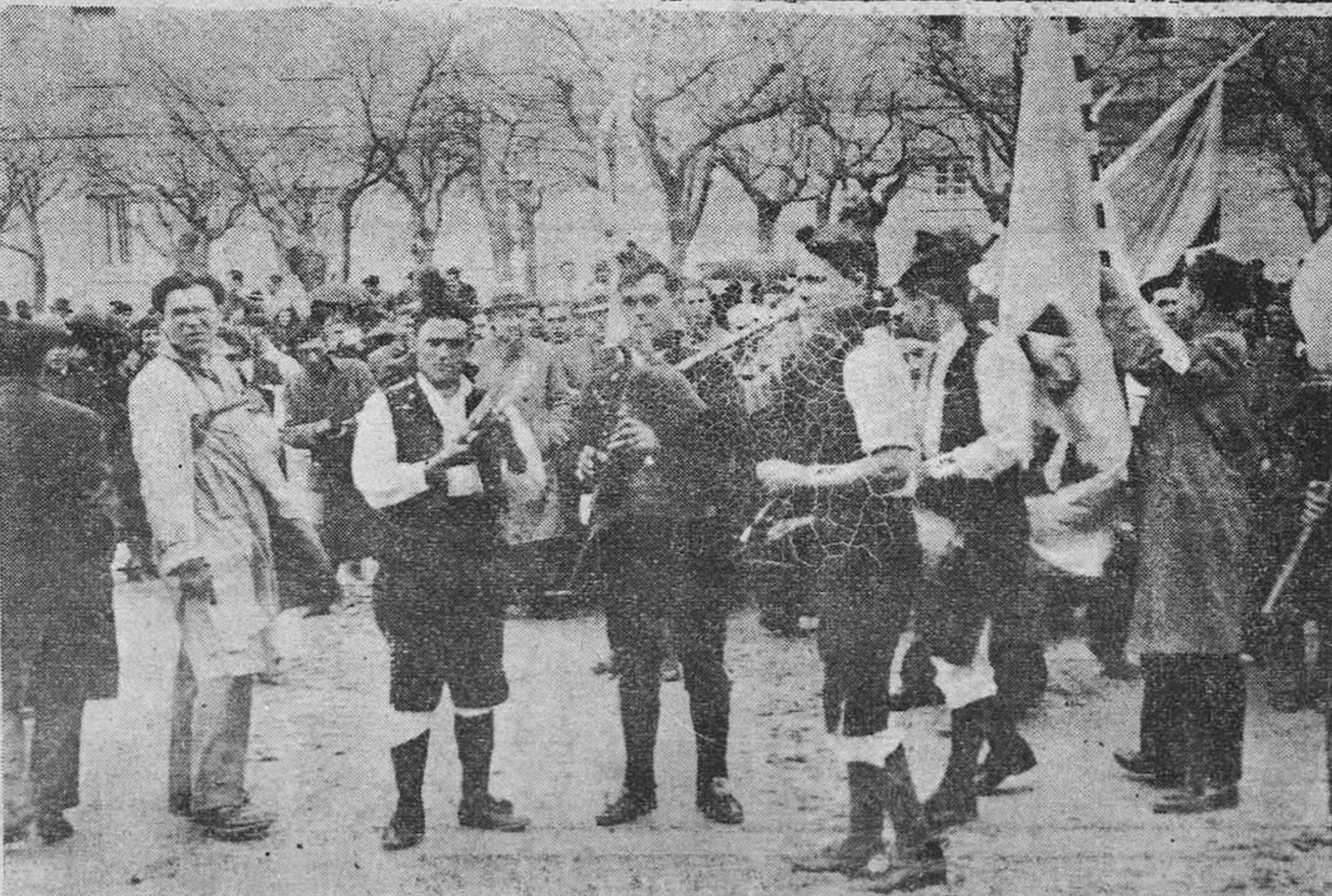
El Escorial.— Entre las muchas notas típicas que las representaciones regionales llevaron a los grandiosos actos del domingo, figuraba ésta, de la de Lugo: cuatro jóvenes que, luciendo el traje gallego, tocaban la gaita, el tamboril, el pandero y el triángulo.