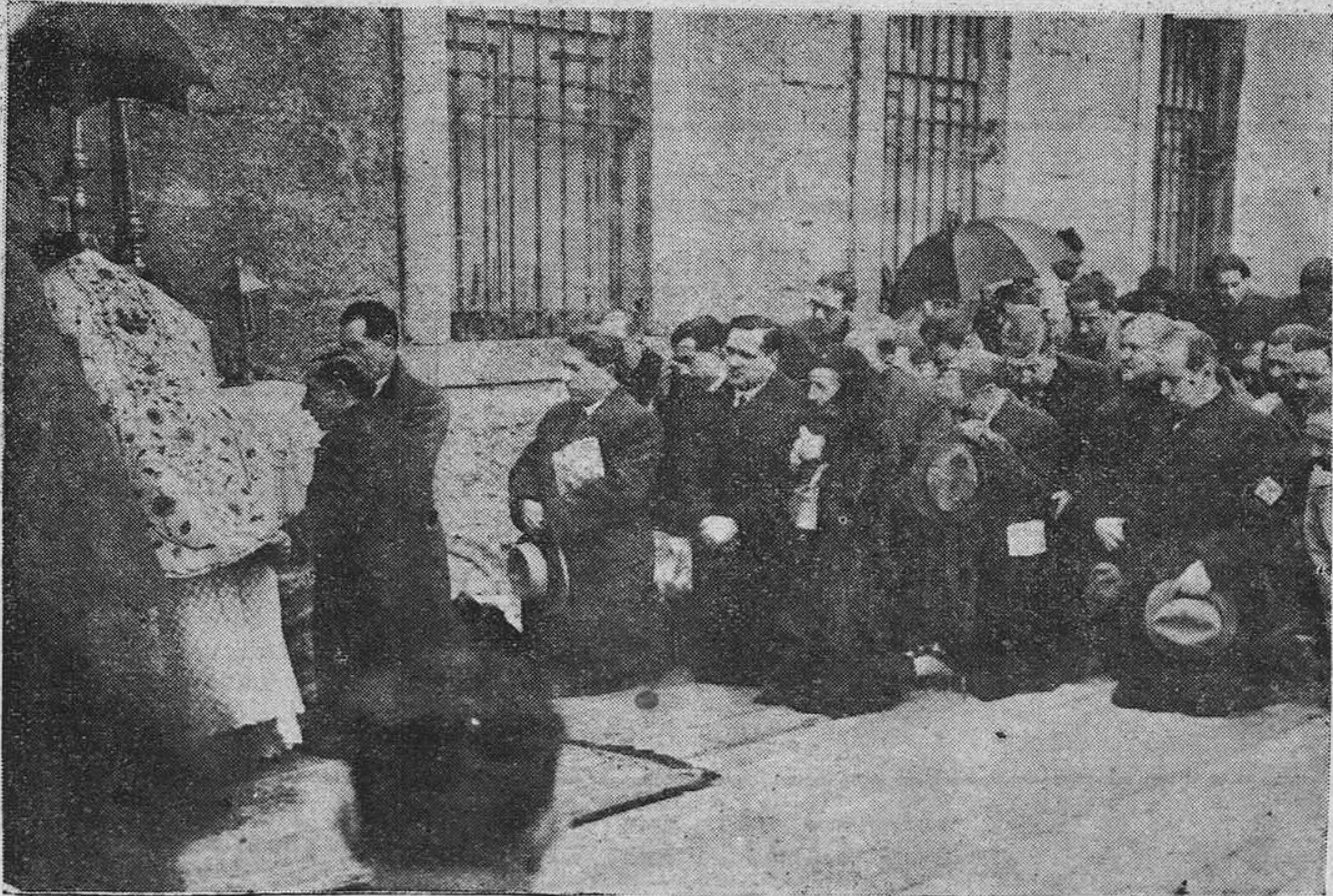
El Escorial.— El señor Gil Robles y los demás diputados de la minoría popular agraria, oyendo misa de campaña en la tribuna.