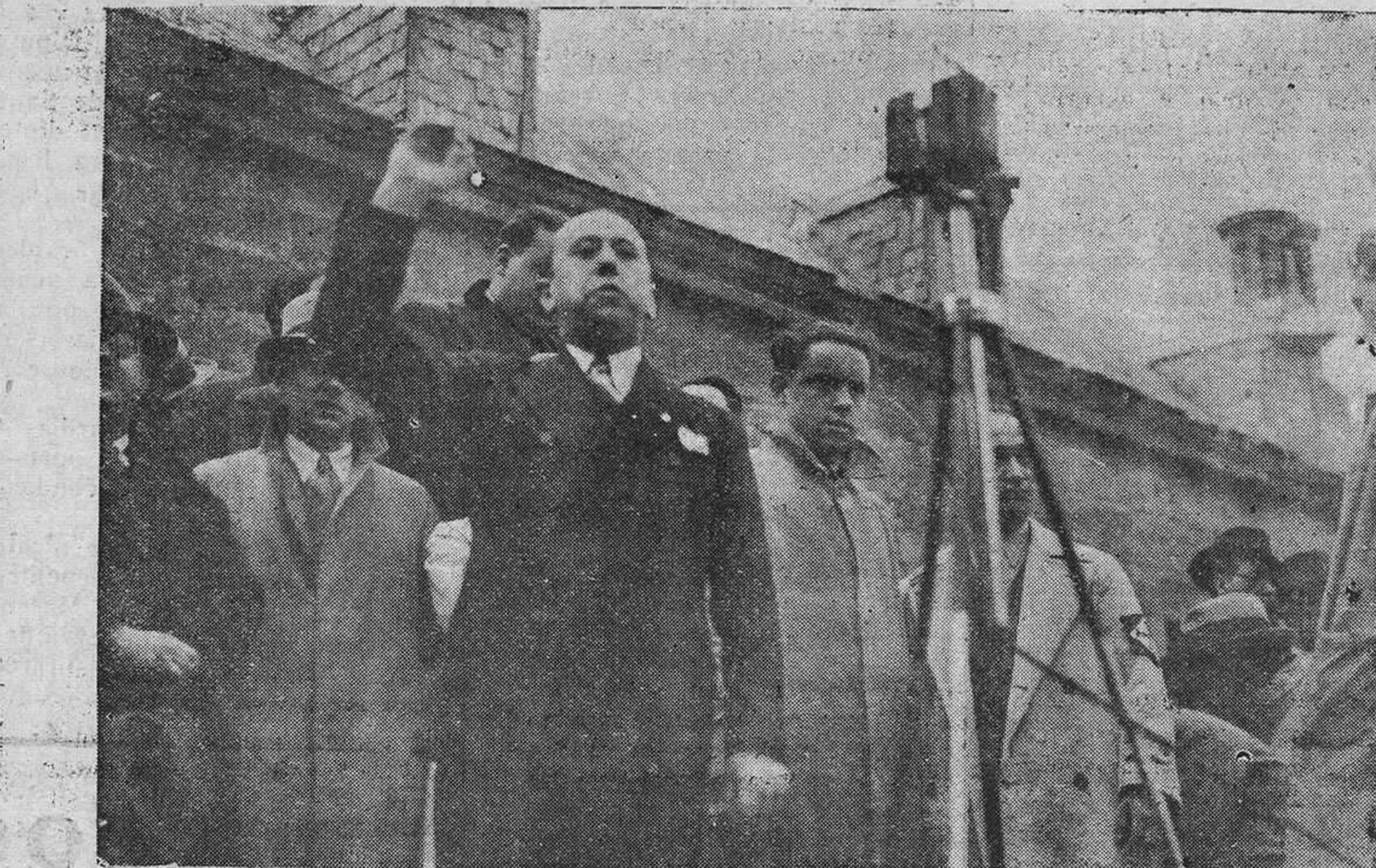
El Escorial.—El ilustre jefe de Acción Popular, don José María Gil Robles, pronunciando su discurso.

En nuestra información de ayer relatábamos todo lo esencial de los imponentes actos celebrados en El Escorial el domingo pasado. Dada su extensión, no quisimos alargarla más con algunos interesantes detalles, que reserva para hoy, puesto que no han perdido actualidad. Hablábamos, por ejemplo, ayer, del desbordamiento de fraternidad entre los representantes de unas y otras regiones. He aquí un hermoso caso que presenciamos. Subía por una calle un numerosísimo y bullicioso grupo de jóvenes, entre los cuales iba uno que tocaba, al mismo tiempo, la flauta y el tamboril, en cuyo parche aparecía pintada la insignia de Acción Popular. En dirección contraria venía otro grupo, no menos numeroso y con no menor algazara. Los muchachos rodeaban a los de ellos que, vistiendo pintorescos trajes, realizaban un curioso baile. Al encontrarse uno y otro grupo, preguntan los del segundo: —De dónde sois vosotros? —Somos sevillanos. ¿Y vosotros? —Nosotros, de Zamora. —Pues, ¡viva Zamora! —¡Viva Sevilla! Y allí fué el abrazarse y el cruzar las banderas y vitorearse mutuamente y el marchar los dos grupos confundidos, como si unos y otros jóvenes fueran cordialísimos amigos de toda la vida. Fuimos testigos de muchísimos hechos parecidos. Por dondequiera que iba algo típico de alguna región, los aplausos y las aclamaciones se sucedían ininterrumpidamente. España entera estaba allí y sus hijos se sentían más hermanos que nunca.