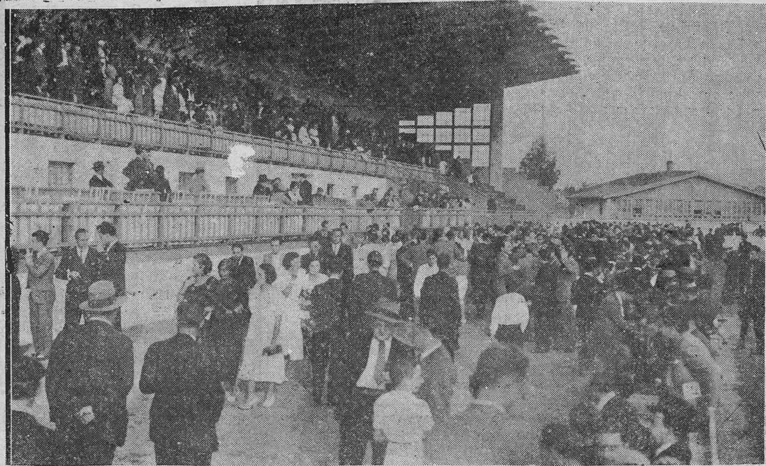
Durante los descansos de los partidos se organiza un paseo de gente por las pistas de Buenavista donde predomina el elemento femenino.